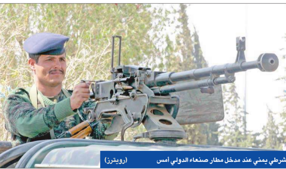
شرطي يمني عند مدخل مطار صنعاء الدولي أمس

القاهرة - محمد فتوح هاجمت مجموعة من علماء الدين المصريين المنضويين في «جبهة علماء الأزهر» مجمع البحوث الإسلامية التابع للأزهر الشريف، في بيان شديد اللهجة بعنوان «في جرائم حصار مصر وبيع أحيائها وترايتها وفساد علماء السوء فيها»، وذلك على خلفية فتوى علماء المجمع، التي أجازت إنشاء مصر الجدار الفولاذي في رفح على الحدود المصرية مع غزة. ووصف البيان علماء مجمع البحوث الإسلامية، الذين أيدوا إنشاء الجدار، بأن ملثمين مثل اليهود قائلًا: «لقد تولوا الذين كفروا كما فعل اليهود». كما تناولت انتقادهم شيخ الأزهر محمد سيد طنطاوي، وقالوا إنه «ساع له أن يقض بكتلتا يديه على مصمم قاتل أطفالنا ومدمر بيوتنا ومنتهك أعراض المسلمين في قانا وغيرها، ولما افتضح أمره اعتذر بما أراده في أعين كل ذي عين وبصيرة، ثم تناصر معهم بمجمعه ضد دينه، وضد عباد الله المستضعفين من