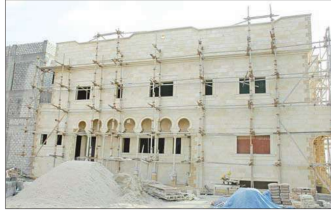
بيوت في انتظار توزيعها