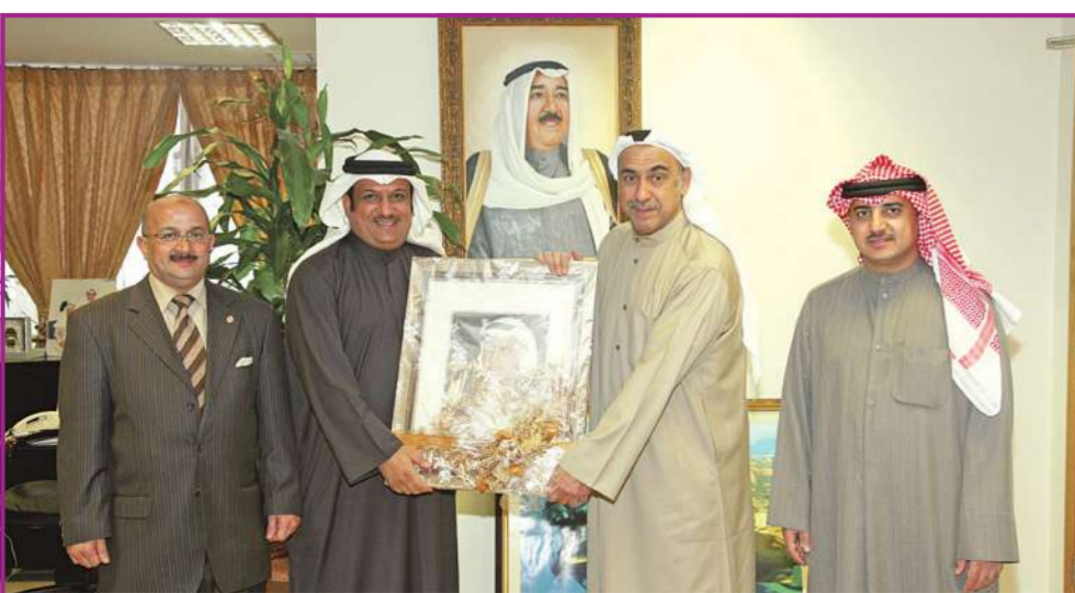
هدية تذكارية مقدمة من وفد مدرسة بلاط الشهداء إلى «الهيئة»