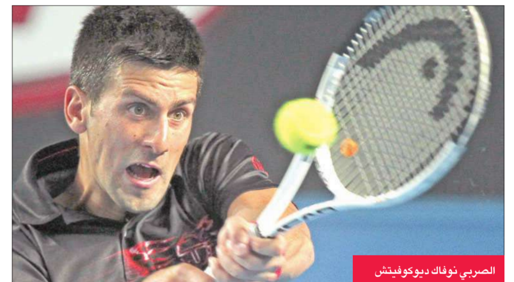
الصربي نوفاك ديوكوفيتش

ولحقت الصربية آنا إيفانوفيتش المصنفة أولى عالمياً سابقاً والمشرور حالياً بركب المتأهلات إلى الدور الثاني بفوزها على الأميركية شيناي بيرى 2-6 و3-6. وتحاول إيفانوفيتش التي خسرت نهائي استراليا المفتوحة أمام الروسية ماريا شارابوفا عام 2008، أن تضع وراءها عاماً مخيباً بعد أن تعرضت لإصابات متكررة أثرت سلباً على مستواها.