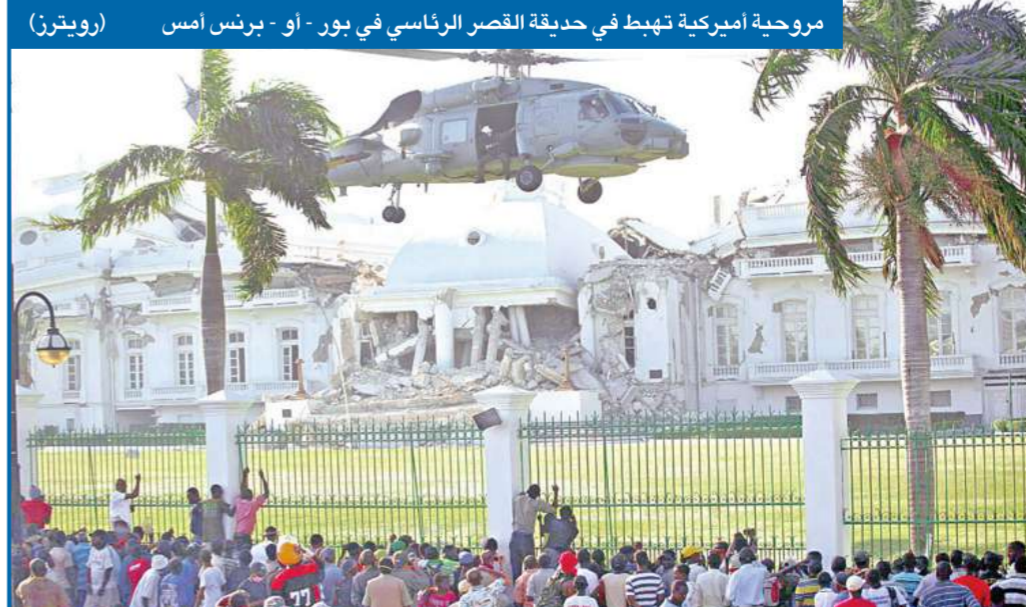
مروحية أميركية تهبط في حديقة القصر الرئاسي في بور - او - برنس أمس

تحول قانون الضريبة العقارية الذي أصدره مجلس الشعب المصري العام الماضي إلى محور لمعركة سياسية جديدة، تدور في الخفاء بين «الحرس القديم» و«التيار الإصلاحي» داخل الحزب الوطني الديمقراطي الحاكم، إذ أبدى وزير المالية يوسف بطرس غالي، الذي ينتمي إلى «الإصلاحيين»، تمسكه بالقانون دون تعديل، رغم تشديد الرئيس حسني مبارك على أن الأمر لم يُحسم بعد. وبعد يومين من إعلان مبارك أنه يفكر في البحث عن أسلوب متدرج لتطبيق الضريبة العقارية وتحديد نسبها لتبدأ من 1 في المئة ثم تزيد تدريجياً، قال غالي أمس إن وزارته ستنتقد تعليمات الرئيس دون تغيير أو تعديل القانون. 02