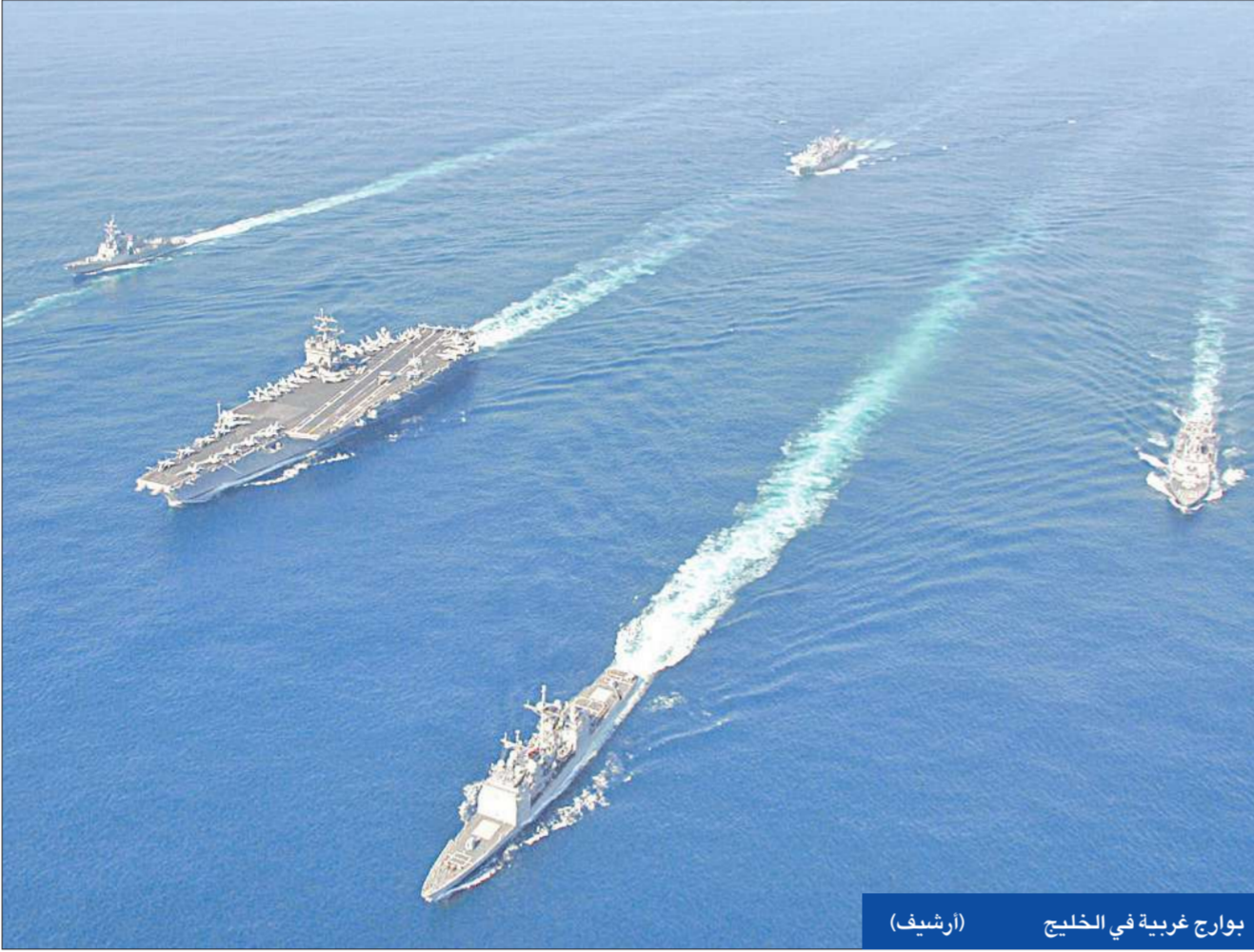
بوارج غربية في الخليج (أرشيف)

أعلن وزير الدفاع الإيراني العميد أحمد وحيدى في كلمة القاها صباح أمس، أمام «الملتقى الدولي للخليج الفارسي» المنعقد في طهران، أن الأساطيل الغربية في الخليج ستكون أفضل هدف للقوات الإيرانية في حال الاعتداء على بلاده. ورأى وحيدى أن منطقة الخليج باتت تنبؤا مكانة رئيسية بسبب موقعها، لأنها تشكل نقطة تلاقي مصالح القوى الكبرى.