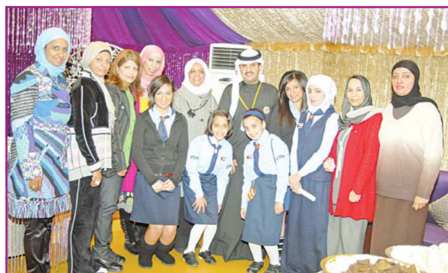
فريق عمل جمعية المرشدات بتوسطه الشيخ دعيج

صدر القرار الوزاري بإقامة مخيم السلام السنوي الثالث عشر، بمركز التدريب لجمعية المرشدات الكويتية للمرحلتين الثانوية والمتوسطة خلال الفترة من 27 يناير إلى 3 فبراير المقبل تحت شعار "معاً نتعاون للتغيير تحت رعاية وزيرة التربية وزيرة التعليم العالي د. موضي الحمود، وقد قامت مرشدات وقائدات وموجهات منطقة العاصمة التعليمية ترافقهن رئيسة جمعية المرشدات الكويتية بزيارة الشيخ دعيج الخليفة الصباح لدعوته إلى رعاية اليوم الوطني.