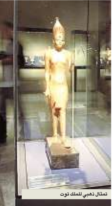
تماثيل ذهبي للملك توت