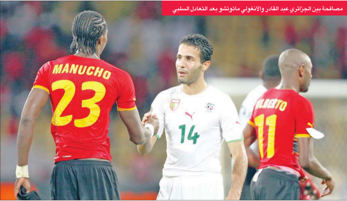
مصافحة بين الجزائري عبد القادر والأنغولي ماتوتشو بعد التعادل السلبي

تأهل منتخب أنغولا والجزائر لربع نهائي كأس الأمم الإفريقية، بعد تعادلها من دون أهداف، بينما ودع المنتخب المالي البطولة رغم فوزه الكبير على مالوي بثلاثية، وذلك في ختام منافسات الجولة الثالثة من المجموعة الأولى.