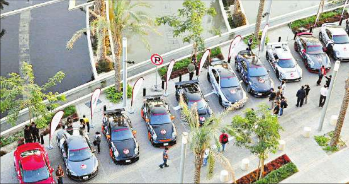
السيارات المشاركة في GulfRun