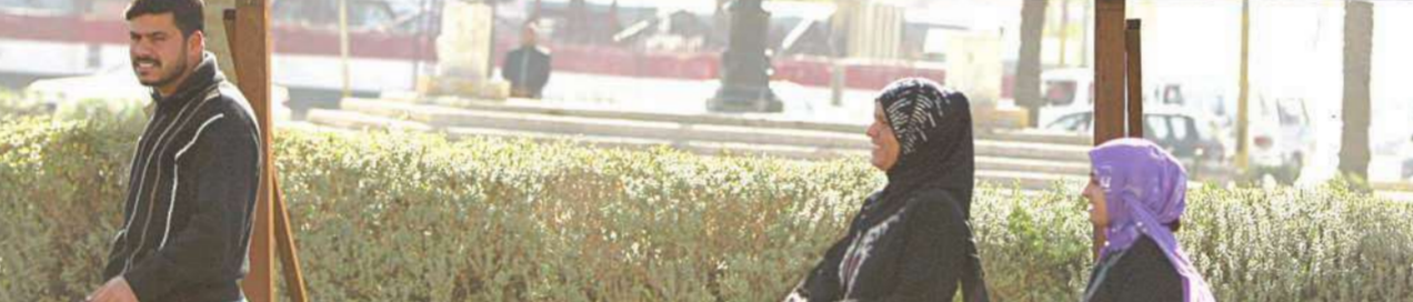
عراقيون يرون في بغداد أمس، أمام لافتة تدعو إلى المشاركة في الانتخابات

الصوت على الإقراء الأبية www.aljarida.com www.thehigh.com www.thehigh.com