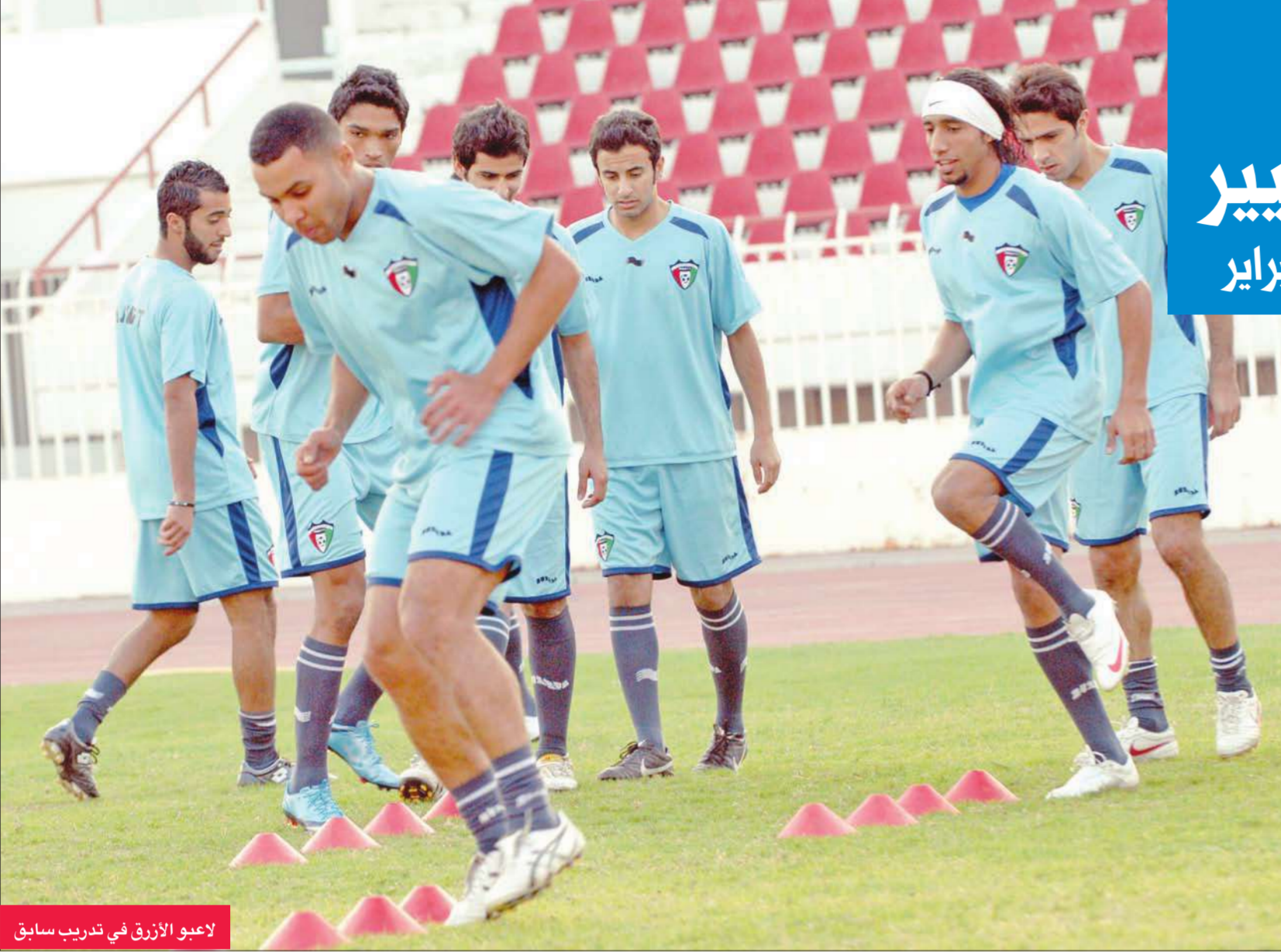
لاعبو الأزرق في تدريب سابق