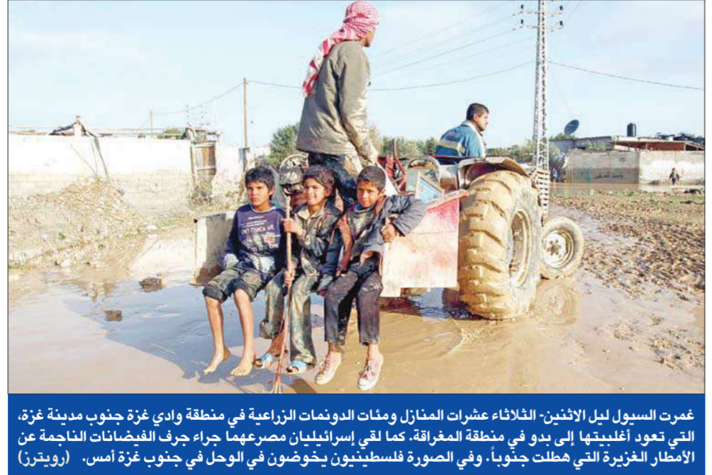
غمرت السيول ليل الاثنين-الثلاثاء عشرات المنازل ومئات الدونمات الزراعية في منطقة وادي غزة جنوب مدينة غزة، التي تعود أغلبيتها إلى يدو في منطقة المعرارة. كما لقي إسرائيليان مصرعهما جراء جرف الفيضانات الناجمة عن الأمطار الغزيرة التي هطلت جنوباً. وفي الصورة فلسطينيون يخوضون في الوحل في جنوب غزة أمس. (رويترز)

ضربت موجة جديدة من الأمطار الغزيرة أمس، مدن وسط سيناء والعريش، وذلك لليوم الثاني على التوالي، في وقت أفادت التقارير عن مقتل 17 مصرياً أمس الأول. وبدأت الجهات الحكومية في المحافظات المنكوبة حصر أعداد القتلى والمفقودين والمصابين والأضرار المادية، لتقدير حجم التبعيضات المقررة للمنكوبين بعد توجيهات الرئيس المصري حسني مبارك بتعويض المنكوبين، وبسرعة إيواء من تهدمت منازلهم. وبحسب التقارير الأولية، انهار 430 منزلاً في أنحاء متفرقة من محافظة أسوان، ما خلف عدداً من القتلى، وبلغ عدد الإصابات 50 حالة، في حين تحدثت التقارير عن وجود عشرات المفقودين ودمرت خطوط المواصلات الرئيسية، ودمرت محاصيل القمح والقصب. وفي سيناء تم إخلاء مستشفى العريش ونقل المرضى إلى مستشفى آخر بعد وصول مياه الأمطار إليه، وغرق مخازن الأدوية وبعض الغرف في الدور الأول. في الوقت الذي تشهد فيه منطقة جنوب سيناء تحسناً في الأحوال الجوية بعد انحسار موجات عمال وقرق