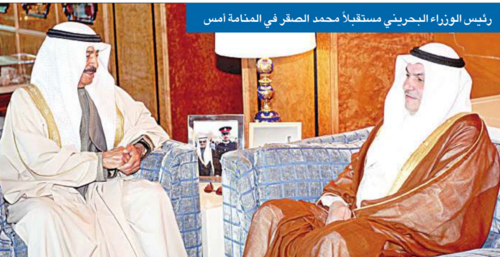
رئيس الوزراء البحريني مستقبلاً محمد الصقر في المنامة أمس

استقبل أمس ملك البحرين الشيخ حمد بن عيسى آل خليفة في المنامة رئيس المجلس العربي للعلاقات الإقليمية والدولية، والرئيس السابق للبرلمان العربي محمد جاسم الصقر، الذي يزور مملكة البحرين. ونوه العاهل البحريني بالجهود التي قام بها الصقر أثناء ترؤسه البرلمان العربي، مؤكداً دعم بلاده أي جهد يهدف إلى تقريب وجهات النظر العربية ويساهم في طرح قضايا العرب على الساحتين الإقليمية والدولية، بما يحقق أهداف الأمة العربية. وكان الصقر التقى في وقت سابق أمس رئيس الوزراء البحريني الأمير خليفة بن سلمان آل خليفة، 02