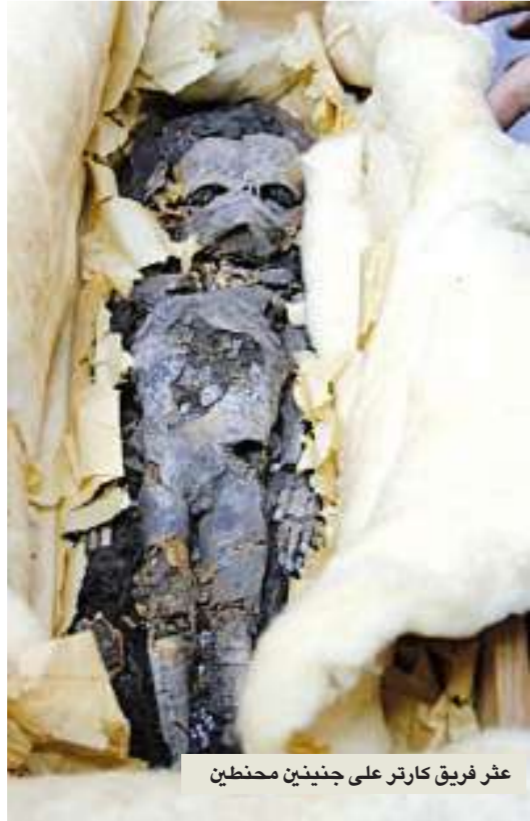
عثر فريق كارتر على جنينين محنطين

لم يعد بالإمكان الإنكار أن هوارد كارتر، تاجر التحف، استحوذ على مقتنيات توت عنخ أمون وسمّى لنفسه بسرعة تحف من قبر عمه 3300 سنة. لكن تفاصيل هذه الخديعة لم تطل إلا مجزأة. كذلك فقدت نظرية كارتر عن لصوص في الأزمنة القديمة صدقيتها. فقد اتضح أن حججه تقوم على المبالغلة وأحياناً الترهات. مثلاً ادعى أنه اكتشف «أثار حذاء آخر منظر، على غلاف قوس أبيض. لكن كروس، عالم الآثار الألماني، تفحص الصورة التي التقطت في عشرينات القرن الماضي عشر واستخلص: «لا شك في أن علامة الحذاء واضحة في الصورة. إلا أنها ليست من مخلفات صندل مصري، بل أحذية عصرية لها كعب، وقد تكون علامة حذاء كارتر نفسه».