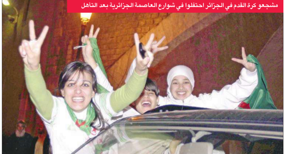
مشجعو كرة القدم في الجزائر احتفلوا في شوارع العاصمة الجزائرية بعد التأهل

ودع منتخب مالي البطولة رغم فوزه على نظيره مالوي 3-1، إذ لم يشفع للشعور المالية هذا الفوز في التأهل للدور التالي، بعدما رفع رصيده إلى أربع نقاط ليحتل المركز الثالث في المجموعة بفارق الأهداف خلف الجزائر صاحبة المركز الثاني ونقطة واحدة خلف أنغولا متصدرة المجموعة، بينما تجدد رصيد مالوي عند ثلاث نقاط في المركز الرابع الأخير. سيطر منتخب مالي على مجريات اللعب طوال أحداث شوطي المباراة، وتمكن من هز شبك المنتخب المالوي عن طريق مهاجم إثيوبية فريدريك كانوتيه في الدقيقة الأولى من الشوط الأول، بعدما سدده