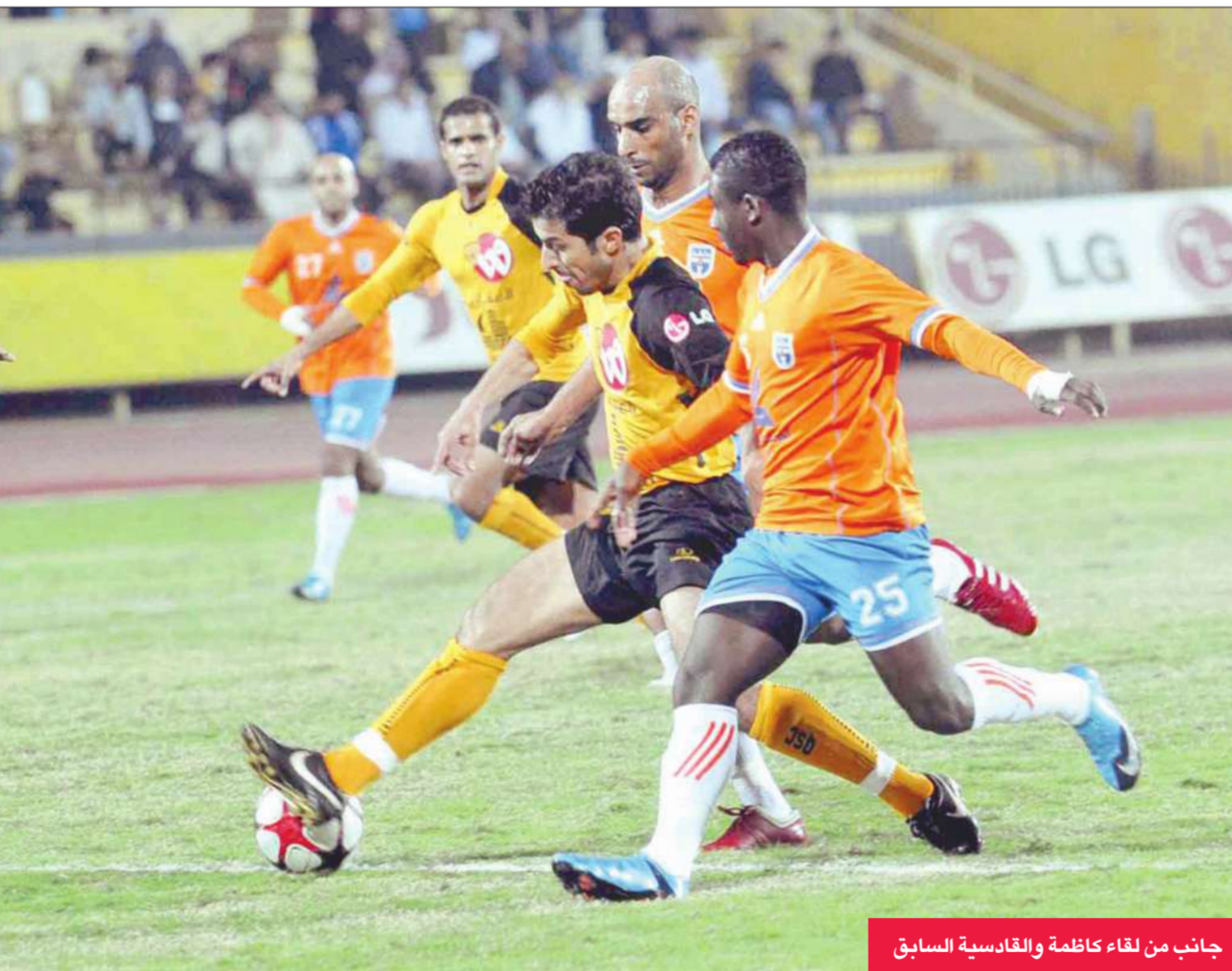
جانب من لقاء كاظمة والقادسية السابق