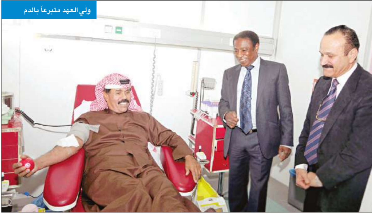
ولي العهد متبرعاً بالدم

وحدث سموه بالدم، وذلك لخدمة المرضى، وقد أشاد سموه بجهود العاملين في هذا القطاع النبيل، مؤكداً ضرورة العمل على تفعيله وتطويره. ومن جانبه، أشاد الفريق العامل في بنك الدم بمبادرة سموه التي تجسد الروح الإنسانية في التبرع الطوعي بالدم.