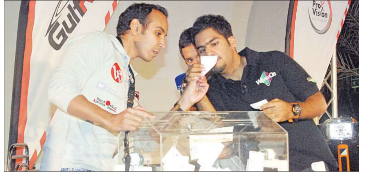
لقطة السحب على تذاكر دراجتي "فيسبا"