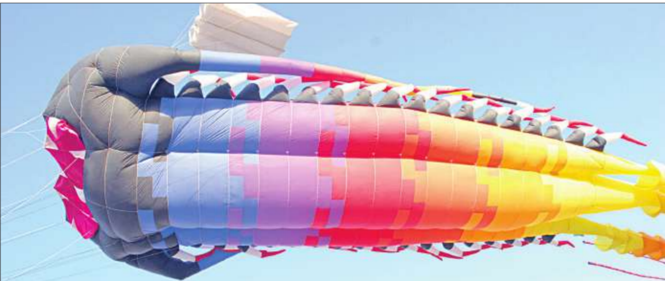
جانب من عرض الطائرات الورقية

واصل فريق الفارسي للطائرات الورقية هوايته في إطلاق الطائرات بأشكالها المختلفة التي غطت سماء منطقة جنوب السرة، وقد اجتمع الأطفال والكبار والشباب ليتباروا في إطلاقها، تعبيراً عن فرحتهم بالمشاركة. وقد تجمهر الأطفال وحشد كبير من أهالي المنطقة لرؤية الطائرات الورقية، للاستمتاع بأجوائها الخلابة والوانها الجذابة.