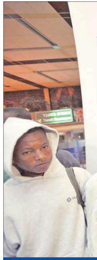
المجموعة الأولى من قرابة ثلاثة آلاف يهودي أثيوبي صدقت الحكومة الإسرائيلية على هجرتهم إلى إسرائيل، عند وصولهم إلى تل أبيب أمس