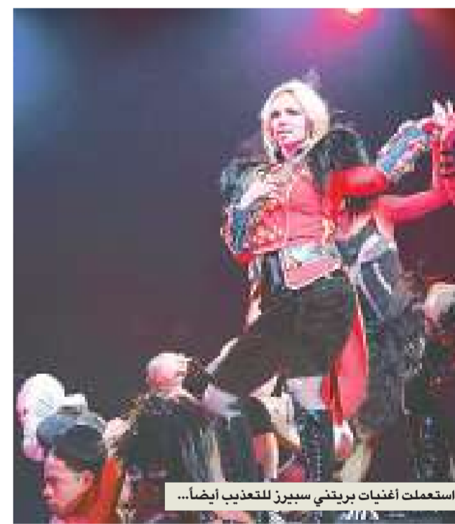
استعملت أغنيات بريثي سبيرز للتعذيب أيضاً...

إدان بعض الفنانين بشدة هذه الممارسات بمن فيهم فرقة Massive Attack البريطانية، صاحبة أغاني التريب هوب، مغني الروك الأمريكي ترينت ريزنور، ونجمة الموسيقى الريفية روزان كاش. يُطالب هؤلاء بالأستعمال لموسيقى البوب كسلاح، ويرغبون في معرفة كيف تستخدم موسيقاهم في السجون الأميركية من جهةتها، تؤيد المنظمات البريطانية والأميركية جهود الموسيقيين. تقدمت منظمة حقوق الإنسان الأميركية، National Security Archive، التي تكافح سياسات الحكومة الأميركية الرامية إلى الحفاظ على سرية الوثائق، بعريضة خاصة بقانون حرية الوصول إلى المعلومات، مطالبة بنزع السرية عن الوثائق الحكومية بشأن استخدام الموسيقى في عمليات الاستجواب. تطالب العريضة بالإفصاح عن وثائق موجودة في 11 مؤسسة حكومية وترد فيها العبارات التالية: AC/DC، Aerosmith، أغنية Barney & Friends، The Bee Gees، بريثي سبيرز، بروس سيرينغستين، كريستينا أغيلييرا، فايد غراي، فرقة Deicide، دون ماكليين، Dope، دكتور ري، Hed P. E، جيمس تايلور، Limp Matchbox، ماريلين مانسون، Bizkit، Twenty، ميت لوف، أغنية إعلان طعام القطط Metallica، Meow Mix، نايل دياموند، Nine Inch Nails، رايك بريس، كوين، Rage Against the Machine، Red Hot Chili Peppers، ريدمان، Saliva، موسيقى برنامج Sesame Street، Stanley Brothers، نشيد العلم ذو النجوم المتألثة، وتويك شاكور». أجرى الموظفون في مارس (آذار)