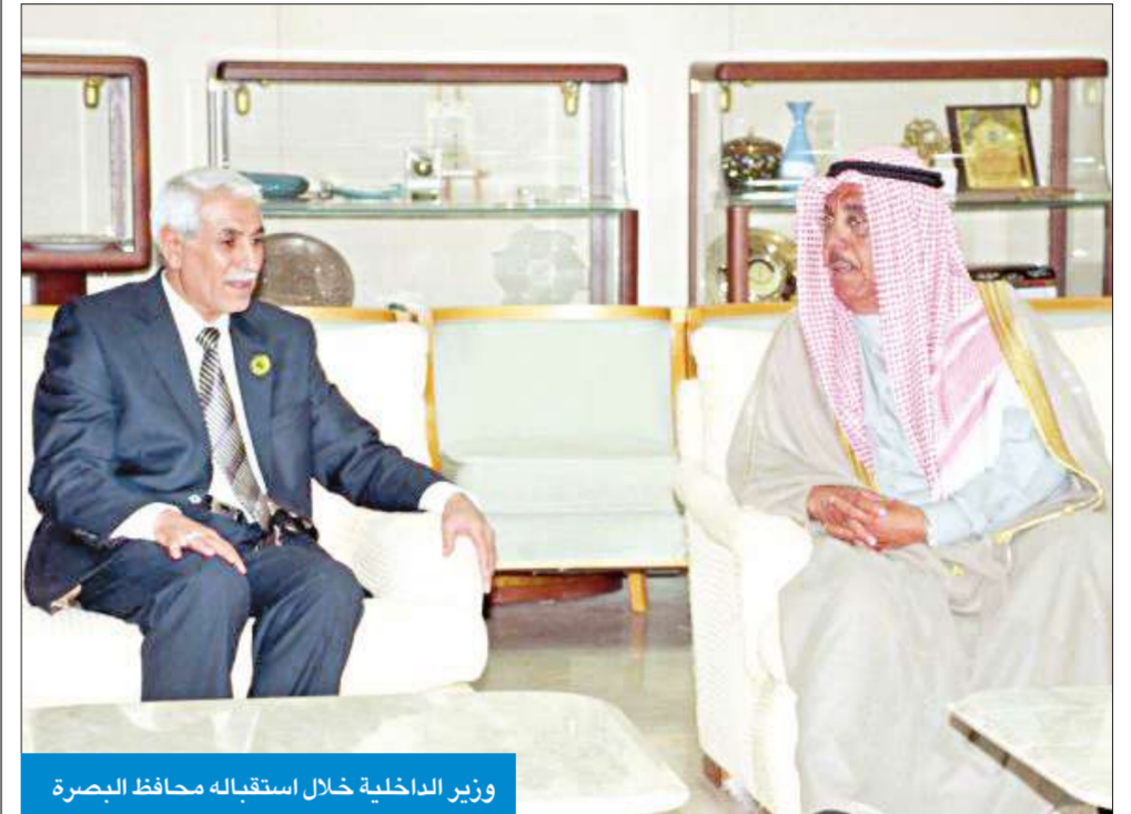
وزير الداخلية خلال استقباله محافظ البصرة

أكد وزير الداخلية الشيخ جابر الخالد خلال استقباله محافظ البصرة محافظة البصرة بجمهورية العراق برئاسة الدكتور شلتاغ عبود المياح محافظ البصرة اهتمام الكويت بأمن العراق وتعزيز الروابط بين البلدين.