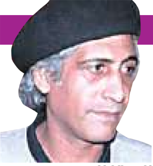
زاهر الغافري zaheralghafri@yahoo.se