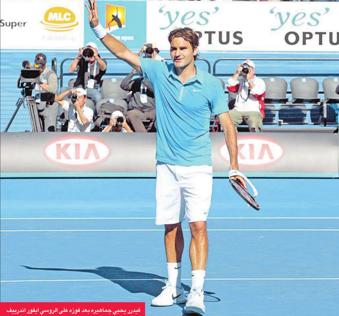
فيدرر يحيي جماهيره بعد فوزه على الروسي إيغور أندريف

حقق كل من السويسري روجيه فيدرر المصنف الأول والصربي نوفاك ديوكوفيتش الثالث والألمانية سيرينا وليامس، المصنفة الأولى وحاملة اللقب انطلاقاً ناجحة في بطولة استراليا المفتوحة، أولى البطولات الأربع الكبرى في كرة المضرب.