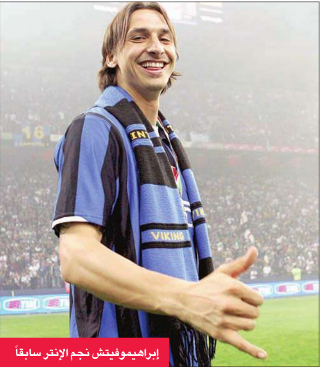
إبراهيموفيتش نجم الإنتر سابقاً

خط وسط روما ومنتخب إيطاليا، بينما نال جوليو سيزار لاعب إنتر ميلان جائزة أفضل حارس مرمرى.