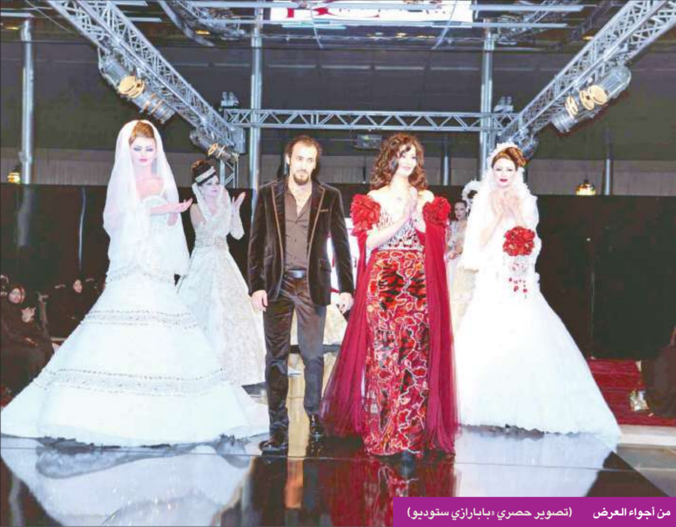
من أجواء العرض