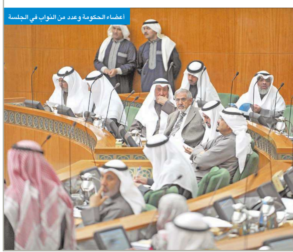
أعضاء الحكومة وعدد من النواب في الجلسة

تعديلات «المرئي والمسموع» تعرض في اجتماع مجلس الوزراء المقبل