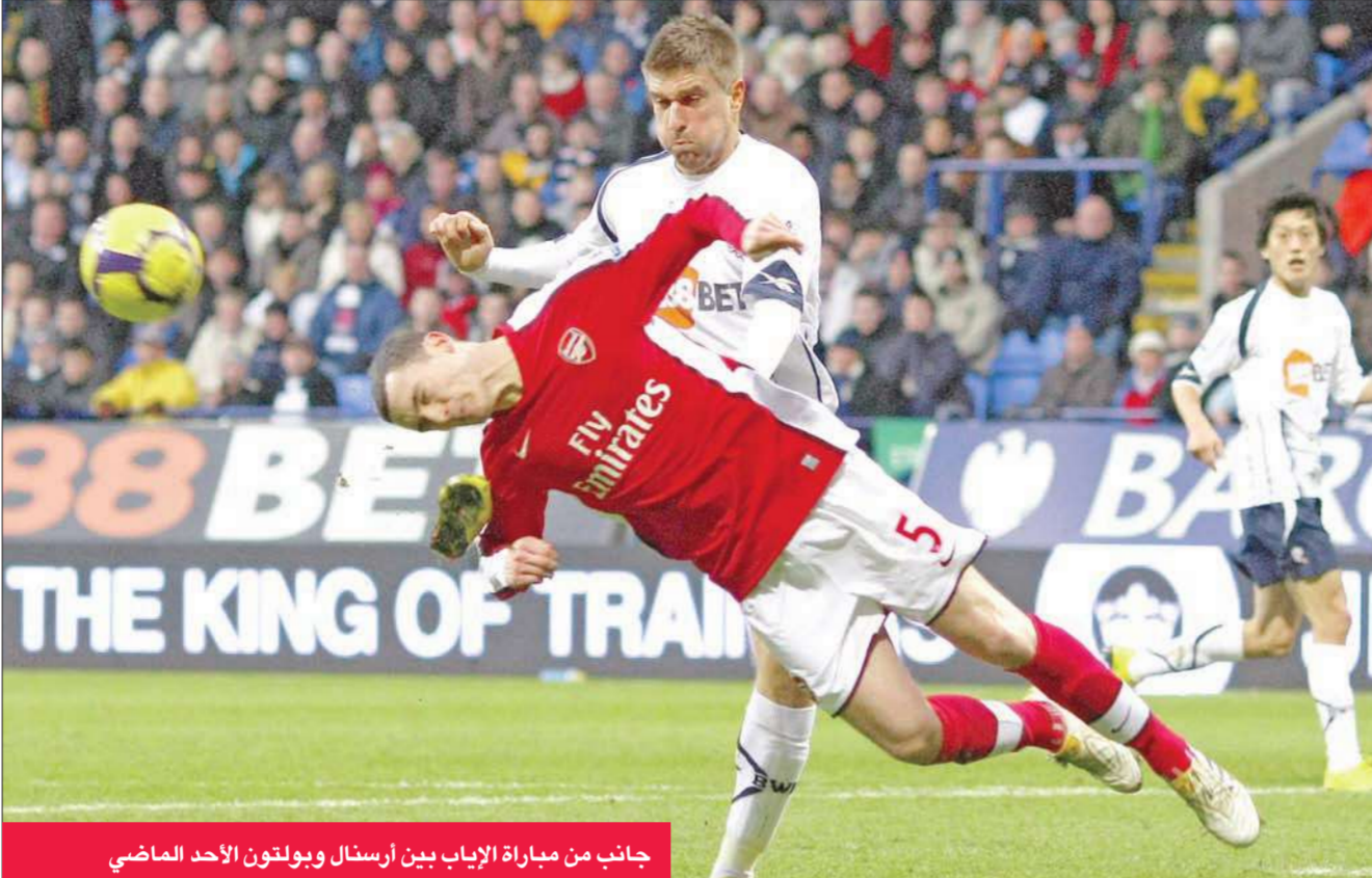
جانب من مباراة الإياب بين أرسنال وبولتون الأحد الماضي

يستقبل فيورنتينا ضيفه لاتسيو اليوم الأربعاء ضمن منافسات دور الثمانية لمسابقة كاس إيطاليا لكرة القدم، بينما تقام اليوم أيضا مباراتان مؤجلتان من الدوري الإيطالي، إذ يلتقي جنوى مع باري وبولونيا مع اتالانتا.