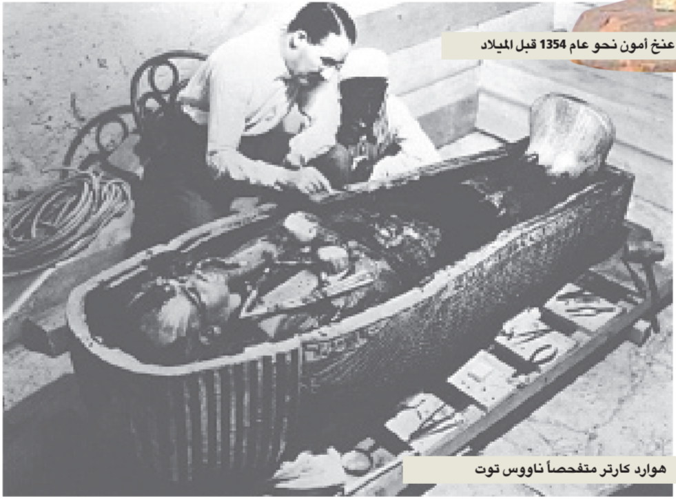
هوارد كارتر متفحصاً ناووس توت

يبحث فريقاً من العمال على العمل بصداب. ولكنه واجه خيبات الأمل المتتالية. وبعد أربع سنوات، كانت ستبقيت قليلة تفصل المجموعة عن اكتشافها العظيم. لكن كارتر سحب عماله وتابع الحفر في مكان آخر. بشكل تصرفه هذا لدليل على النظرية القائلة إن كارتر وصل إلى مدخل القبر في تلك المرحلة. إلا أنه لزم الصمت لأسباب تقنية، مخبئاً هذه الورقة الراحلة. والمؤكد أنه عندما أراد كارنارفون سحب تمويهه في صيف عام 1922، تقدمت أعمال التنقيب بسرعة مفاجئة. وعاد كارتر إلى بريطانيا حيث رجا كارنارفون ليجنحه التمويل لحملة أخيرة.