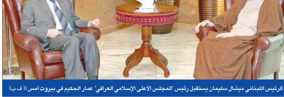
الرئيس اللبناني ميشال سليمان يستقبل رئيس المجلس الأعلى الإسلامي العراقي عمار الحكيم في بيروت أمس

الذي أشار إلى أن اللقاء «تناول المواضيع التي سيجري بحثها، والعلاقات الثنائية والاتفاقيات التي سيتم توقيعها في باريس»، معتبراً أن «هذه المواضيع تؤكد أن العلاقة بين لبنان وفرنسا غنية وثابتة ومتنوعة».