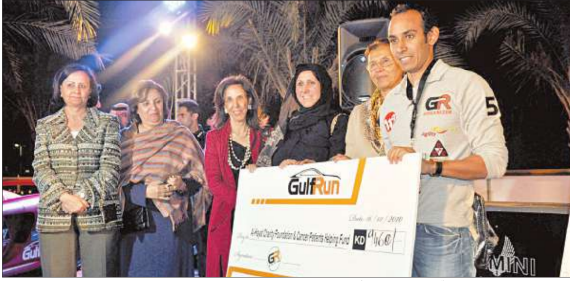
تسليم شيك ريع السحب لمصلحة مركز الحياة لعلاج أمراض السرطان

ضمن إطار الاستعداد للمشاركة في سباق البحرين الدولي، أجرى السحب الكبير في مجمع 360، بحضور حشد جماهيري غفير وتغطية مميزة من وسائل الإعلام المقروءة والمرئية على تذاكر دراجتي "فيسبا"، والتي سيرصد ريعها لمصلحة مركز الحياة لعلاج أمراض السرطان.