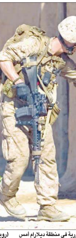
جندي اميريكي يصافح طفلاً أفغانين خلال دورية في منطقة ديلارام أمس

وكشف التقرير، الذي حمل عنوان «الفساد في أفغانستان»، أن 59 في المئة من الشعب الأفغاني يشعرون بان «الفساد يمثل مشكلة أكبر من انعدام الأمن» (54 في المئة) والبطالة (52 في المئة). وصرح المدير التنفيذي للمكتب أنتونيو ماريا كوستا بان «الأفغان يقولون إنه من المستحيل الحصول على خدمة عامة دون دفع رشاً». واستناداً إلى مقابلات أجريت مع 7600 شخص في 12 من عواصم الولايات الأفغانية، وأكثر من 1600 قرية في أنحاء أفغانستان، أشار التقرير إلى أن الفساد يمثل جزءاً من الحياة اليومية في البلاد، مضيفاً أنه «خلال فترة الاستطلاع، تعين على واحد من كل اثنين من الأفغان دفع رشوة واحدة على الأقل لمسؤول حكومي. وفي 56 في المئة من الوقت كان الموظفون يطلبون الرشوة جهراً». (كابول - أ ف ب، يو بي أي، رويترز)