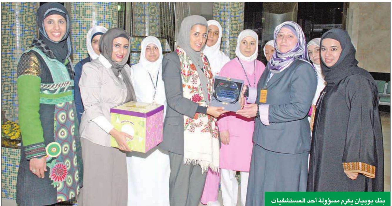
بنك بوبيان يكرم مسؤولة أحد المستشفيات

أنهى بنك بوبيان بنجاح حملة توزيع «هدية الأم حديثة الولادة» للأمهات في عدد من المستشفيات المختارة في الكويت وذلك في