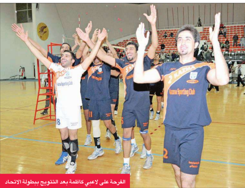
الفرحة على لاعبي كاظمة بعد التتويج ببطولة الاتحاد

وأفصح البحوه عن توقعاته لشكل المنافسة خلال الدوري قائلًا أن فرص الفريق الأربعة الكبار كاظمة والقادسية والعربي والكويت متساوية بلدؤها المربع الذهبي، وذلك متوقع بنسبة كبيرة، لكن الفريق الذي سيتعامل مع الأدوار النهائية باحترافية أكثر وتركيز عال