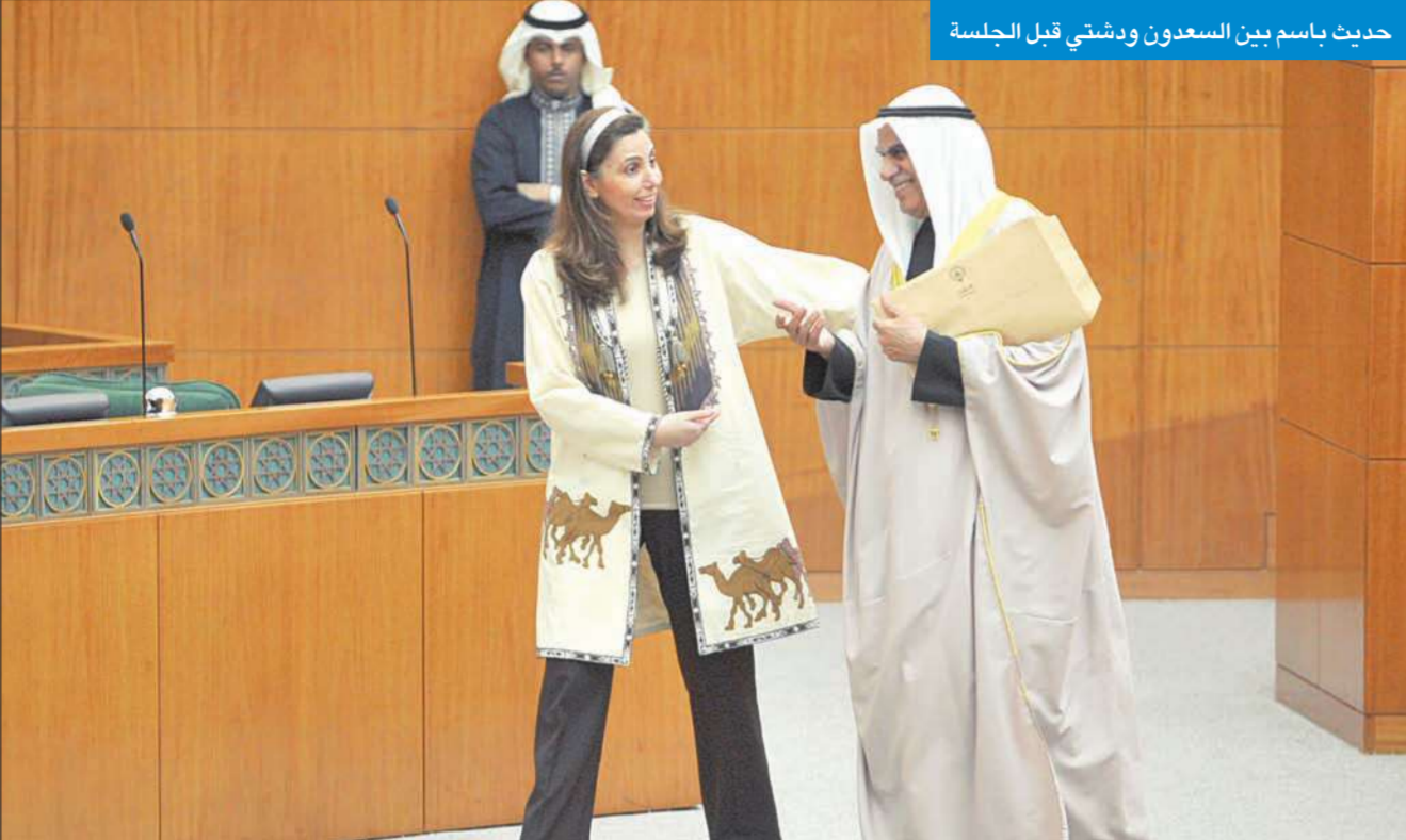
حدثت باسم بين السعودون ودشتي قبل الجلسة