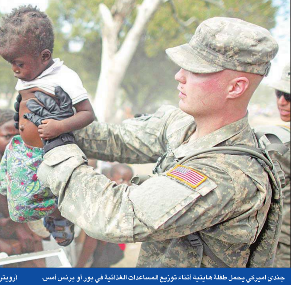
جندي اميريكي يحمل طفلة هايتية أثناء توزيع المساعدات الغذائية في بور أو برنس أمس.

وأملت فرق الإنقاذ الدولية، جهودها الضئيلة بحثاً عن الأشخاص المفقودين تحت أنقاض المباني في عاصمة هايتي بورت أو برنس، بعد قرابة أسبوع من الزلزال المدمر الذي ضرب الجزيرة. وأفادت المفوضية الأوروبية بأن 200 ألف قتيل، تم انتشال نحو سبعين ألفاً منهم، ونقلوا إلى قبور جماعية.