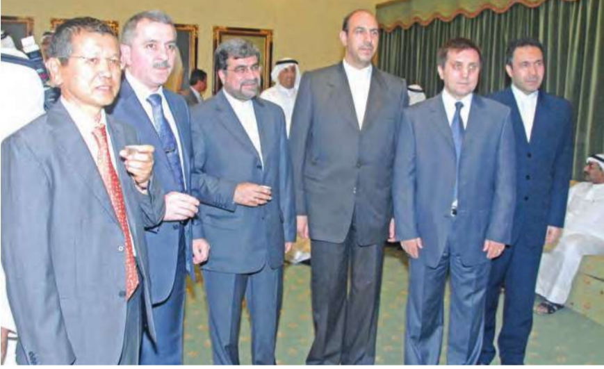
عدد من السفراء يقدمون التهانني