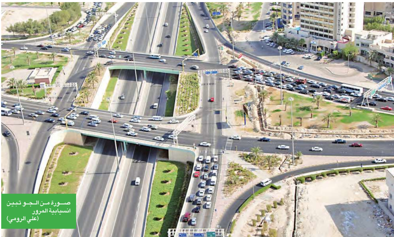
صورة من الجو تبين انسيابية المرور (على الرومي)