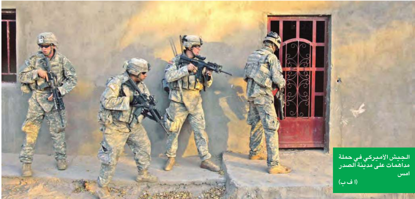
الجيش الأميركي في حملة مدهمة على مدينة الصدر امس (أ ب)

أعلنت وزارة الدفاع العراقية امس انها تسلمت 18 طائرة روسية حديثة تتمتع بمزايا ومواصفات قتالية عالية لاستخدامها في مجالات متعددة، مثل النقل والاستطلاع والقتال وحماية انابيب النفط وشبكات الكهرباء. وقال المتحدث باسم وزارة الدفاع اللواء محمد العسكري في تصريح للصحافيين ان الطائرات ستستخدم