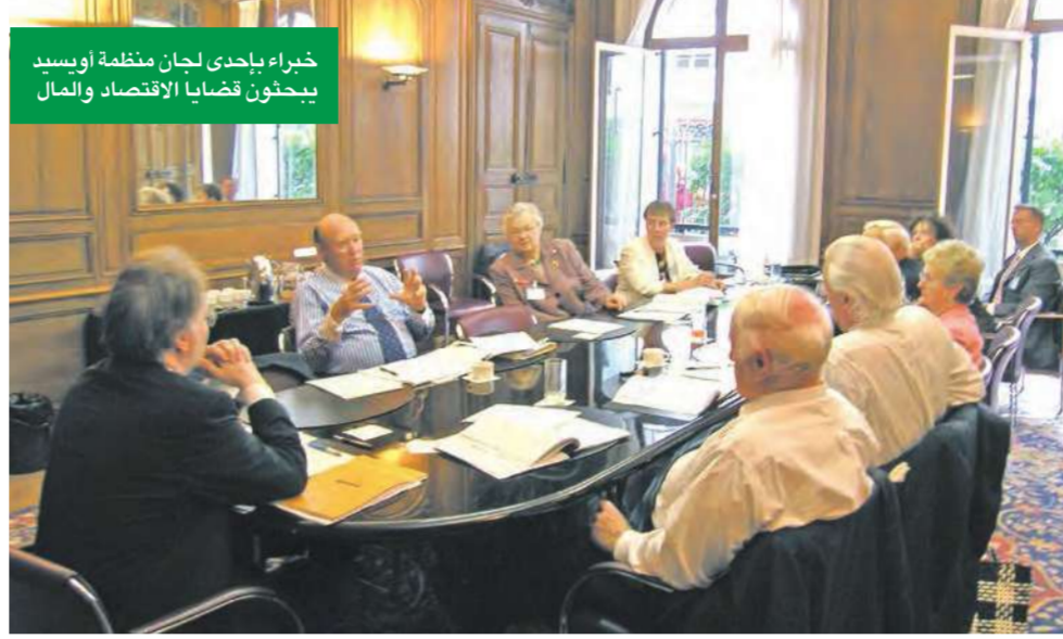
خبراء يجادلون لجان منظمة أوبسند يبحثون قضايا الاقتصاد والمال

قدّرت اللجنة المشتركة حول القضايا الضريبية التابعة للكونغرس أنه بين العائلات التي تحبب دخلاً إجماليًا معادلاً قدره 75000 دولار سنوياً، سيخسر عدد كبير فوائد ضريبية تقف ما قد يكسونه ضمن إطار الائتمان الضريبي بحلول عام 2009. وبحلول العام