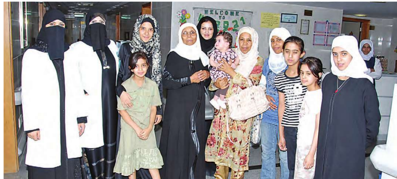
لقطة تذكارية لوفد مركز الفتيات

زارت مجموعة من عضوات مركز فتيات الجبراء التابع للهيئة العامة للشباب والرياضة، المرضى في مستشفى الجبراء، وذلك ضمن الأنشطة التي تقوم بها الفتيات خلال صيف 2007.