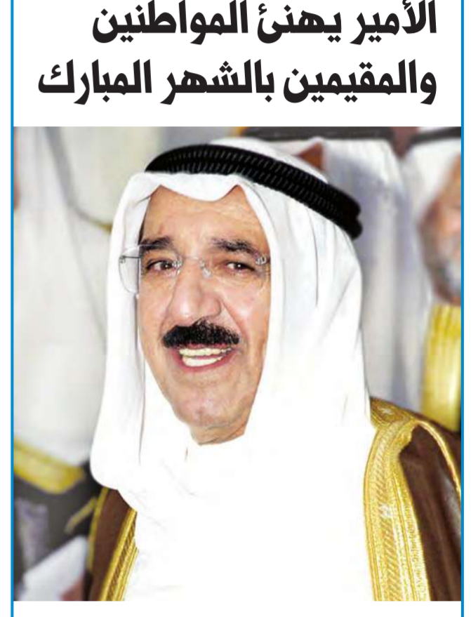
محمد راشد أعلنت هيئة الرؤية الشرعية مساء امس ان اليوم هو المكمل للملايين من شعبان، وعليه فإن غداً الخميس هو غرة شهر رمضان المبارك. ونقل الديوان الأميري الى المواطنين الكرام والمقيمين تهاني سمو أمير البلاد الشيخ صباح الأحمد بحلول شهر رمضان المبارك. وأعلن أن سموه يستقبل المهنيين بهذا الشهر المبارك في اليومين الأول والثاني، من الثامنة مساء وحتى العاشرة، في قاعة. 02