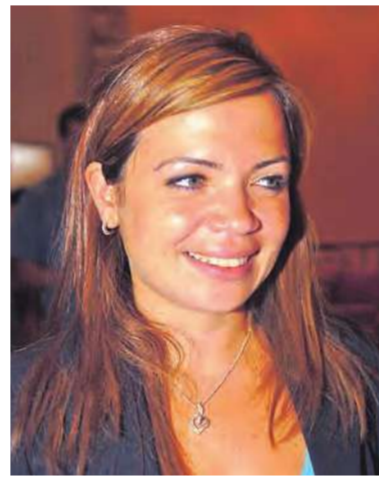
مشاركة في ورشة عمل الفندق