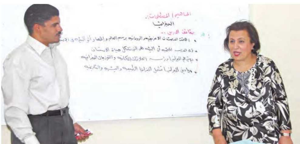
وزيرة التربية تتفقد أحد الفصول الدراسية

جالت على مدارس الفروانية والجهراء وأكدت أن غياب القيادات التربوية لن يؤثر على جاهزية العام الدراسي