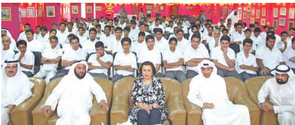
قيادات التربية أثناء الجولة