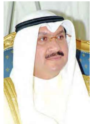
الشيخ سالم الصباح

سالم الصباح: ستتخذ الإجراءات المناسبة عند خفض الفائدة الأميركية