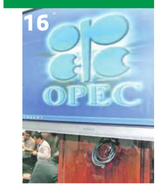
«أوبك» تطمئن الأسواق برفع الانتاج نصف مليون برميل يومياً