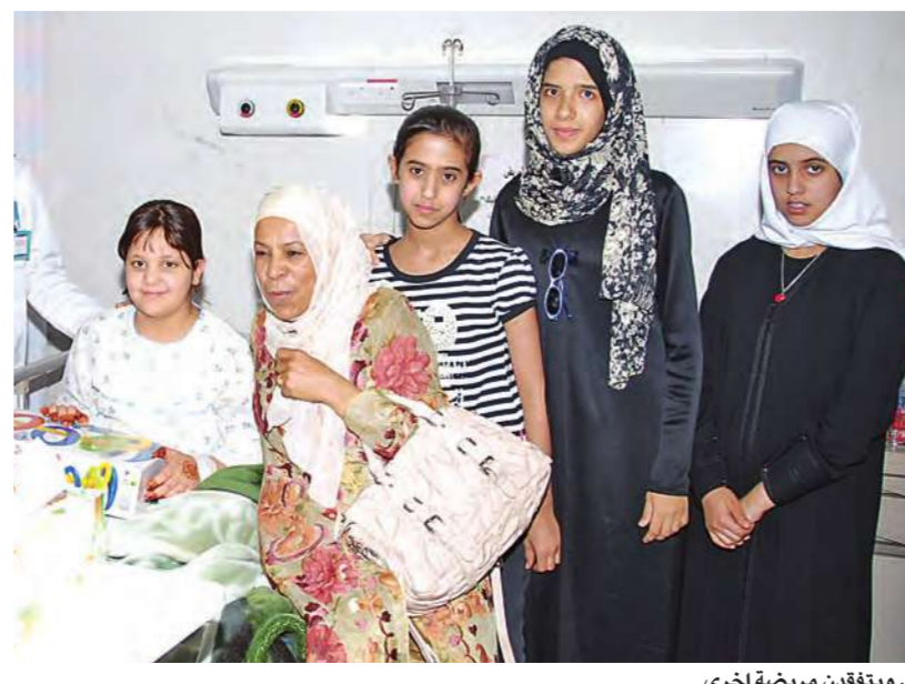
... ويتفقن مريضة أخرى

زارت مجموعة من عضوات مركز فتيات الجبراء التابع للهيئة العامة للشباب والرياضة، المرضى في مستشفى الجبراء، وذلك ضمن الأنشطة التي تقوم بها الفتيات خلال صيف 2007.