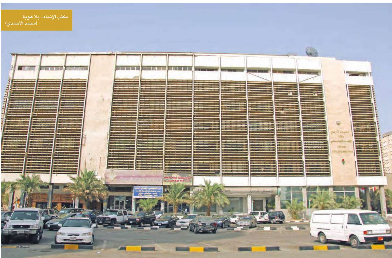
مكتب الإنماء... بلا هوية (محمد الأحمد)

ويتساءل هؤلاء الموظفون «إذا انتفت الحاجة إلى الخدمات الإرشادية والتوعوية التي يقوم بها المكتب فلماذا لا يطلب منهم الرحيل أو البحث عن بدائل مناسبة؟» وإن كانت مهمة المكتب قد انتهت بانتهاك الوظيفة المناط بها، فإن تساؤل هؤلاء الموظفين في محله ويحتاج إلى إجابة صريحة وواقعية من المسؤولين. وبالمنظر إلى مسيرة المكتب التاريخية فقد تمكن القائمون على إدارة المكتب خلال فترة الأربع عشرة سنة الماضية من إرساء قواعد العمل ونظمه على