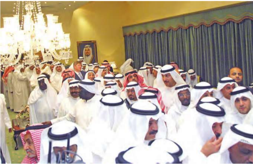
جموع من المهنئين