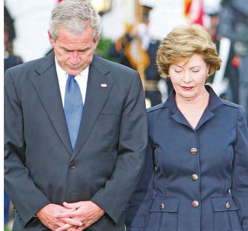
أحييت الولايات المتحدة أمس الذكرى السادسة لاعتداءات 11 سبتمبر 2001، التي ذهب ضحيتها نحو 3000 قتيل. وخلافاً للسنوات الماضية، كانت مراسم الذكرى محدودة هذه المرة، وسط تضاعف الجدل حيال الحرب على الإرهاب. وفي الصورة يقف الرئيس الأميركي جورج بوش وزوجته لورا دقيقة صمت حداداً على ضحايا الاعتداءات في حديقة البيت الأبيض أمس.