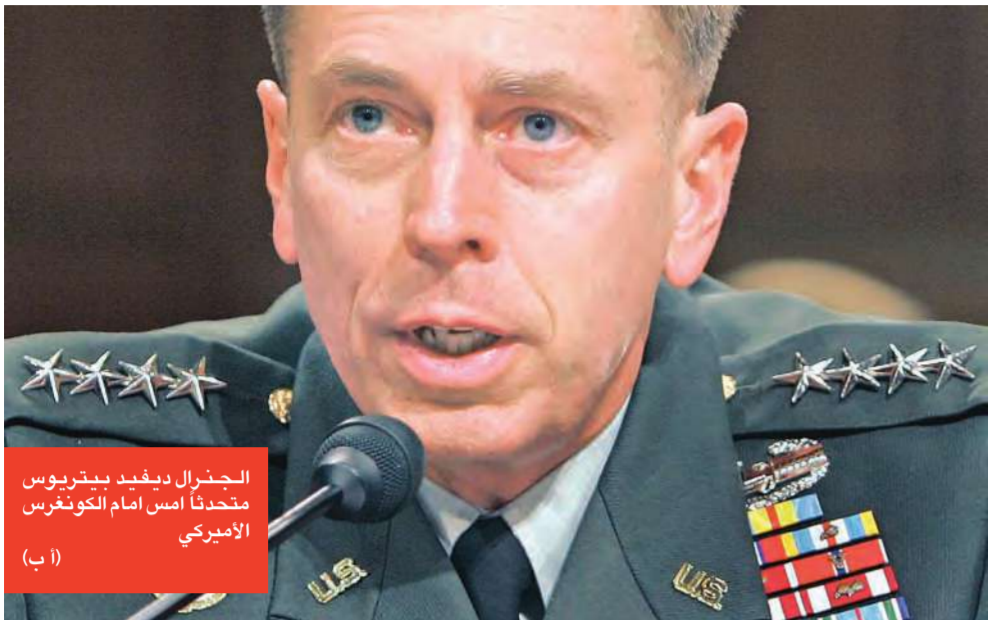
الجنرال ديفيد بيترىوس متحدثاً أمام الكونغرس الأميركي (أ ب)

كروكر: لا أضمن النجاح في العراق... والعلاقة مع سورية لا تزال تطرح مشاكل