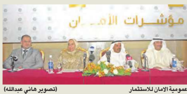
عمومية الأمان للاستثمار