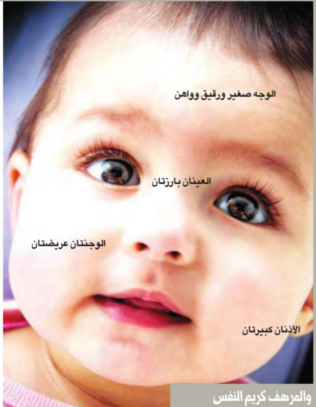
والرهف كريم النفس

المائدة. يحب أنواع الطعام كافة ويظهر شهية كبيرة. في المدرسة طفل متكيف جيداً مع المنهج الدراسي. يعتمد طرائق خاصة في تلقي التعليم ويبدى سريعاً استقلالاً لدى القيام بفرضه. بيد أنه يعمل ببطء لذا هو في حاجة إلى التركيز والاستمرار عميقاً في دروسه. سيكون موهوباً في المواد العلمية أكثر منها المواد الأدبية. مع الأصدقاء لديه الكثير من الأصدقاء ويحب ان يكون محاطاً بهم. إلا أنه يحتاج أيضاً إلى بعض الوحدة. علاوة على ذلك، إنه مندوب مثالي للمصطفى فضل حس المسؤولية لديه وقدرته على التنظيم. لا تحاولي ان تعامله كطفل صغير فهو في حاجة إلى من يتحدث إليه بصراحة ويضعه في موضع المسؤولية. مع ذلك، يحتاج إلى التخطيط لحياته. يجب إخباره مسبقاً بالأمور من أجل تهيئته لما يواجه.