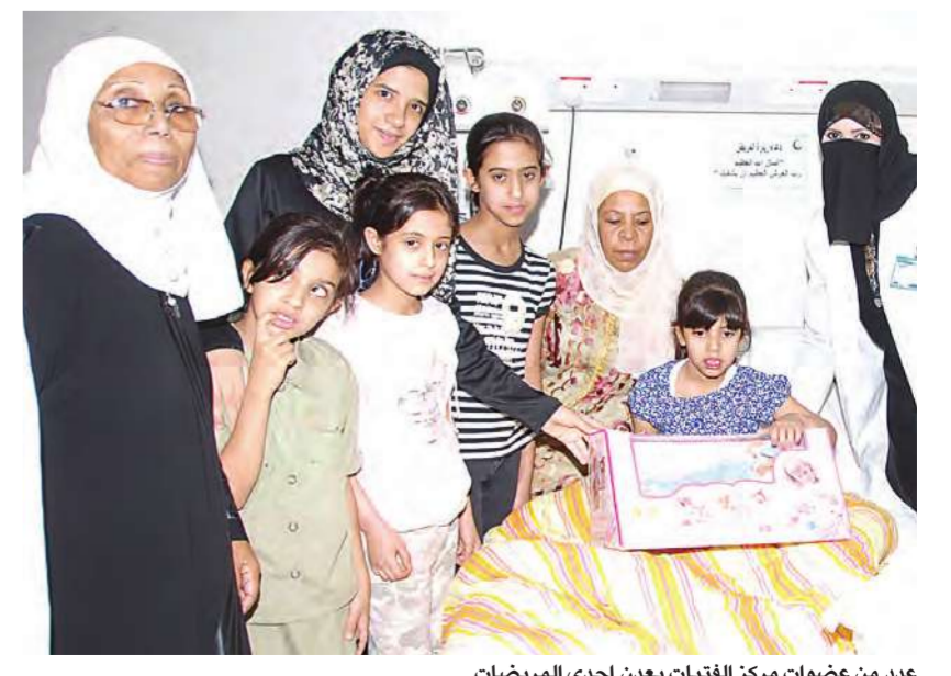
عدد من عضوات مركز الفتيات يعدن إحدى المريجات