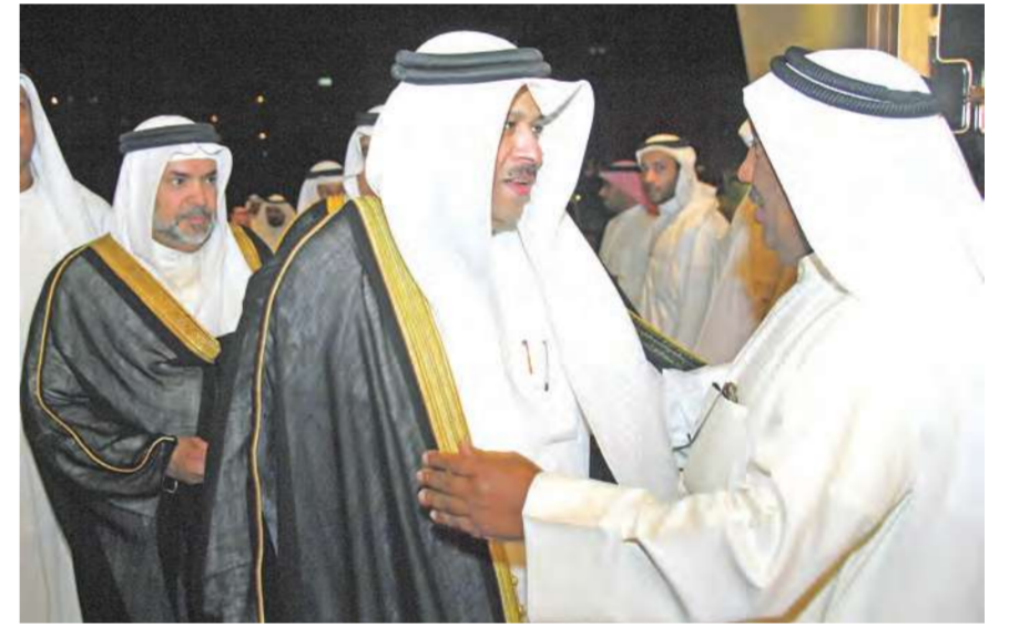
السفير القطري يهنئ