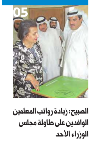
الصبيح: زيادة رواتب المعلمين الوافدين على طاولة مجلس الوزراء الأحد