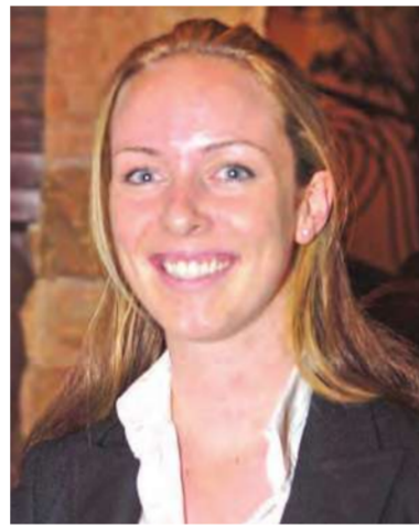
... ومشاركة أخرى