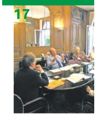
«أوبسيد»: فوضى قطاع الإسكان تتحدى الاقتصاد الأميركي