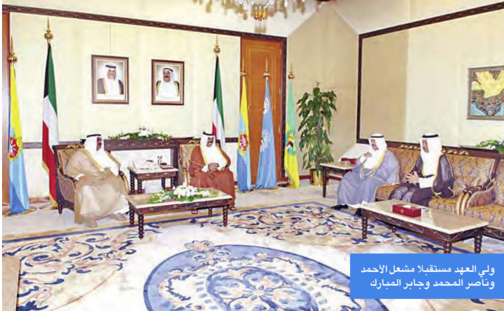
ولي العهد مستقبلاً مشعل الأحمد وناصر المحمد وجابر المبارك

سموه دشّن انطلاق مسابقة سالم العلي للمعلوماتية