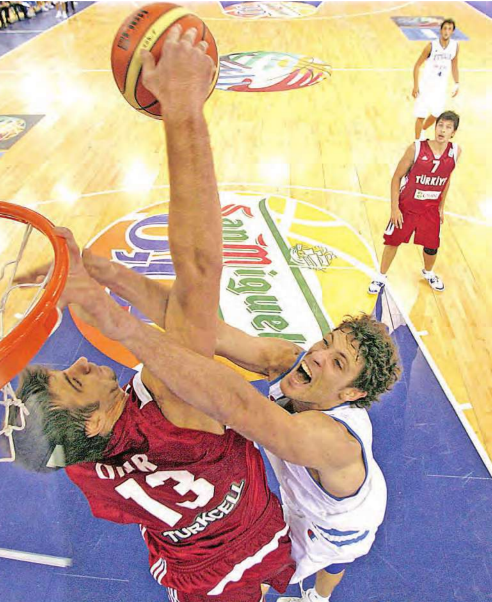
من مباراة تركيا وإيطاليا

وأضاف البدري أن المدير الفني جوزيه ححرص على الاجتماع مع جميع اللاعبين بعد اكتمال التشكيل، وحذره من التهاون في مباريات الدوري، وطالبهم بضرورة التعامل مع المباريات على أنها لقاءات كؤوس لا بد من حسنها في جولة واحدة، لأن الجهاز الفني يرغب في التعامل مع مباريات الدوري بهدوء، لاسيما أن البطولة طويلة وتحتاج إلى نفس طويل، وأن مباراة المقاولون بصفة خاصة صعبة ودائما ما تشهد مباريات الفريقين ندية وإثارة وحماسا من لاعبي الفريقين، وقد تعرف الجهاز الفني على أهم نقاط القوة والضعف بين صفوف لاعبي المقاولون لإعداد الخطة المناسبة لمواجهة.