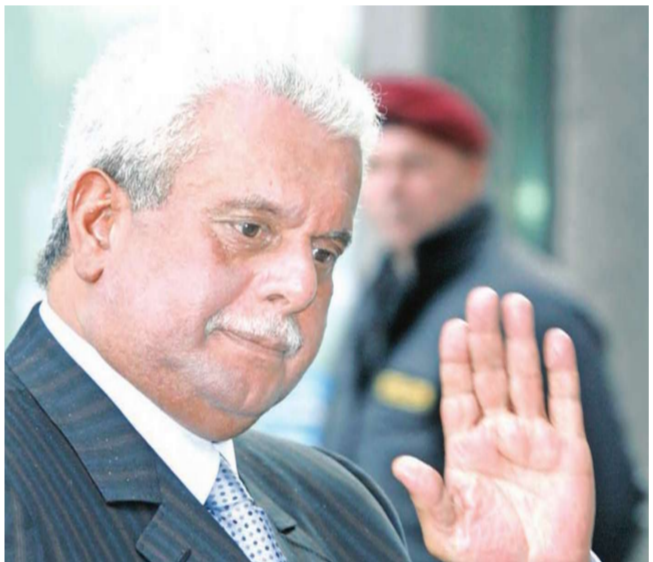
عبدالله بن حمد العطية

إذا ظهرت أي مؤشرات على نقص النفط الخام. وأشار أيضاً إلى أن الاضطرابات في الأسواق المالية قد تضر بالطلب على نفط «أوبك» من جانبه قال نوبو تاناكا المدير التنفيذي لوكالة الطاقة الدولية أمس الأول إن أسواق النفط تحتاج إلى مزيد من الإمدادات في الأشهر