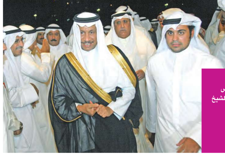
جابر المبارك لدى وصوله الى ديوان الشعب

المناسبة عودة النائب الأول لرئيس مجلس الوزراء وزير الداخلية و الدفاع الشيخ جابر المبارك من رحلة العلاج المكان ديوان الشعب