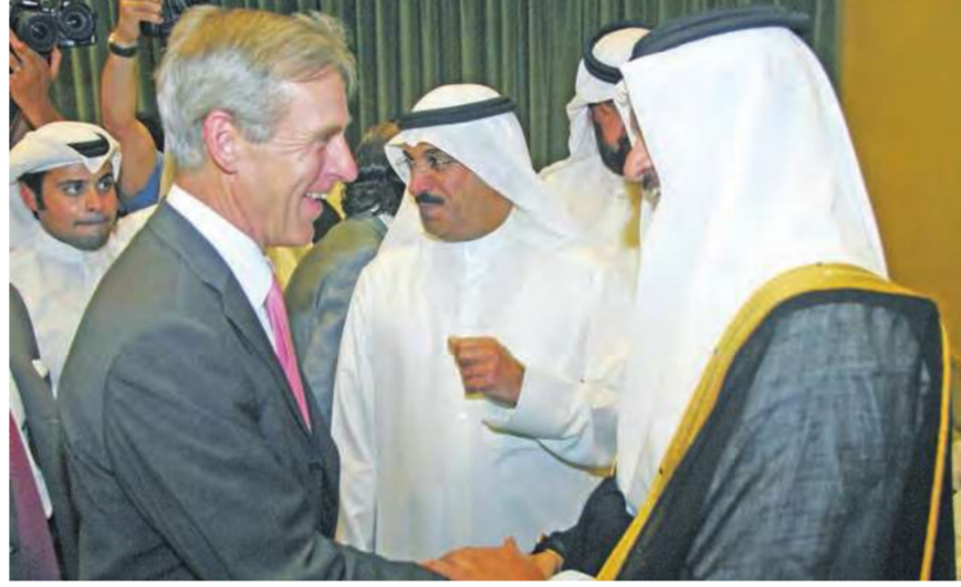
... والسفير البريطاني