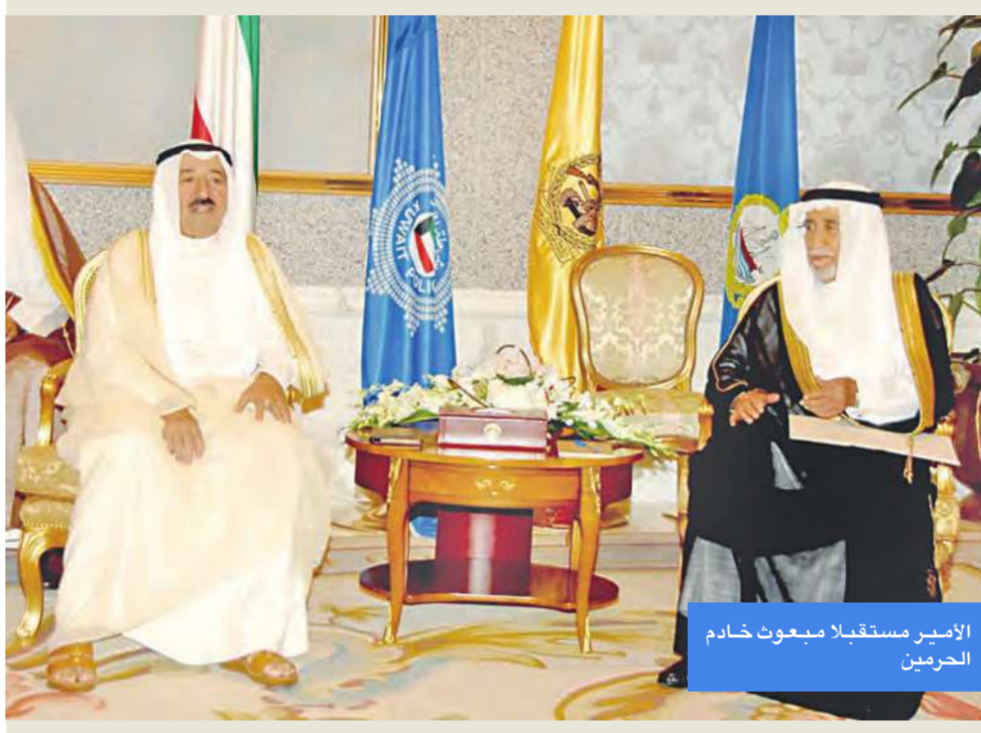
الأمير مستقبلاً ميعوث خادم الحرمين

استقبل سمو أمير البلاد في قصر بيان صباح أمس، ويحضر سمو ولي العهد الشيخ نواف الأحمد ونائب رئيس الحرس الوطني الشيخ مشعل الأحمد، ميعوث خادم الحرمين الشريفين الدكتور عبدالعزيز الخويطر وزير الدولة وعضو مجلس الوزراء بالملكة العربية السعودية الشقيقة، إذ سلم سموه رسالة خطية من أخيه خادم الحرمين الشريفين الملك عبدالله بن عبدالعزيز آل سعود ملك المملكة العربية السعودية الشقيقة، تتعلق بتعزيز العلاقات الأخوية الطيبة بين البلدين والشعبين الشقيقين وسبل توسعة أطر التعاون بينهما في المجالات كافة، كما تطرقت إلى مستجدات القضايا على الساحتين الإقليمية والدولية.