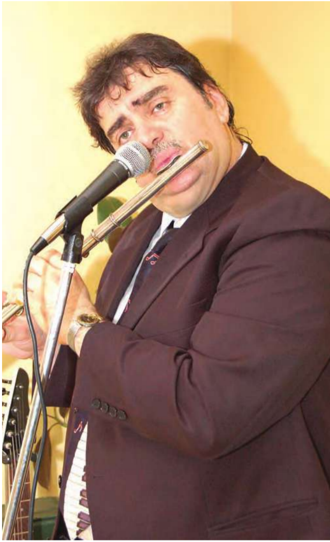
عازف على الناي