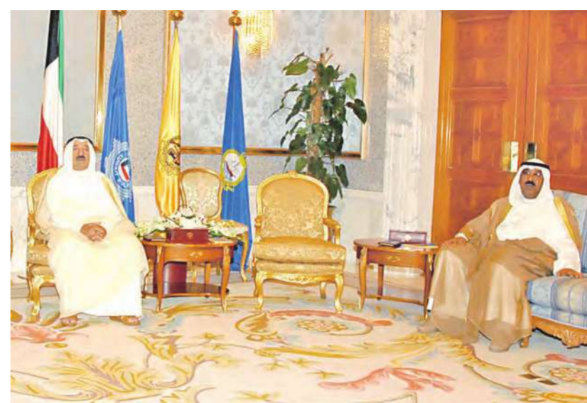
الأمير مستقبلاً مشعل الأحمد

رئيس مجلس الوزراء وزير الخارجية الشيخ الدكتور محمد الصباح، ووزير الشؤون الاجتماعية والعمل الشيخ صباح الخالد، ورئيس جهاز الأمن الوطني الشيخ أحمد الفهد.