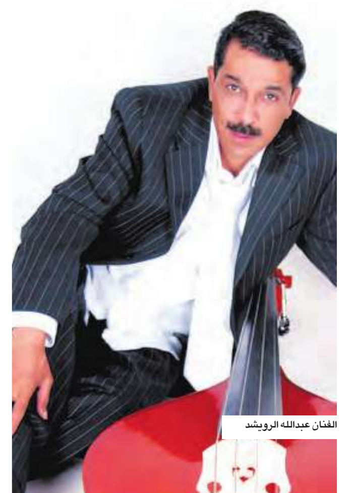
الفنان عبدالله الرويشد

غالباً ما نتعرض لحوادث مفاجئة وغير متوقعة نسميها «مصادفات» تغير مجرى حياتنا وتضعنا أمام حادثة مدهشة لا نستطيع تفسيرها. بعض المصادفات جميل وطريف، وبعضها الآخر صادم ومزعج. كذلك هي حياة النجوم مصادفات غريبة ومدهشة كسائر الناس، فما هي أغرب تلك المصادفات؟