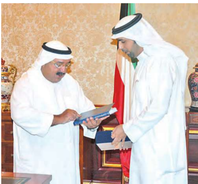
وزير الديوان مستقبلاً راشد المري

استقبل وزير شؤون الديوان الاميري الشيخ ناصر صباح الأحمد بقصر بيان صباح الحماسي حمود الهاجري، كما استقبل ناصر عبدالمحسن المري والدكتور راشد محمد المري، حيث أهدى له رسالة دكتوراه حملت عنوان «البحث الاجنبي وتهديدهاته للامن القومي - دراسة ميدانية على ضوء الغرس الثقافي»، واستقبل الدكتور أحمد عبيد الرشيد، حيث اهداه رسالة دكتوراه حملت عنوان «العلاقة بين المدخلات التعليمية وجودة الخريجين من كلية التربية الاساسية في دولة الكويت».