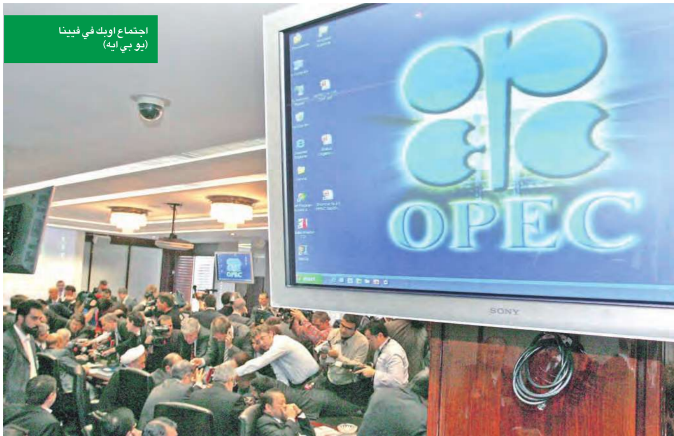
اجتماع أوبك في فيينا

مستوى الانتاج الحالي كنقطة بداية. وظهرت بيانات «رويترز» أن انتاج دول «أوبك» العشر التي يسري عليها نظام الحصص يزيد نحو مليون برميل يوميا على سقف الانتاج المستهدف البالغ 25.8 مليون برميل في اليوم. وقالت مصادر «رويترز» إن المملكة العربية السعودية ودولا خليجية أخرى تفضل زيادة الانتاج بما بين 500 ألف برميل ومليون برميل يوميا.