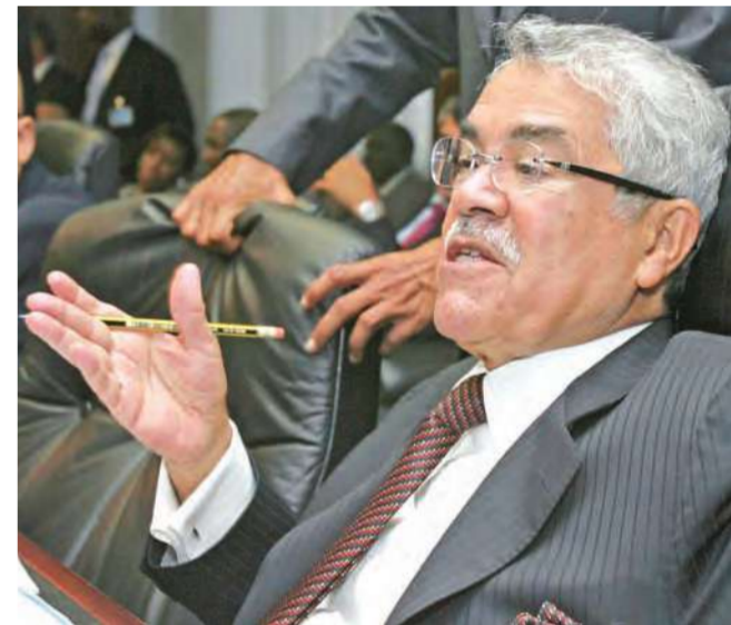
علي النعمي