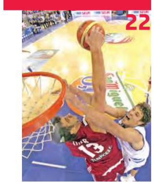
خسارة تركيا اهلت فرنسا إلى ربع نهائي بطولة أوروبا