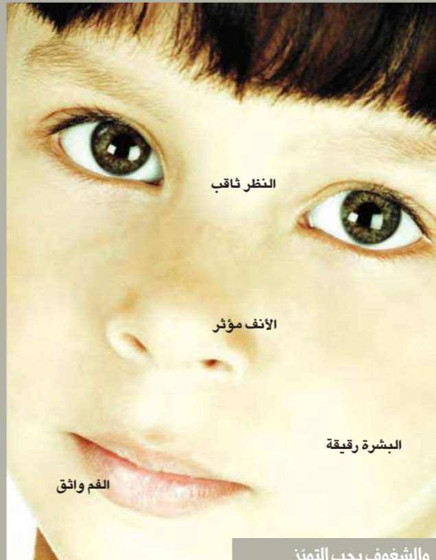
والشغوف بحب التميز

لمحة عن شخصيته يحب التمييز عن الآخرين. أسوأ ما يمكن أن يحدث له هو تشبيهه بالآخرين. فهو يريد وضع بصمته الخاصة على هذا الكوكب وإن أمكن تسطير إنجازات. تجدين صعوبة في فرض خياراتك عليه فهو يدرك جيداً ما يحب وما يريد. يستحيل إيقاف شعور الندم فيه. في المقابل، من السهل أن يجد طريقة فهو يظهر منذ صغره شغفاً بمجال أو باخر. عززي ثقته بنفسه فخيابه في محله. يتحذب أموراً كثيرة من نفسه ويضع هدفه الأعلى نصب عينيه. نومه لا ينام جيداً. حتى ليلاً تراوده مئات الأفكار. إن لم ينام جيداً يمكن أن يستيقظ في وقت متأخر. لكن في اليوم التالي يستيقظ من نومه عند الفجر. شهيته تختلف بحسب الأيام فيما