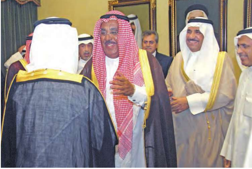
... ويتلقى التهنية من جابر الخالد وفاصل الخالد ومحمد الخليفة

تلقى النائب الأول لرئيس مجلس الوزراء وزير الداخلية وزير الدفاع الشيخ جابر المبارك الحمد الصباح في ديوان الشعب التهانني من شيوخ ووزراء ومسؤولين وسفراء معتمدين لدى البلاد وجمع غفير من المواطنين، وذلك لمناسبة عودته الى البلاد سالماً من رحلة العلاج في الخارج التي تكللت بالنجاح.