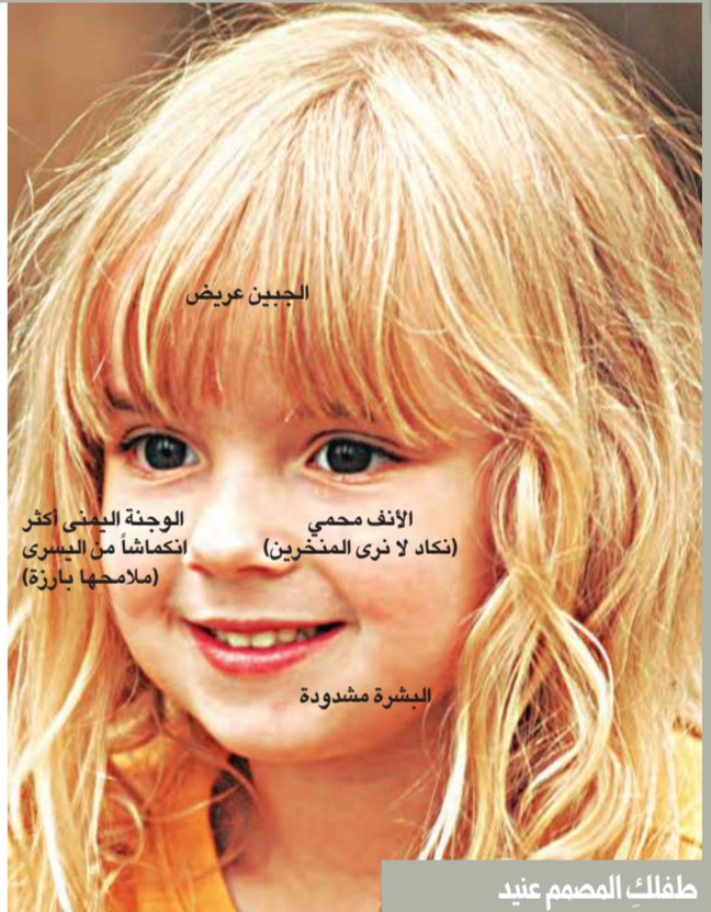
طفلك المصمم غنيد

لمحة عن شخصيته يدرك ما يفعله تماماً ولا تحرجه التفاصيل. ليس شديد الحساسية ولديه حس التنظيم بالفطرة. لا شيء يمنعه من تحقيق هدفه. تجدين صعوبة في استملائه محاولة اللعب على عواطفه. ليس من النوع الذي يلتصق الشفقة. في المقابل، من السهل إثارة اهتمامه في مشاريع حتى لو كانت تتطلب صبراً طويلاً فهو مثابر ويتمتع بطاقة كبيرة يستغلها إلى أقصى حد في المشاريع التي يخترط فيها. نومه لا ينام طويلاً بل يستيقظ باكراً ويهسر إلى ساعة متأخرة. لا تقلقي بشأن الاستيقاظ باكراً في الصباح فهو يعرف كيف يعثني بنفسه. لذا خذي النوم حتى وقت متأخر في الصباح. قلدي استيقاظه في الصباح الباكر يشار في تجميع ألعابه وإعادة توضيب غرفته. شهيته من الممتع الجلوس معه إلى