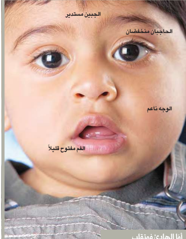
أما الهادئ فمفتلق

لمحة عن شخصيته يمكنه التكيف مع كل شيء. يتصرف بحسب الأجواء المحيطة به ويغوص فيها. فهو مصالح بالفطرة. فمثلما يقدر على استيعاب جميع الآراء، يحب المصالحة بين الناس. تجدين صعوبة في تحفيزه فهو يفتقر إلى بعض «المحركات الداخلية، لأنه يتأثر بالعوامل الخارجية. لذا ينبغي دفعه قدماً وتحفيزه وتشجيعه. اقترحي عليه نشاطات حسية وساعديه على اكتساب بعض القوة الجسدية عبر تسجيله في ناد للجودو أو للرياضة الجماعية. في المقابل، من السهل شغله. فهو طفل يعرف كيف يستمتع بوقته منفرداً من دون أن يكون لجوجاً. إذا تركته في مكان معين لا يجارحه إذ يشعر بالراحة أينما كان. كما لا يمانع بقمضية العطلة لدى جديه أو تمضية السهرة لدى صديقه أو تمضية يوم في الجبل أو على الشاطئ. نومه يخلد باكراً إلى النوم ويستيقظ في وقت متأخر. يحب النوم كثيراً.