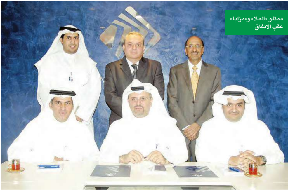
ممثلو «العلاء» و«مزايا» عقب الاتفاق

ولفت إلى صعيد متصل إلى عمل الشركة على الإعداد لافتتاح تجريبي لمركز الجبراء الذي وصفه بأنه الأول من نوعه في المنطقة بتجهيزات عالمية، مشيراً إلى أن التكلفة الحالية للمركز بلغت حتى هذا الوقت نحو 1,5 مليون دينار كويتي.