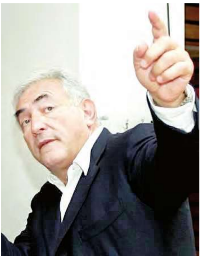
دومينيك ستراوس كان