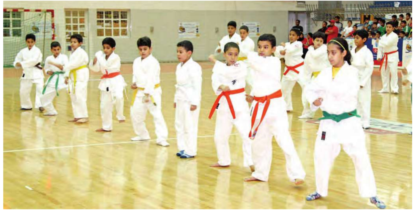
عرض من البراعم لقتال الكاراتيه