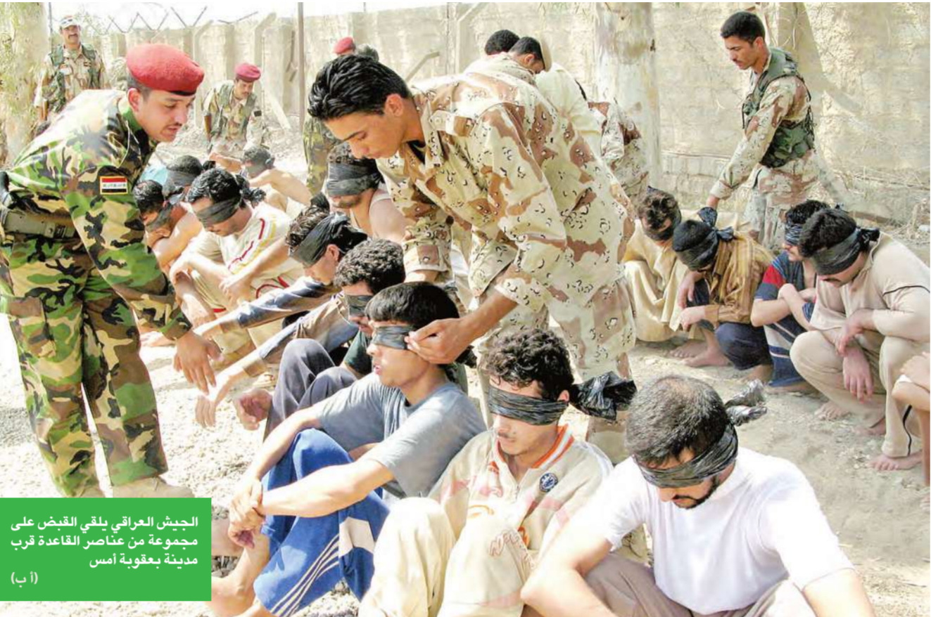
الجيش العراقي يلقى القبض على مجموعة من عناصر القاعدة قرب مدينة بعقوبة أمس