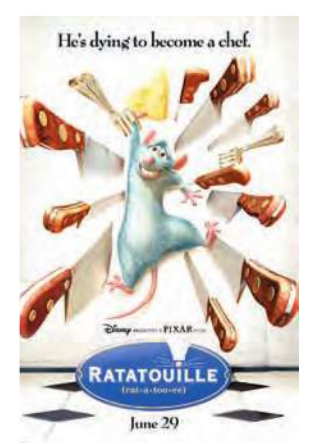
He's dying to become a chef.

يعرف حدوداً. هذا جلي في الفيلم، تحديداً في نصفه الثاني، مع مشهد مطاردة يأخذنا إلى شوارع باريس والمراكب العائمة على نهر السين. مشهد رائع إلى حد أنه يستحيل التصديق أنه عمل كمبيوتر. ما يجعل الفيلم مرشحاً بقوة لجائزة أوسكار أفضل فيلم كارتوني لعام 2007. نجح المخرج بيرد في جعل كلمة