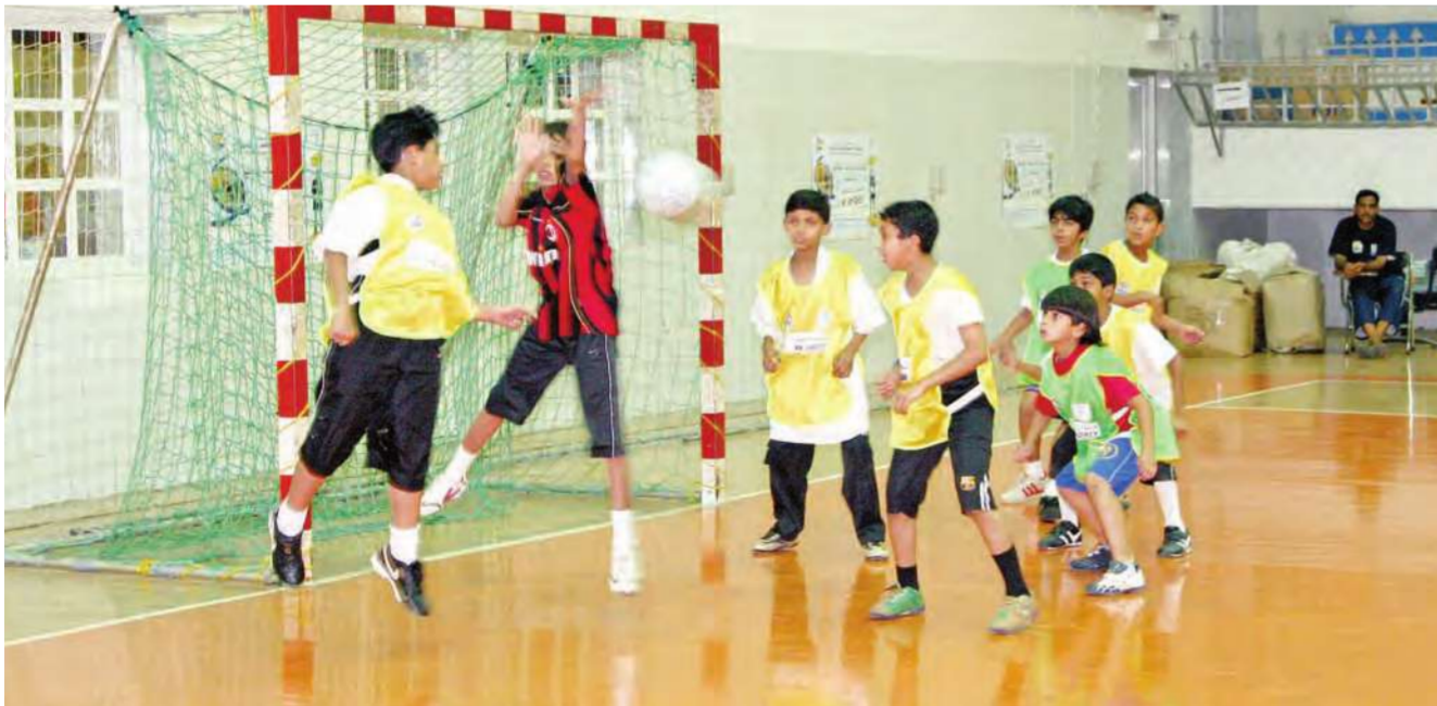
لقطة من المباراة النهائية