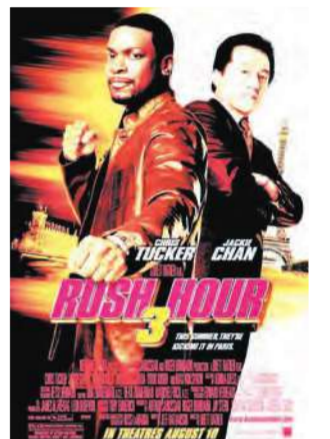
الممثل كريس تاكر في ورطة

لا يشبه Rush Hour 3 الجزءين السابقين للسلسلة وكان نموذجاً للأفلام الحركة. كل منهما كان يحتوي على لحظات مميزة فالجزء الأول تميز بالكوميديا والثاني بمشاهد القتال الصورية في إتقان، أما الجزء الثالث أي الجديد فمزيج مما شاهدناه سابقاً.