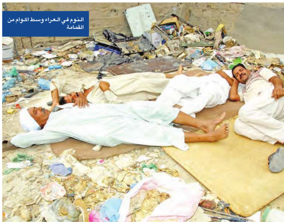
النوم في العراء وسط أكوام من القمامة

اثناء جولتنا في خيطان شاهدنا السنة الدخان تتصاعد من أحد المنازل، وعند اقترابنا من المكان وجدنا رجال الإطفاء الذين أكدوا لنا أن هذا الأمر يتكرر يوميا، حيث يبلغون عن حريق في المنطقة وعند وصولهم يتبين أنه عمل تخريبي فقط، بمعنى يتم تجميع النفايات والمخلفات وحرقتها دون وجود لأي شخص في المنزل.