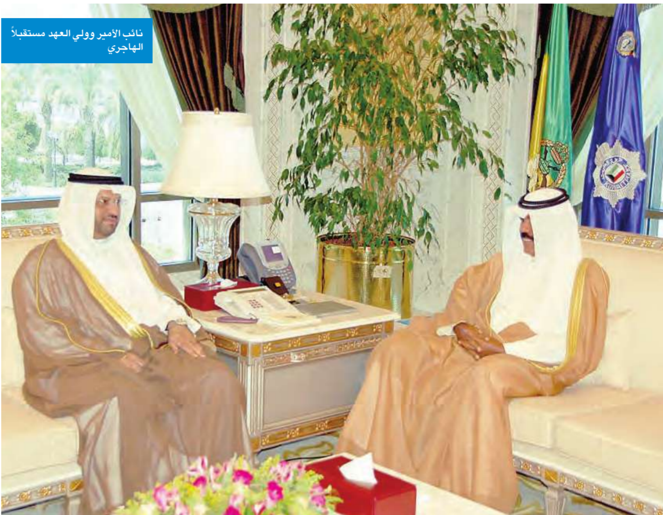
نائب الأمير وولي العهد مستقبلاً الهاجري

استقبل سمو نائب الأمير وولي العهد صباح في ديوانه بقصر السيف صباح أمس، وزير التجارة والصناعة فلاح الهاجري، وذلك بمناسبة عودته إلى البلاد بعد رحلة علاج واستشفاء في ألمانيا إثر الوعكة الصحية التي ألمت به أخيراً. وقد تمنى سموه للوزير دوام الصحة وتتمام العافية لمواصلة مشواره مع اخوانه الوزراء في خدمة الوطن والمواطنين. واستقبل سمو نائب الأمير وولي العهد بقصر السيف، سفير دولة الكويت لدى مملكة البحرين الشيخ عزام المبارك الصباح، واستقبل سموه بقصر السيف، سفير دولة الكويت لدى اليابان السفير عبدالرحمن العتيبي، كما استقبل سمو نائب الأمير وولي العهد عدداً من المواطنين.