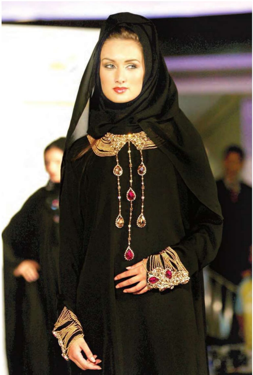
عارضة ترتدي زياً خلال عرض هنادي للأزياء لـ«الشفال والعباية» في دبي أمس

قررت صناعة أفلام وثائقية بريطانية الاستغناء عن الصابون وعن حمامها اليومي وعن كل وسائل النظافة الأخرى، مدة 6 أسابيع، لترى ماذا يمكن أن يحصل لجسدها. وذكرت صحيفة «دايلي مايل» البريطانية أن نيكي تايلور رمت في القمامة بكيسين مليئين بمستحضرات للنظافة والتجميل، وقررت التوقف عن أخذ حمامها الصباحي بعد التمارين