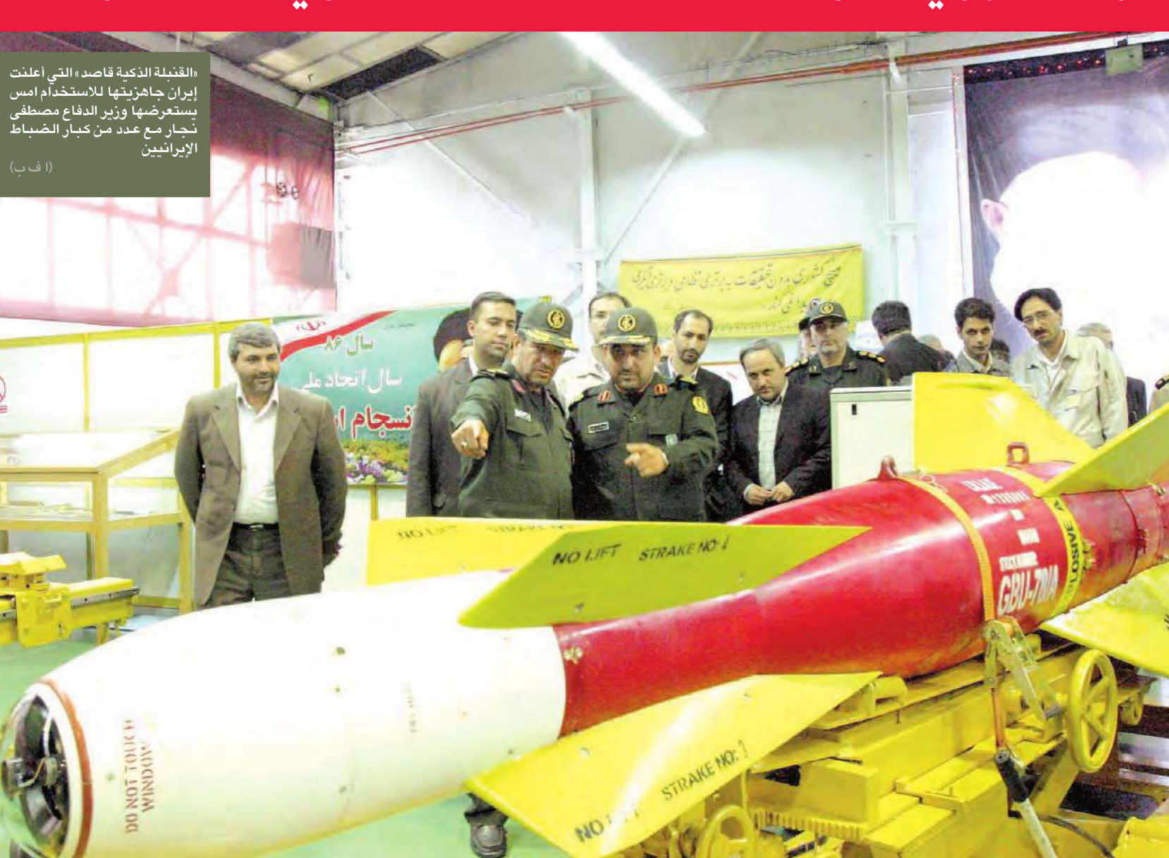
«القنبلية الذكوية قاصد» التي أعلنت إيران جاهزيتها للاستخدام أمس يستعرضها وزير الدفاع مصطفى نجار مع عدد من كبار الضباط الإيرانيين

علمت «الجريدة» من مصادر دبلوماسية أن الضغط الأمريكي المتنامي للربط بين الحرس الثوري الإيراني ومنظمات تضعها واشنطن على لائحة الإرهاب كـ «حزب الله» و«طالبان» متعدد الأهداف. أولاً: في ما يتعلق باجتماع الأمم المتحدة الشهر المقبل بشأن الملف النووي الإيراني، تسعى الولايات المتحدة إلى إقحام الحلفاء الأوروبيين، بالإضافة إلى روسيا والصين أن الضغط داخل الإدارة الأميركية والكونغرس من أجل القيام بعمل كبير ضد إيران أصبح كبيراً وأن أميركا تستعد للقيام بعمل