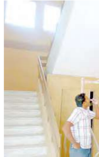
عدم الانتهاء من الصيانة سيسبب كثافة طلابية في المدارس

وقالت المصادر ان التربية اكتشفت وجود خلل في فحص المعلمين في بلدانهم، إذ ان نتائج الفحوصات الصادرة من بلدانهم تكون سليمة وعند إجراء الفحوصات في الكويت