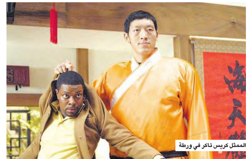
الممثل كريس تاكر في ورطة