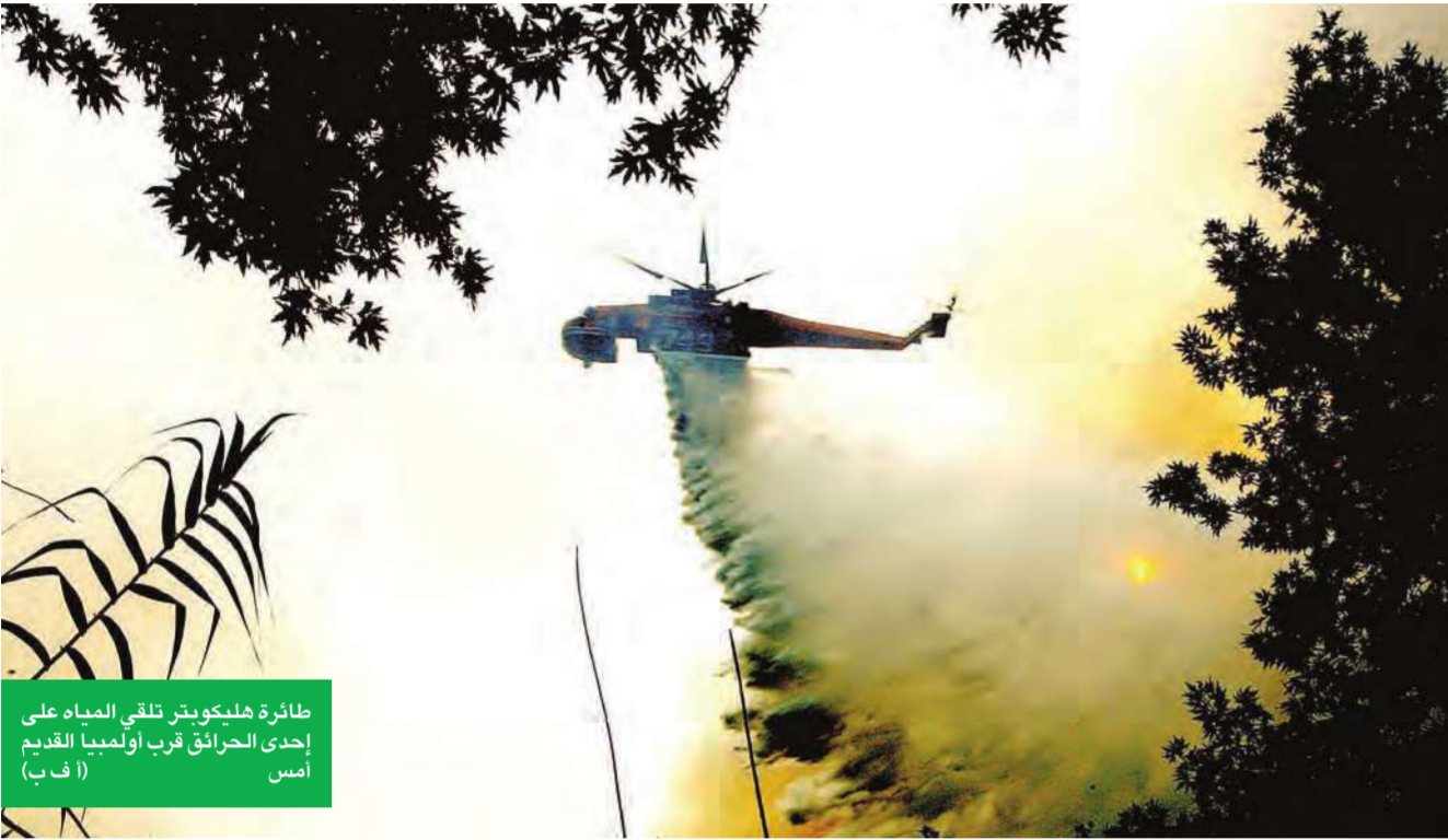
طائرة هليكوبتر تلقي المياه على إحدى الحرائق قرب أولمبيا القديم أمس (أ ف ب)

وكانت وصلت إلى اليونان أمس أربع طائرات إطفاء فرنسية وطائرتان من إيطاليا في إطار مساعدات للسيطرة على الحرائق. ومن ناحية أخرى وصل نحو 60 من رجال الإطفاء من فرنسا وقبرص إلى مناطق الحرائق وتوقع اليونان خلال اليومين المقبلين وصول أربع طائرات إطفاء من صربيا وطائرتين من إسبانيا وثلاث مروحيات من ألمانيا ومثلها من هولندا ومروحية واحدة من كل من إسرائيل ورومانيا والترويج وسلوفينيا.