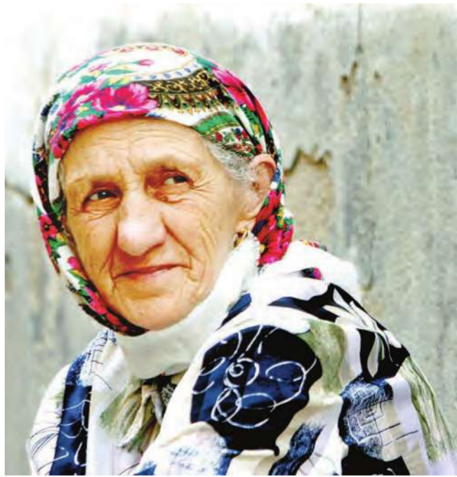
يوسنية تشارك في احتفال على الحدود بين كوسوفو ومقدونيا الشهر الماضي

على التوالي وفدين من الصرب والكوسوفيين لن يجتمعا نظراً لتطاعتهما المتناقضة. ورغم ذلك ترقى الترويكيا أن على الطرفين الإسماسيين أن يقدموا مقترحات بما أنها لن تفعل ذلك إذ أن دورها يقتصر على الموافقة على أي حل وسط يتوصل إليه الكوسوفيون والصرب معها كان. لكن منذ أن بدأت هذه اللجنة الدبلوماسية تحركها منتصف الشهر الجاري في مهمة تستغرق 120 يوماً، لم يصدر أي اقتراح مما يعزز الشكوك في النتائج التي يفترض أن تقدمها في تقرير في وقت رفضها القادة الكوسوفيون لأنها تفقد جزءاً من الأراضي التي يطالبون باستقلالها، في حين لم يعرها القادة الصرب اهتماماً لأن قبولها يعني الموافقة على استقلال القسم الألباني من كوسوفو. واستعصى الحل إلى درجة أن الولايات المتحدة وأكبر الدول الأوروبية ترى أنه في غياب التسوية مقبولة من قبل بلغراد وبرستينا، ستعين العودة إلى خطة وسيط الأمم المتحدة مارتي اهتيساري التي توصي باستقلال كوسوفو تحت مراقبة دولية. ولم تتم المصادقة على تلك الخطة، التي كان يفترض أن يتخذ مجلس الأمن الدولي قراراً بشأنها، بسبب معارضة روسيا الحليفة التقليدية للصرب. وإذا لم يتم التوصل إلى أي حل فإن الكوسوفيين المدعومين من واشنطن وأكبر الدول الأوروبية، قد يعلنون استقلالهم، وهو حل يمكن أن يثير اضطرابات (بلغراد - أ ف ب)