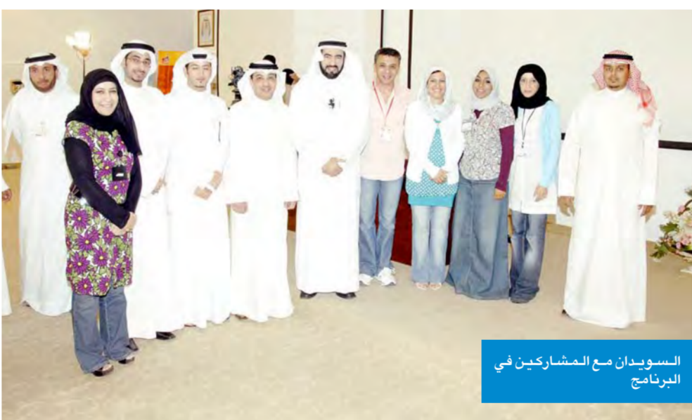
السويديون مع المشاركين في البرنامج

نظمت وزارة الدفاع يوم الاثنين الموافق 2007/8/20 محاضرة لتدريسي برنامج اصنع مستقبلك بعنوان «النجاح في الحياة» للدكتور طارق السويدي وذلك ضمن جدول برنامج «اصنع مستقبلك». وسعى الدكتور السويدي خلال محاضراته إلى تحفيز المتدربين نحو استغلال إمكاناتهم لوفاء بالتزاماتهم وأدوارهم المختلفة في الحياة، كما قام بتحفيز المتدربين على التفكير في معنى النجاح والسعادة وتحقيق الذات، مركزاً على المسؤولية الفردية والقدرة الذاتية على التغيير. وأضاف الدكتور أمثلة واقعية تدعم المبادئ والأفكار النظرية التي تناولتها محاضراته، كما استشهد بآيات قرآنية وأحاديث نبوية تدعم المبادئ التي تشملها صيغته للنجاح في الحياة وهي