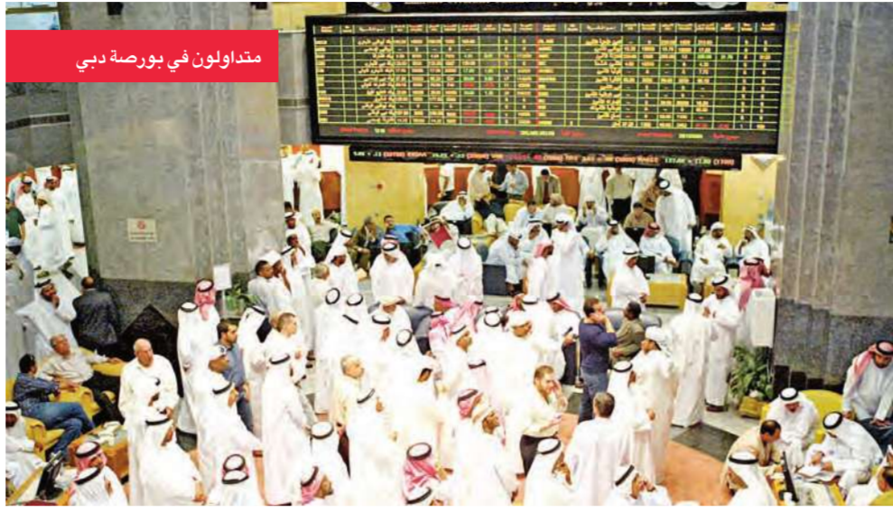
متداولون في بورصة دبي

تراجع السوق البحريني في اولى جلسات الأسبوع يوم أمس في ظل حالة عدم الاستقرار والتخبط التي يشهدها السوق في الأيام السابقة، يأتي بعد النهج التصاعدي الذي كان عليه السوق منذ ما يزيد على ثلاثة أشهر، وفي جلسة الأيسم يفقد السوق وسط قيم تداولات هزيلة بواقع 10,91 أو ما نسبته 0,43% ليستقر المؤشر العام عند مستوى 2527,94 نقطة، وقام المستثمرون بتناقل ملكية 1,6 مليون سهم بقيمة 389 ألف دينار بحريني، وعلى الصعيد القطاعي، ارتفع قطاع التأمين بواقع 49,36