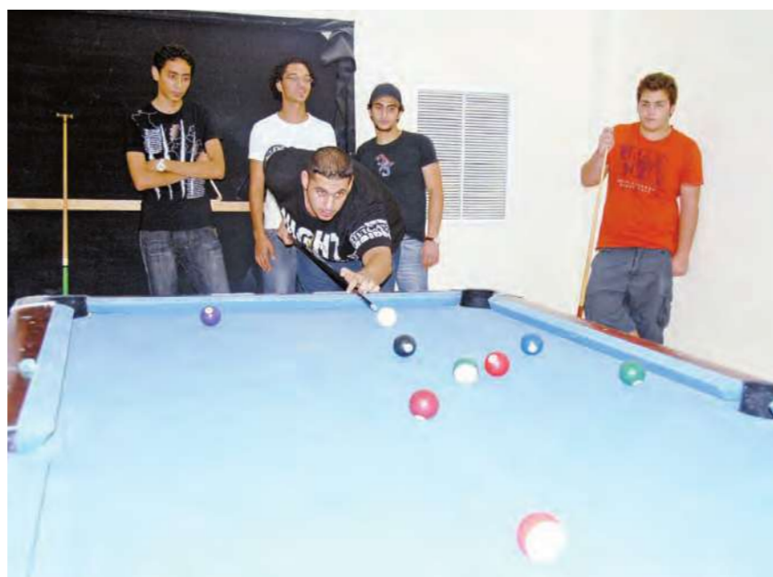
جانبا من مباراة البلياردو