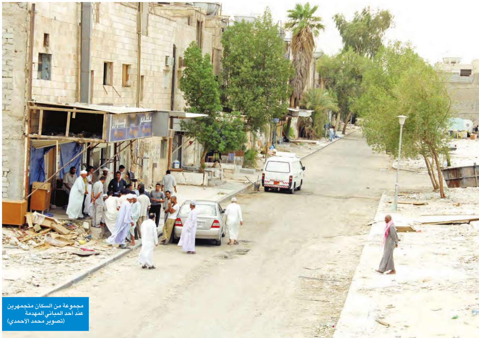
مجموعة من السكان متجمهرين عند أحد المباني المهتمة

6000 شخص يعيشون بلا كهرباء وماواهم السطوح والساحات المفتوحة