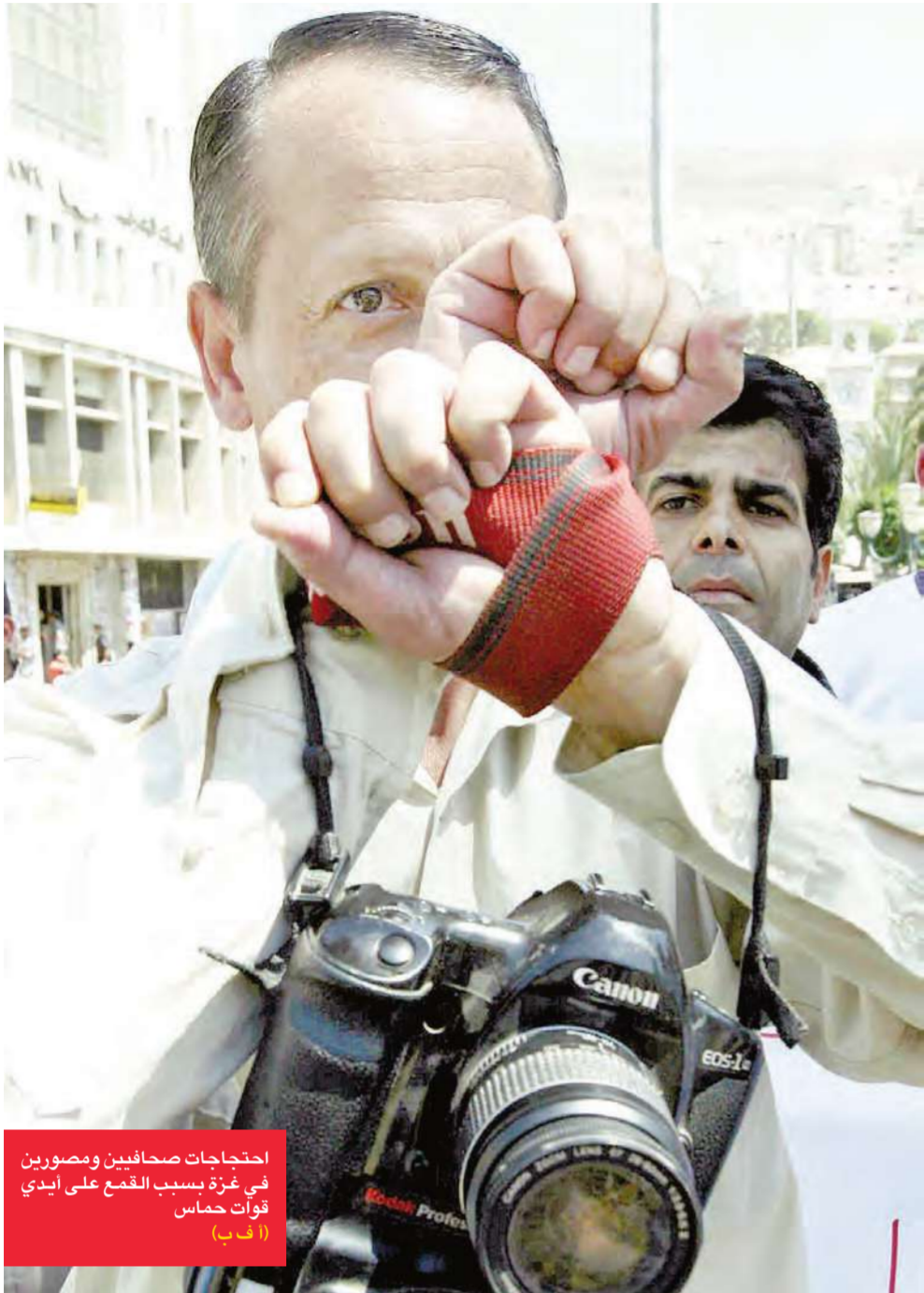
احتجاجات صحافيين ومصورين في غزة بسبب القمع على أيدي قوات حماس

السى ذلك نفذ سلاح الجو الإسرائيلي غارة على بلدة بيت حانون شمال قطاع غزة من دون الإبلاغ عن وقوع إصابات فيما قصف الذراع المسلح للجبهة الشعبية معبر إيرتز بصاروخين محليين. وقال سكان محليون إن طائرة إسرائيلية أطلقت صاروخاً باتجاه هدف محيط المدرسة الزراعية في بلدة بيت حانون شمال قطاع غزة، من دون الإبلاغ عن وقوع إصابات حتى الآن. وذكر السكان أن القصف كان يستهدف مجموعة من «رجال المقاومة» ومنصة لإطلاق الصواريخ تجاه البلدات الإسرائيلية. وأشار الأهالي إلى أن الطائرات الإسرائيلية فتحت نيران أسلحتها الرشاشة تجاه المنطقة. إلى ذلك أعلنت «كتائب الشهيد أبو علي مصطفى» الذراع المسلح للجبهة الشعبية عن قصف منطقة إيرتز بصاروخين من نوع «صمود» بعد ظهر أمس. وقالت في بيان لها إن القصف يأتي «مناسبة الذكرى السنوية السادسة لاستشهاده الأمين العام الرفيق القائد أبو علي مصطفى». وأضافت «تأتي هذه العملية إحياء