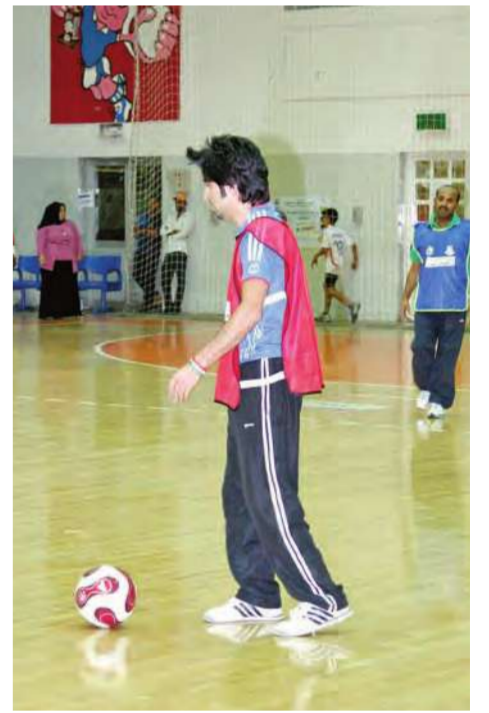
جانبا من المباراة