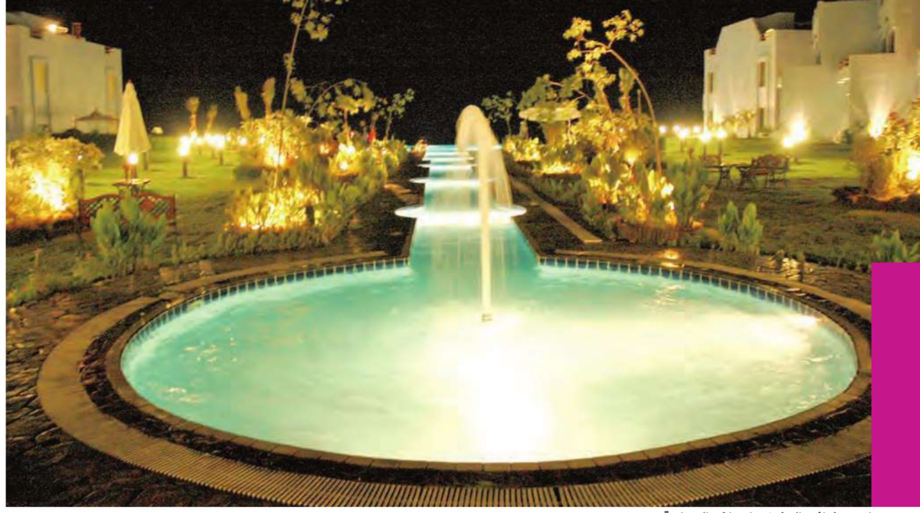
إحدى نوافير المنتزه واحواض السباحة