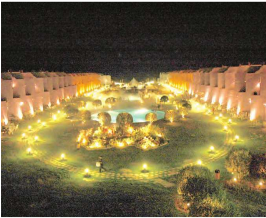
المنتزه كما بدأ ليلاً