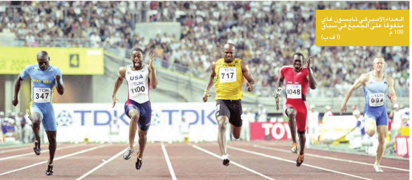
العداء الأمريكي تايسون غاي متفوقا على الجميع في سباق 100م