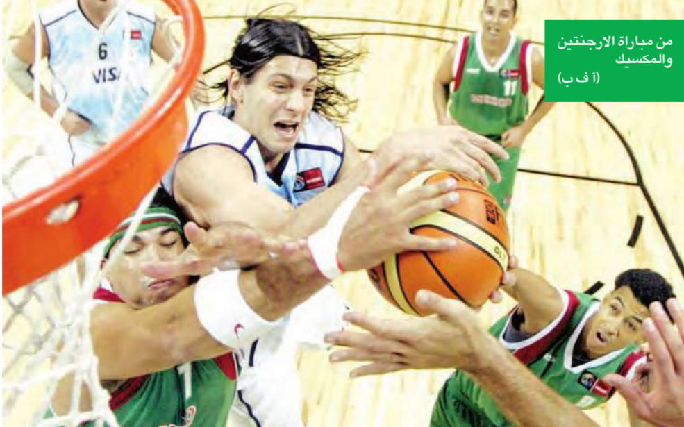
من مباراة الارجنتين والمكسيك

حسم الاميركي جيمس بلاك لقب دورة نيو هايفن لمصلحته، بعد فوزه على مواطنه ماردي فيش بمجموعتين نظيفتين، بينما كان لقب السيدات من نصيب الروسية سفتلانا كوزنتسوف.