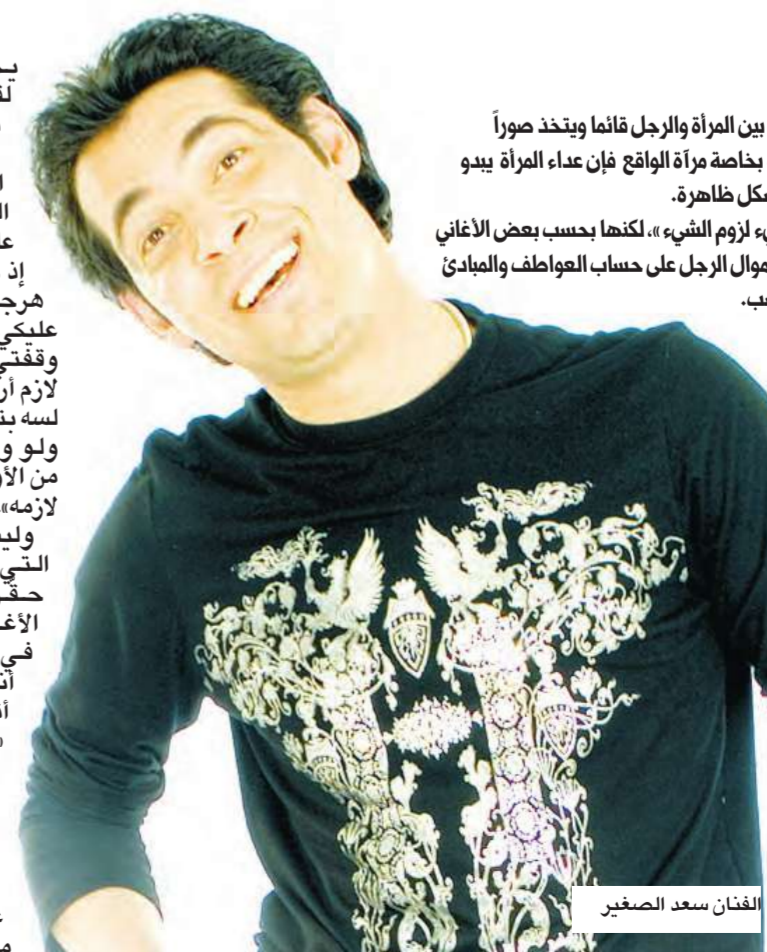
الفنان سعد الصغير

ليست المرأة «كاملة عدد» فحسب أو «شيء لزوم الشيء»، لكنها بحسب بعض الأغاني «شيطان رجيم»، لا يسعى سوى إلى جني أموال الرجل على حساب العواطف والمبادئ والأخلاق التي «أختص» بها الرجال فحسب.