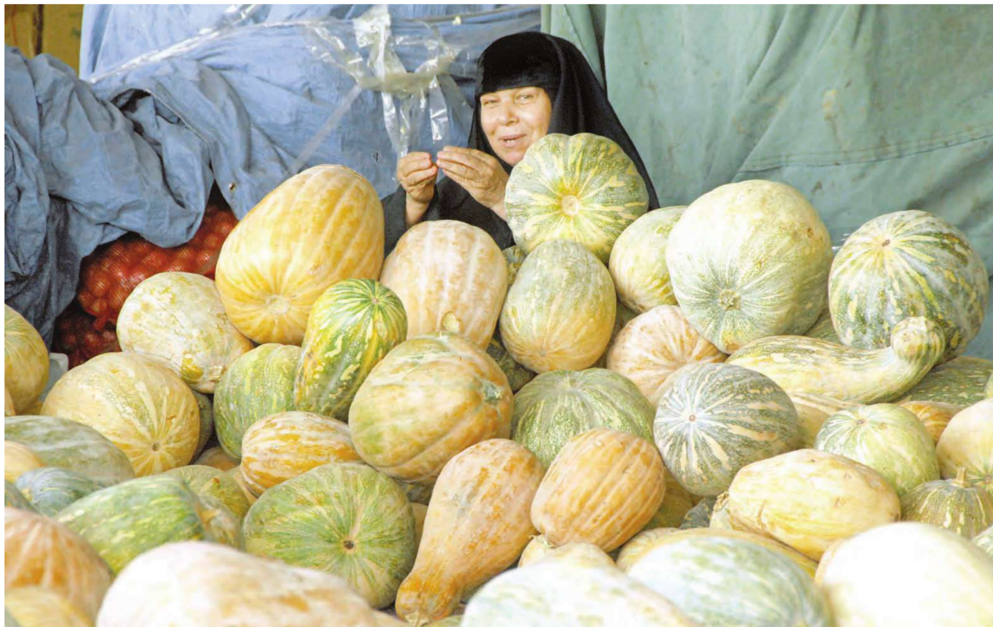
سيدة تباع «القرع» في سوق الخضار في الشويخ، في صورة لم تكن معهودة من قبل، وهو تأكيد جديد على قوة المرأة واستعدادها للعمل في أي مهنة لدعم أسرته.

بدأ مساء أمس الأحد وينتهي يوم الخميس القادم وسوف تكون مواعيد العمل بالملتقى في الفترة المسائية فقط حيث ينتهي في الساعة العاشرة مساء. ودعت الحربي الجمهور إلى المشاركة والاستفادة من هذا الملتقى، حيث إنه يوفر على الأخوات المشاركات عناء التسوق في مناطق تجارية بعيدة عن أماكن سكنهم، وقالت: حرصنا في اللجنة على أن يكون مكان السوق مناسباً، حيث سيكون في ضاحية صباح الناصر ما بين قطعة 3 و 4 وهو مكان متوسط لسكان المنطقة. ومن جهة أخرى قالت الحربي إن لجنة زكاة القرين تقيم محاضرة جماهيرية كل يوم اثنين في مسجد طلحة الأنصاري في منطقة العدان وموجهة إلى النساء، ودعت الحربي الأخوات إلى الاستفادة من هذه المحاضرات استعدادا لشهر رمضان. وفي الختام شكرت الحربي في هذا المقام جميع الأخوات المساهمات في مشاريع اللجنة.