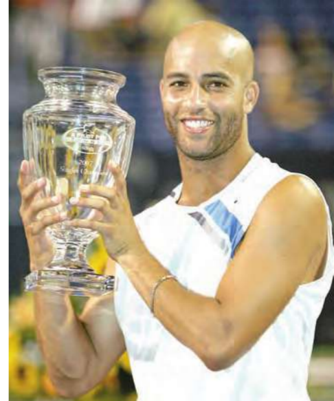
الاميركي جيمس بلاك