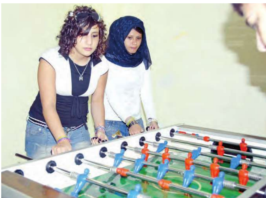
بطولة البيبي فوت للبنات