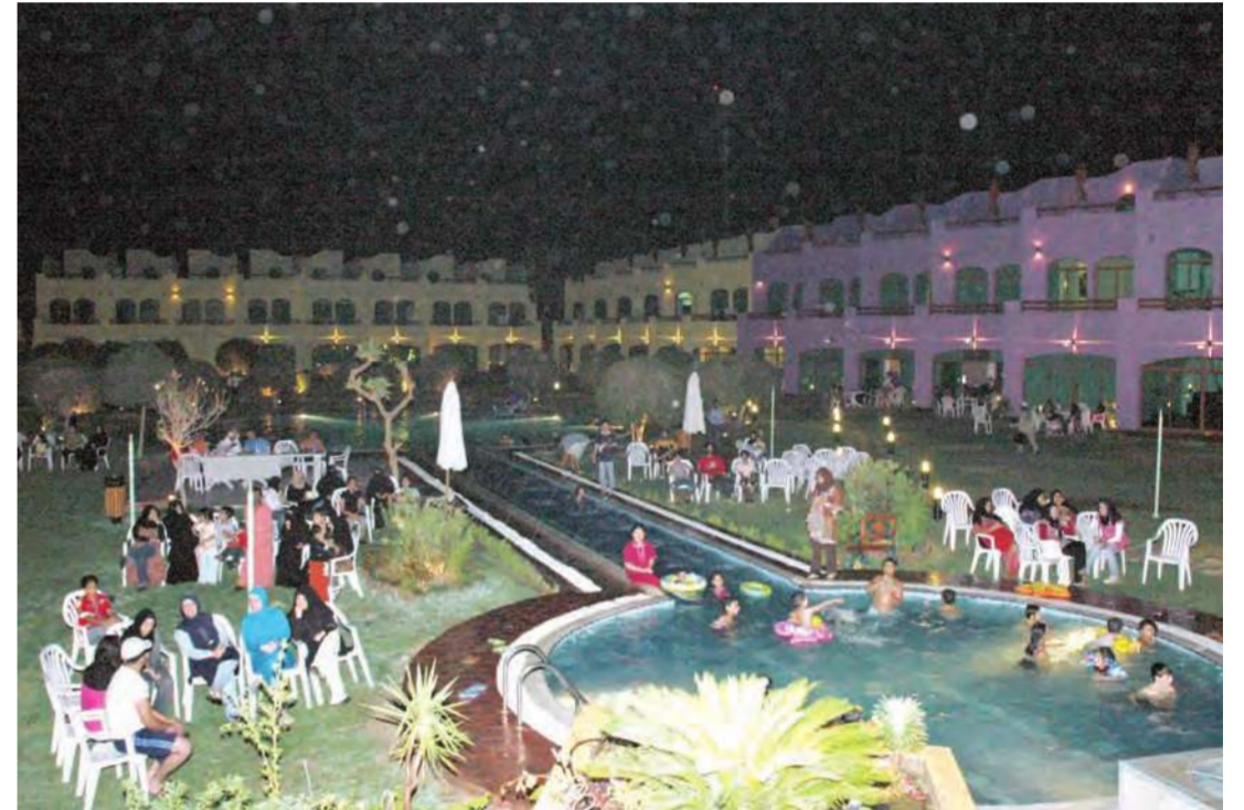
رواد وزوار المنتزه أثناء الحفل