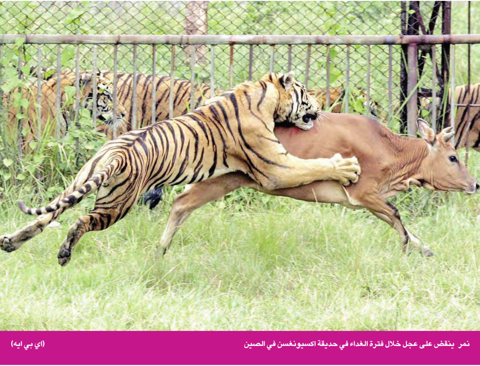
نمر ينقض على عجل خلال فترة الغداء في حديقة اكسيونغسن في الصين