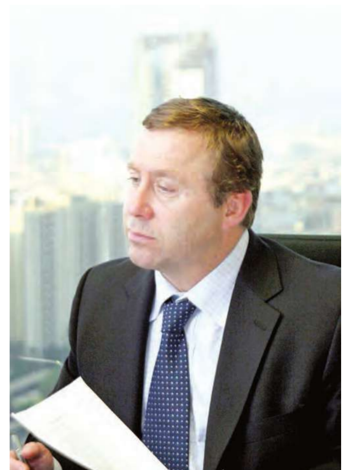
غاري كينغ الرئيس التنفيذي لبورصة دبي للطاقة

توقع رئيس بورصة دبي للطاقة، البورصة الرائدة في مجال السلع وقطاع الطاقة في الشرق الأوسط، أن عائدات النفط في المنطقة ستبقى قوية للمستقبل القريب. وسيقدم غاري كينغ، الرئيس التنفيذي لبورصة دبي للطاقة تحليلاً عاماً عن الطاقة في المنطقة، خلال مشاركته في الفعالية التي تقيمها مجموعة العمل البريطانية في دبي يوم الاثنين المقبل. ويقول كينغ في الخطاب الذي سبقيه في لقاء مجموعة المصالح الخاصة في مجموعة العمل البريطانية، الذي سيقام في نادي التجارة العالمي في دبي؛ نظراً للظروف الراهنة، أنا على يقين من أننا سوف نمر في مرحلة تتسم بثبات لأسعار الطاقة المرتفعة، وستستمر هذه الأسعار بالارتفاع مستقبلاً. أتوقع استمراراً للعائدات القوية للنفط في المنطقة، وسيكون هناك تدفق سيولة عالٍ في أسواقنا.