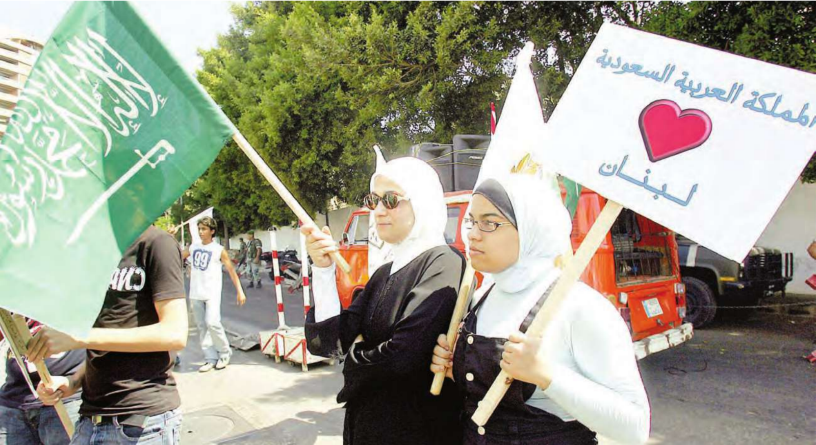
فتاة تحمل باقطة تعبر عن اواصر المحبة بين الشعبين اللبناني والسعودي في تظاهرة دعم السفير السعودي في بيروت

وانتقد وزير الدفاع الإسرائيلي وسائل الاعلام الصهيونية والأميركية التي «تصور القدرات الدفاعية الإيرانية على أنها تهديد لسائر الدول لاسيما دول المنطقة» وأضاف «ان هذه التجهيزات والأسلحة المتطورة التي تحتل مظهر الاكتفاء الذاتي والتصنيع