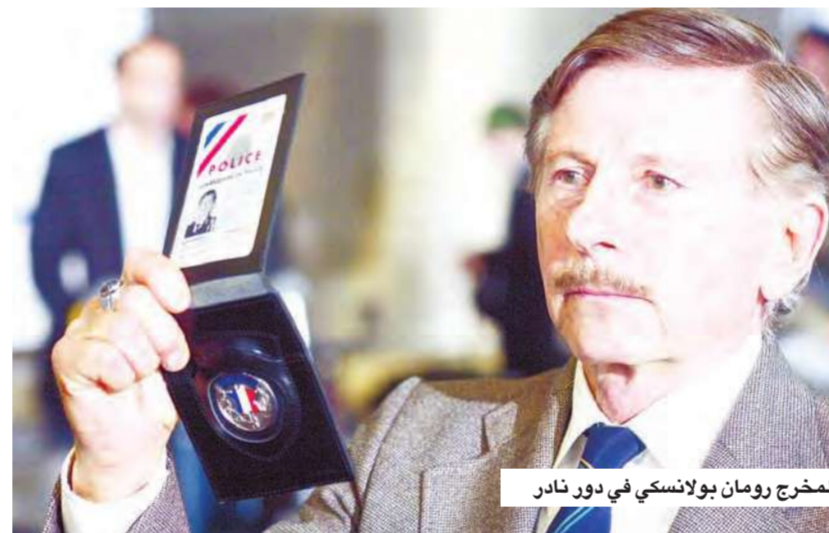
المخرج رومان بولانسكي في دور نادر