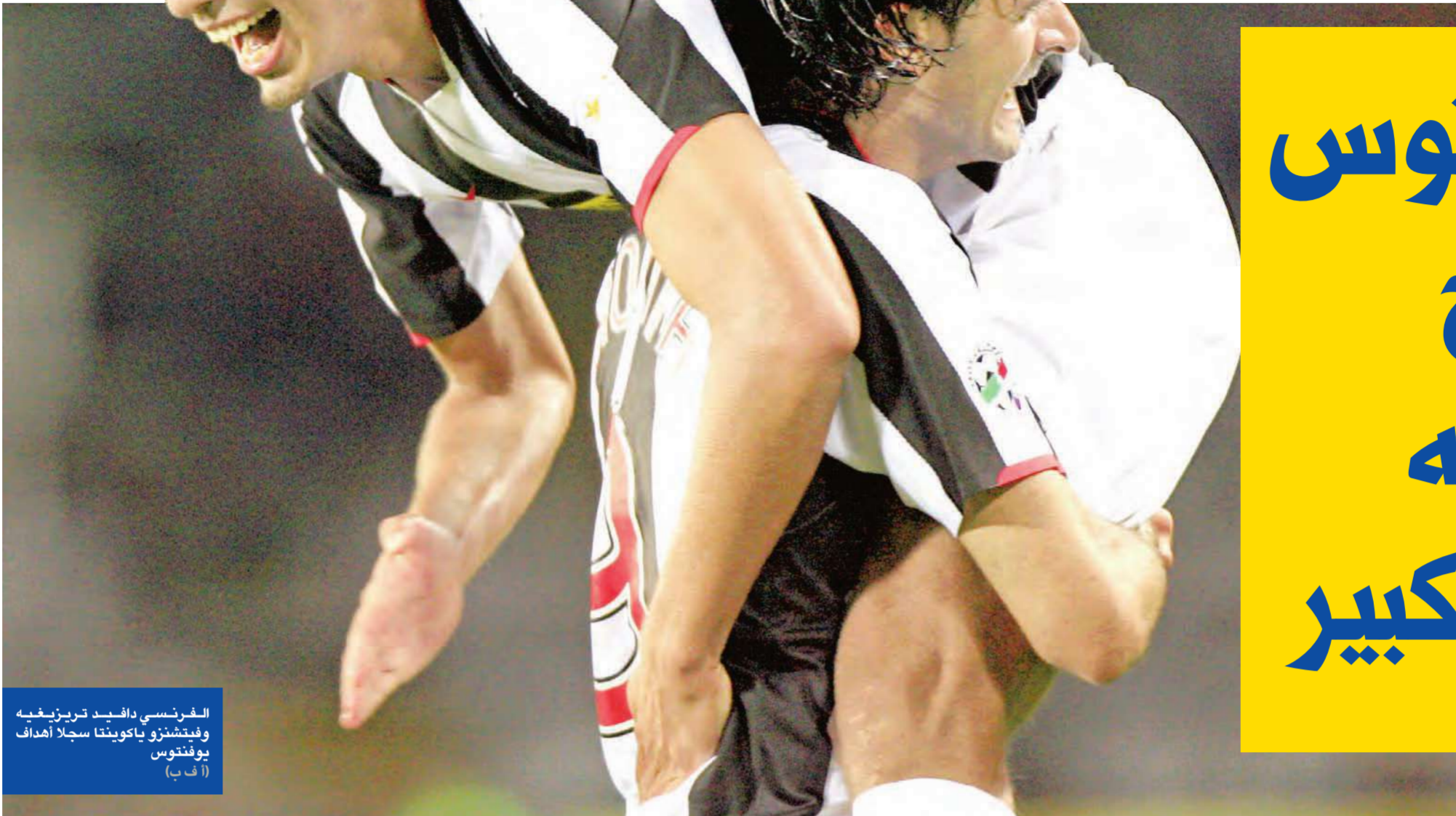
الفرنسي دافيد تريزيغيه وفينشنزو ياكوبيتا سجلا أهداف يوفنتوس

خامس الموسم الماضي، على ضيفه امبولي بثلاثة اهداف مقابل هدف.