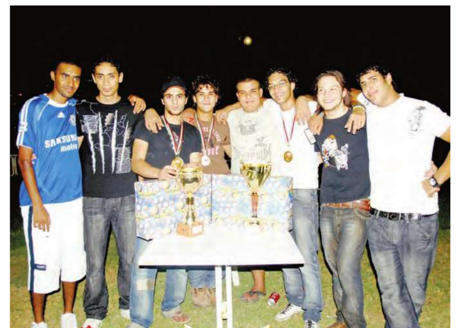
الابطال يحتفلون مع اصدقائهم في النادي