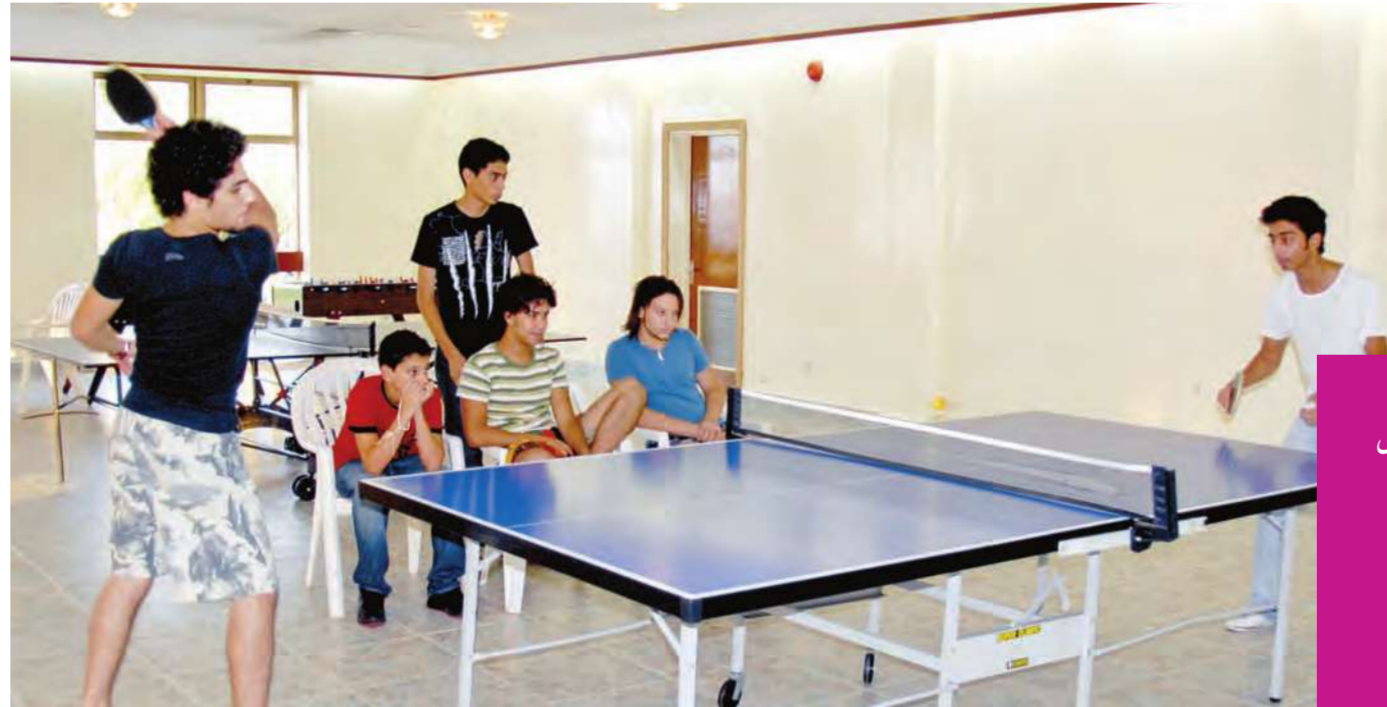
جانبا من بطولة كرة الطاولة