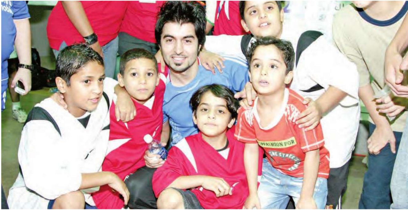
عدد من الاطفال المشاركين

المناسبة اختتام بطولة الصالات المغلقة المكان صالة الشهيد فهد الاحمد