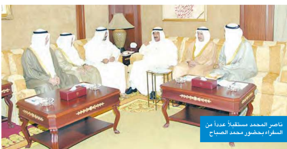
ناصر المحمد مستقبلاً عدداً من السفارة بحضور محمد الصباح

استقبل سمو رئيس مجلس الوزراء بقصر السيف أمس، بحضور نائب رئيس مجلس الوزراء وزير الخارجية ووزير الدولة لشؤون مجلس الوزراء بالإنيابة الشيخ الدكتور محمد الصباح كلاً من سفير دولة الكويت لدى الجمهورية الجزائرية الديمقراطية الشعبية الشقيقة سعود فيصل الدويش، وسفير دولة الكويت لدى جمهورية زيمبابوي علي إبراهيم النخيلان، وسفير دولة الكويت لدى مملكة البحرين الشقيقة الشيخ عزام مبارك الصباح، وسفير دولة الكويت لدى اليابان عبدالرحمن حمود العتيبي.