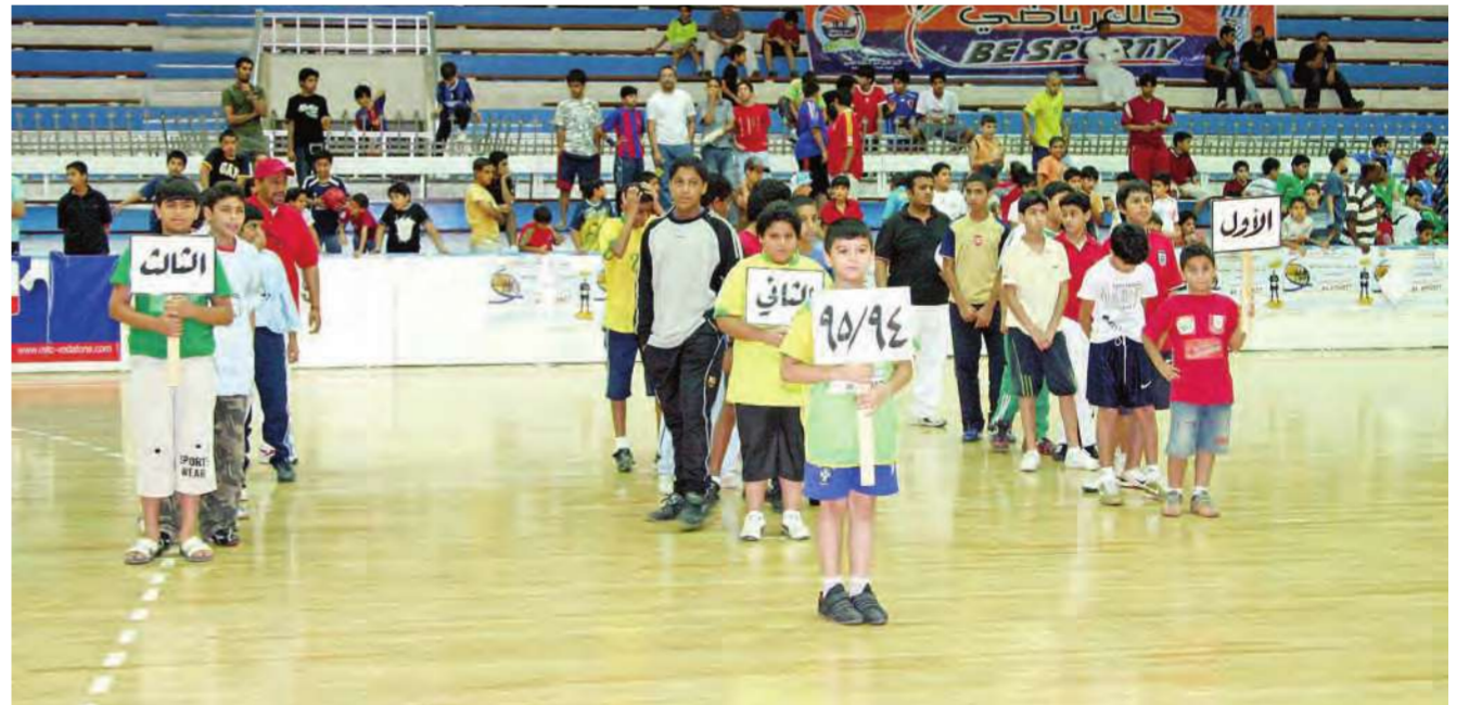
الفرق الثلاثة الأولى