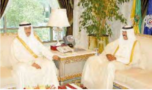
... ومستقبلاً فيصل المحجي

استقبل سمو ولي العهد الشيخ نواف الأحمد في ديوانه بقصر السيف صباح أمس رئيس مجلس الإمامة بالإنابة الدكتور محمد محسن البصري. كما استقبل سموه بقصر السيف سمو رئيس مجلس الوزراء الشيخ ناصر المحمد ونائب رئيس مجلس الوزراء وزير الخارجية الشيخ الدكتور محمد الصباح وزير الشؤون الاجتماعية والعمل وزير الداخلية والدفاع بالإنابة الشيخ صباح الخالد ونائب رئيس جهاز الأمن الوطني الشيخ فامر العلي الصباح.