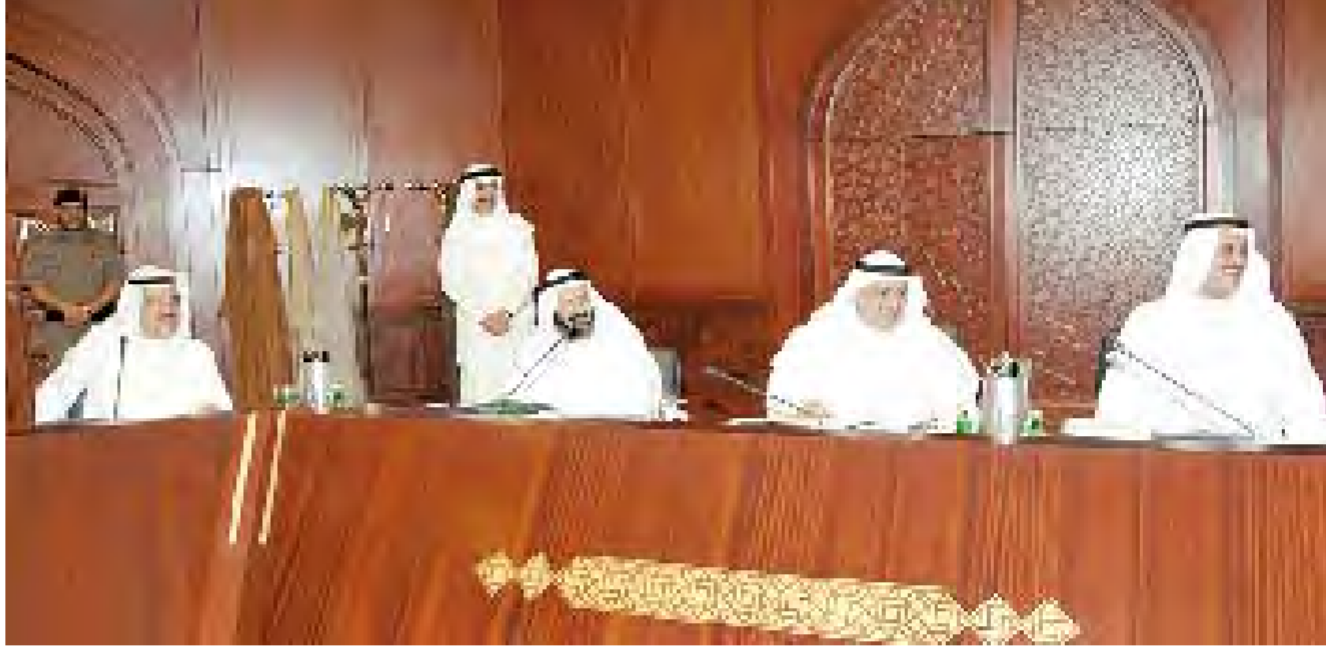
الحمضي والمحليبي والعليم والعوضي خلال الجلسة

اعتماد ترقية مستشارين إلى درجة وكيل محكمة