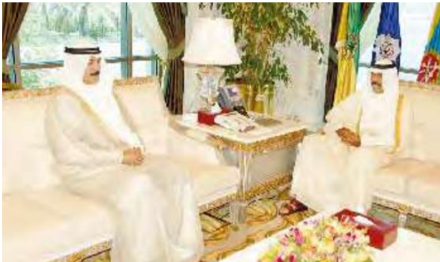
... ومحمد الخالد

واستقبل سموه بقصر السيف نائب رئيس مجلس الوزراء وزير الدولة لشؤون مجلس الوزراء فيصل المحجي. واستقبل وزير الكهرباء والماء ووزير النفط بالوكالة محمد العليم. كما استقبل سموه المستشار بالديوان الأميري الشيخ محمد الخالد.