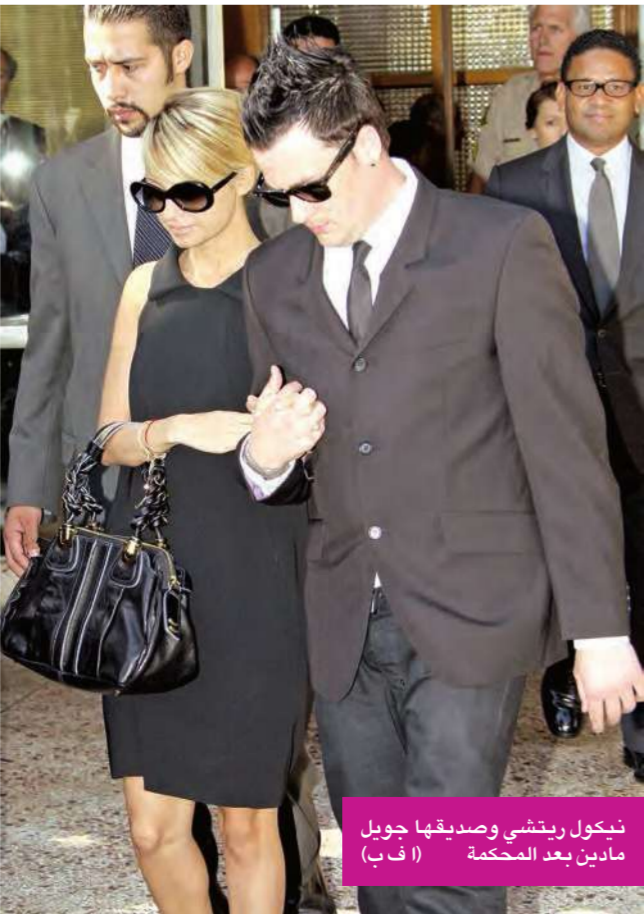
نيكول ريتشي وصديقتها جويل نادين بعد المحكمة

قضت محكمة أميركية بسجن الممثلة نيكول ريتشي أربعة أيام بسبب قيادتها سيارتها تحت تأثير الكحول، وذلك بعد شهر واحد على الإفراج عن صديقتها الحميمة نجمة المجتمع المخملي باريس هيلتون جراء تهمة مماثلة. ووافقت ريتشي بعد أن اعترفت بذنبها على الخضوع لفترة مراقبة تبلغ ثلاث سنوات والمشاركة في برنامج للتوعية من مخاطر الكحول بالإضافة إلى تغريمها 2.048 دولارا أميركيا. وبيع مفوض مقاطعة لوس انجلس خلال المحاكمة ريتشي بالقول «كان من الممكن أن يقتل أحدهم. عليك أن تفهمي أن القيادة تحت تأثير الكحول خطيرة إلى أقصى الحدود»، ومنحت المحكمة ريتشي خيار تمضية فترة سجنها في سجن مدفوع وهو أقرب إلى غرفة الفندق منه إلى السجن، ولم يحدد لها يوم أو مهلة معينة لتمضية فترة سجنها ولكن طلب منها أن تنتهي فترة الحكم قبل 28 سبتمبر المقبل. وكانت ريتشي (25 عاما) قالت في وقت سابق أنها «خائفة» من السجن ولكنها عازمة على مواجهة العواقب «وأنا اتحمل مسؤولية فعلتي كاملة».