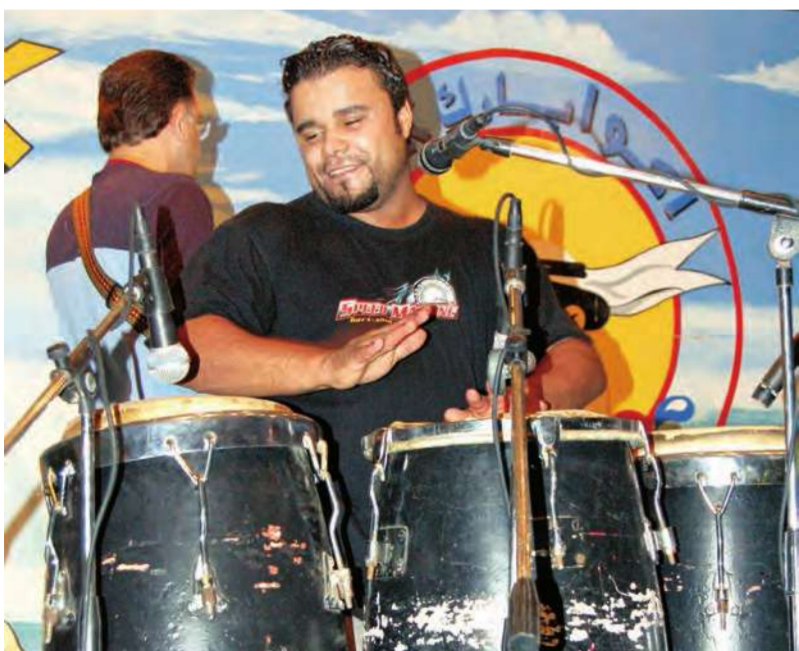
احد اعضاء فرقة النجوم وعزف على الطبول