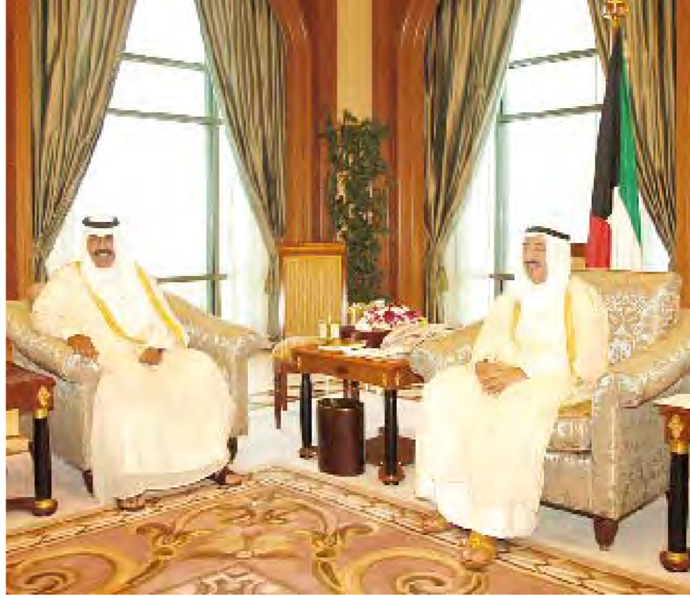
الأمير مستقبلاً ولي العهد

وكان أمير البلاد الراحل الشيخ جابر الأحمد الصباح زار منغوليا في أكتوبر 1995 تعبيراً عن شكر الكويت وامتنانها شعبياً وحكومة للموقف المنغولي تجاه العدوان العراقي، إضافة إلى تعزيز أواصر الصداقة المتبادلة بين دولة الكويت ومنغوليا. وأكد سموه رحمه الله خلال الزيارة أنه يشعر بسعادة غامرة وهو في هذه البلاد العريقة ذات التاريخ الطويل المؤثر، وأعرب عن أمله في أن تكون الزيارة فاتحة لعلاقات أوضح وتعاون رحب لخير البلدين وشعبيهما الصديقين. وزار الرئيس المنغولي السابق ناتا ساجن باجاباندي الكويت في مارس 1998 أجرى خلال زيارته مباحثات تركزت حول العلاقات الثنائية وسبل تطويرها في المجالات كافة. وتشير احصاءات الصندوق الكويتي إلى أنه قدم حتى سبتمبر 2003 ثلثة قروض لمنغوليا بلغت قيمتها 18 مليون دينار كويتي (400.59 مليون دولار أميركي) شملت قطاع النقل والمواصلات والطاقة.