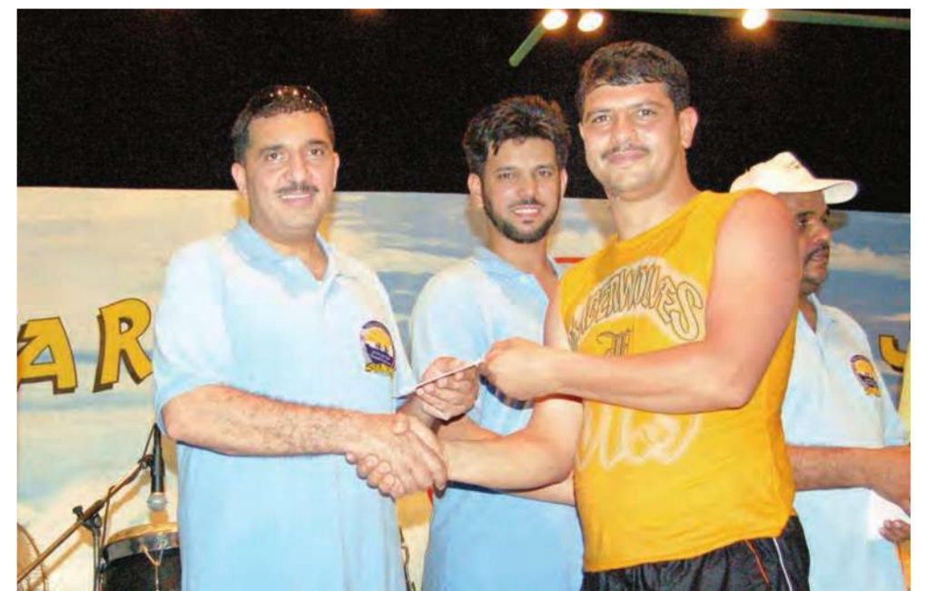
احد الفائزين يتسلم هديته