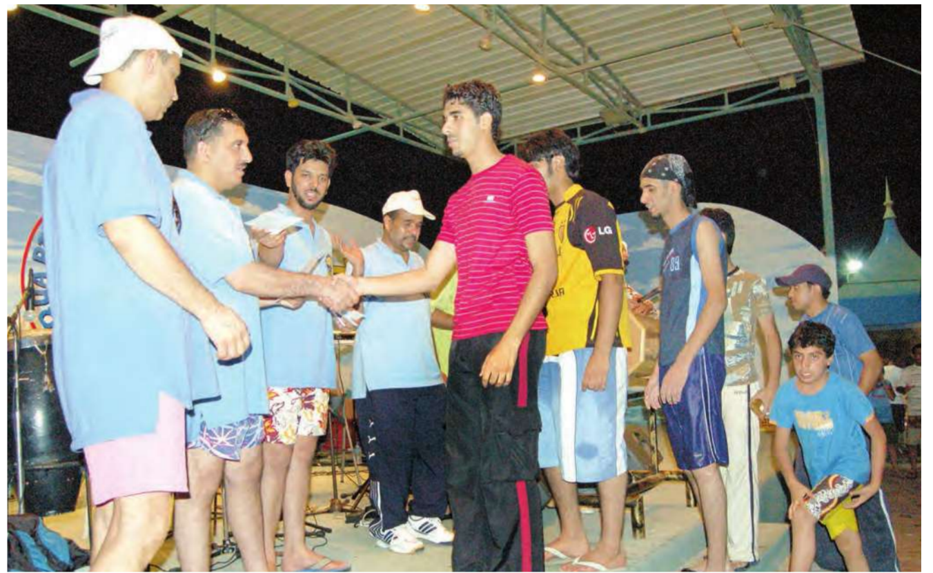
الفايزون في المسابقات