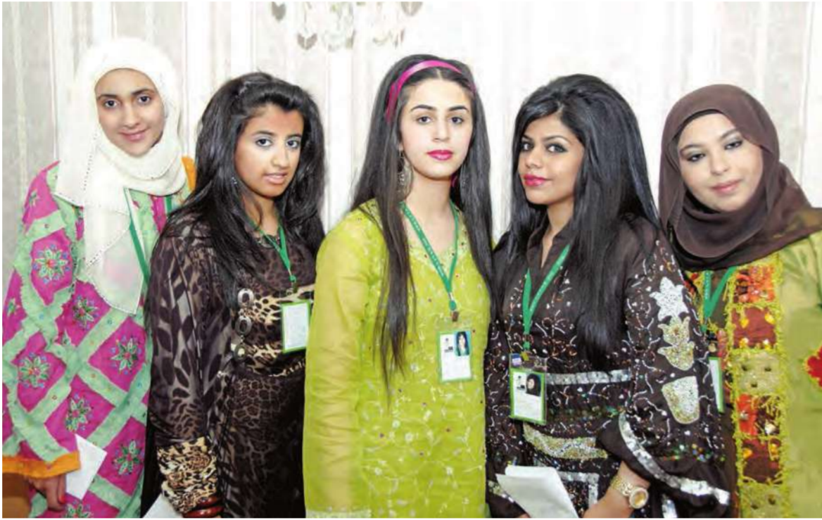
اعضاء اللجنة التراثية

المناسبة اختتام أنشطة «لويك» الصيفية المكان فندق شيراتون