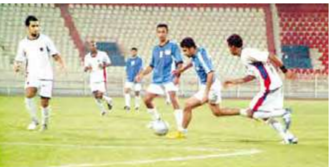
لقاء منتخب الداخلية مع فريق الكويت

منتخب الشرطة قدم مباراة قوية رغم غياب العناصر الأساسية