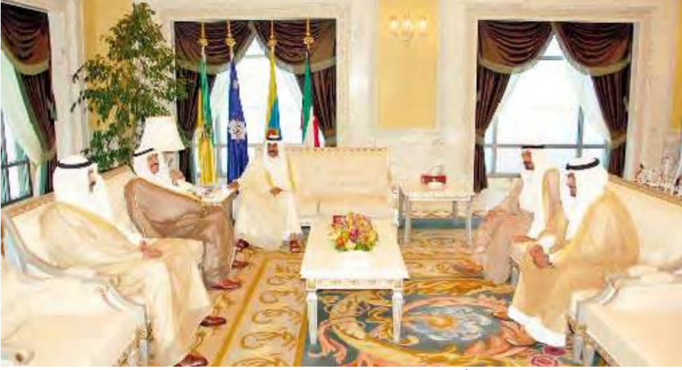
ولي العهد مستقبلاً رئيس الوزراء وعدداً من الوزراء