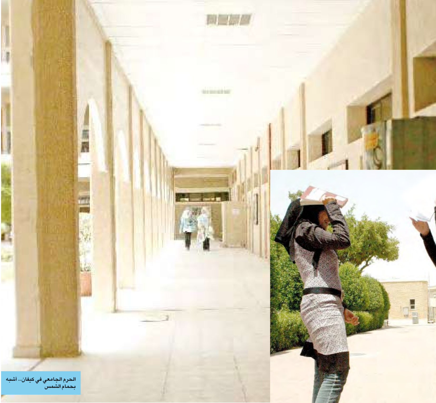
بحمام الشمس الحرم الجامعي في كيفان... أشبه

«كليات كيفان» و«كليات الشويخ» مصطلحان دخیلان على الحياة الجامعية، ساهم في ظهورهما التفريق الواضح في التعامل مع كليات ينتمي جملها إلى جامعة الكويت، فتمّة كليات تتال من الخدمات ما يزيد على حاجتها، وكليات أخرى تجري وراء ما يسد الرمق... فمتى نعود إلى التسمية الأولى الأصلية «كليات جامعة الكويت»؟