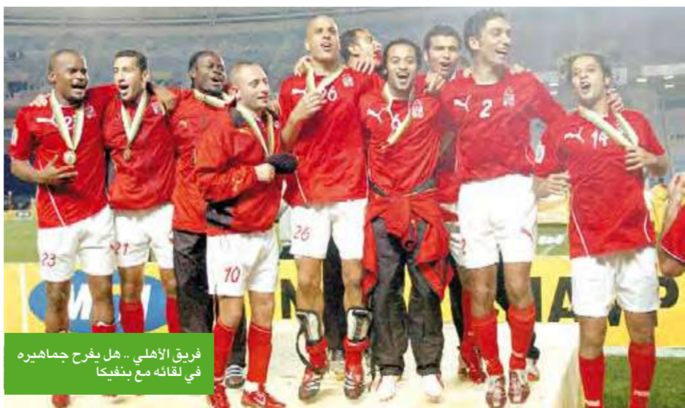
فريق الأهلي... هل يفرح جماهيره في لقائه مع بنفيكا