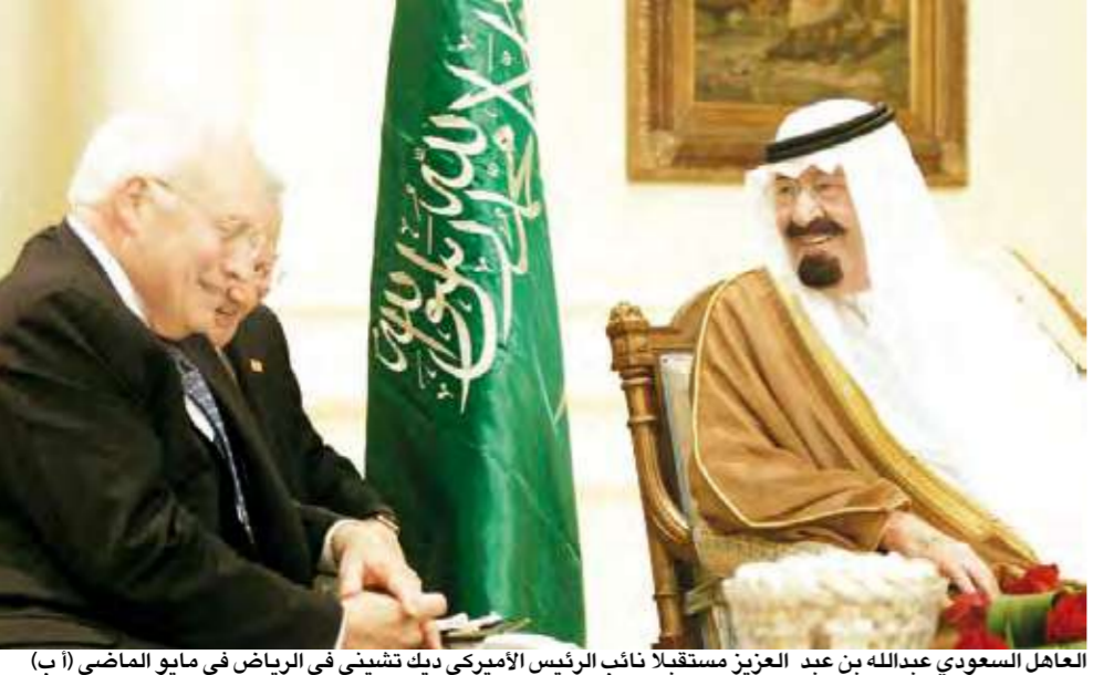
العاهل السعودي عبدالله بن عبد العزيز مستقبلا نائب الرئيس الأميركي ديك تشيني في الرياض في مايو الماضي

ومن الجدير ذكره أن الانظمة السنية في منطقة الخليج شعرت