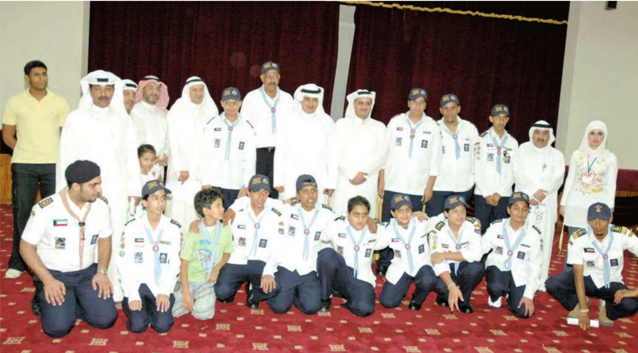
وفد الكشافة في زيارة النادي العلمي

زار وفد من جمعية الكشافة الكويتية النادي العلمي، حيث تعرف افراده على المرافق في النادي والانشطة والندوات التدريبية التي اقامها هذا العام في برنامج «النادي الصيفي»، كما تعرف الوفد الزائر على رؤساء الادارات في النادي واطلعوا منهم على الخطط التي تنتهجها كل ادارة لتعزيز وتطوير البرامج التي يضعها النادي للطلبة كل عام.