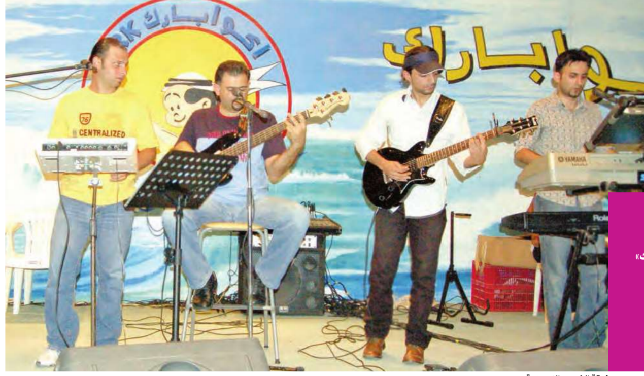
فرقة النجوم الكويتية

المناسبة «الشباب والرياضة» في ضيافة «الأكوابارك» المكان «الأكوابارك»