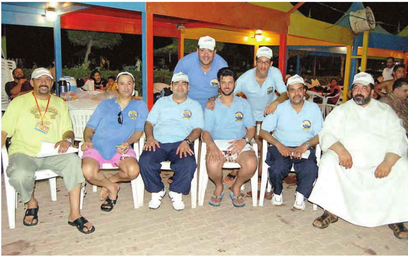
فريق عمل تفعيل أنشطة الرياضة للجميع

المناسبة «الشباب والرياضة» في ضيافة «الأكوابارك» المكان «الأكوابارك»