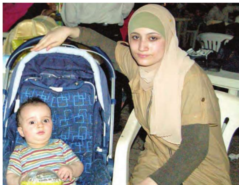
مشاركة للطفولة في اليوم المفتوح