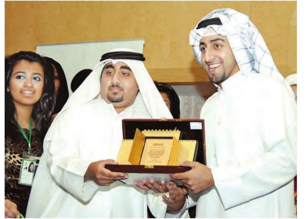
تكريم فريق لويك الموسيقي