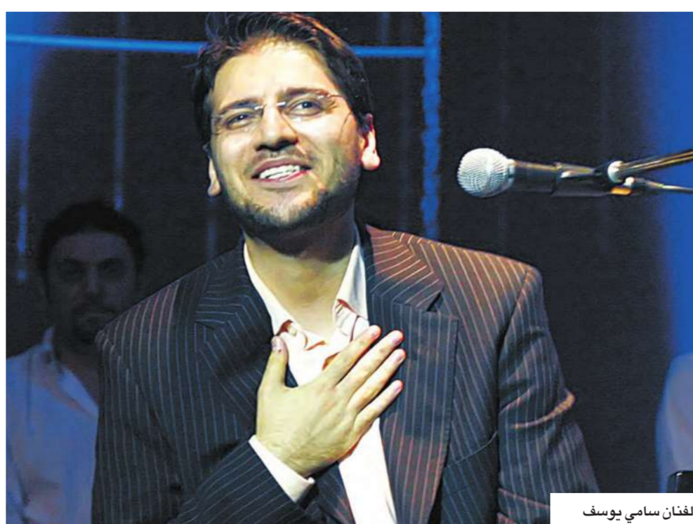
الفنان سامي يوسف

يؤكد يوسف قدومه إلى القاهرة في رمضان المقبل لتصوير إحدى