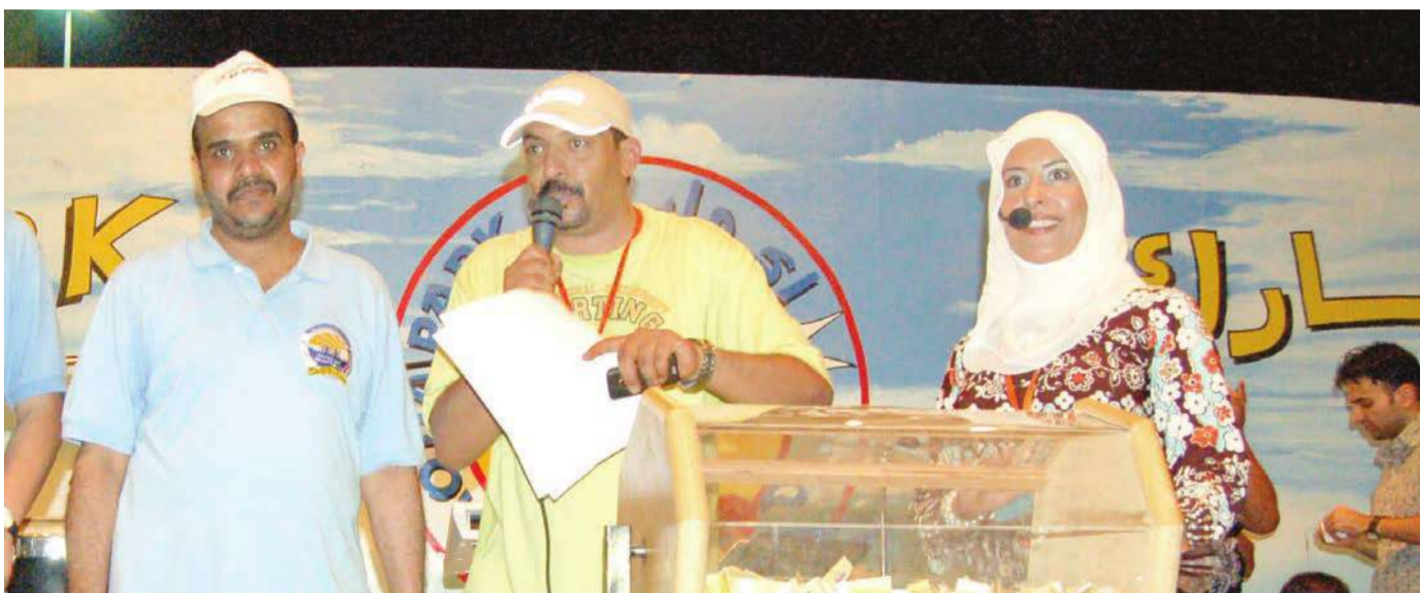
اعلان اسما الفائزين بالقرعة