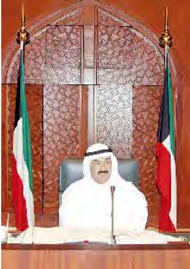
ناصر المحمد مترئساً للجلسة

بدأت وزارة الإعلام التطبيق الفعلي لقانون المطبوعات والنشر، وذلك من خلال اتخاذ الإجراءات القانونية بحق الصحف والمطبوعات الدورية المخالفة للقانون.