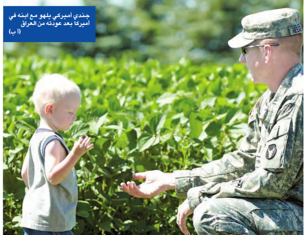
جندي أميركي يلهو مع ابنه في أميركا بعد عودته من العراق

تأمل واشنطن في تطوير إطار تستطيع من خلاله الفضائل المتنافسة أن تحل خلافاتها وتسن قانوناً بشأن النفط العراقي، وتمتر تشريعاً يهدف إلى إدخال حزب «البيت» السابق إلى الحكومة.