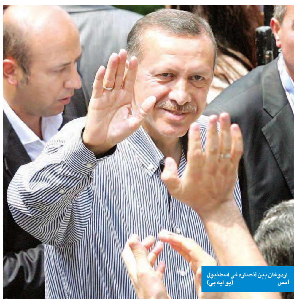
ردوغان بين انصاره في اسطنبول أمس

حقق حزب «العدالة والتنمية» التركي بزعامة رئيس الوزراء رجب طيب اردوغان، أمس، فوزاً كاسحاً في الانتخابات التشريعية فاق التوقعات، وأسقط الرهانات على حدوث تغيير في سياسة البلاد في المرحلة المقبلة، في وقت يأمل الكثيرون أن يؤدي هذا الفوز إلى تخفيف القيود على ارتداء الحجاب، وهي المسألة التي شكلت محركاً كبيراً في الانتخابات، وطغت بشكل لافت على النقاشات خلال الفترة الماضية.