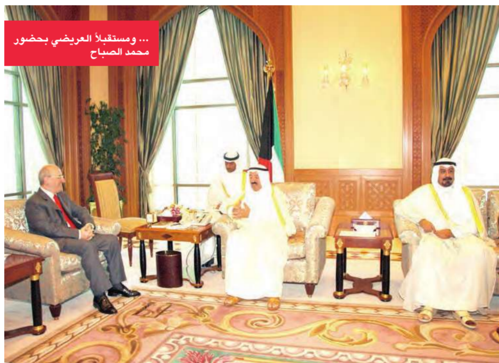
... ومستقبلاً العريضي بحضور محمد الصباح

رئيس مجلس الوزراء وزير الخارجية الشيخ الدكتور محمد الصباح برافقه وزير الإعلام في الجمهورية اللبنانية الشقيقة غازي العريضي وذلك بمناسبة زيارته البلاد. وأكد سموه على موافقة دولة الكويت الثابتة تجاه لبنان الشقيق ووقوفها إلى جانبه ودعمه وموازنته من أجل الحفاظ على أمنه وسلامته واستقراره. وحضر المقابلة وزير الإعلام عبدالله المحيلبي ورئيس المراسم والتشريفات الشيخ خالد عبداللله. كما استقبل سموه وزير خارجية جمهورية جامبيا بالا جاربا والوفد المرافق له حيث سلم لسموه رسالة خطية من الرئيس يحيى جامع رئيس جمهورية جامبيا تتعلق بتعزيز العلاقات الثنائية بين البلدين الصديقين وسبل تعزيزها لما فيه مصلحة البلدين والشعبين الصديقين، كما تطرقت إلى المستجدات الراهنة على الساحتين الإقليمية والدولية. واستقبل سمو أمير البلاد الأمين العام السابق لجائزة دبي الدولية لحفظ القرآن الكريم الدكتور عارف الشيخ، الذي أهدى سموه كتاباً حمل عنوان (تلفزيون الكويت من دبي).