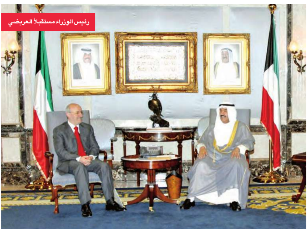
رئيس الوزراء مستقبلاً العريضي