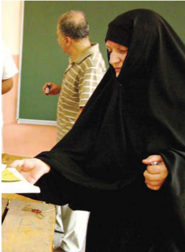
(إي إي بي) مواطنة تركية تتجه لالدلاء بصوتها في اسطنبول أمس