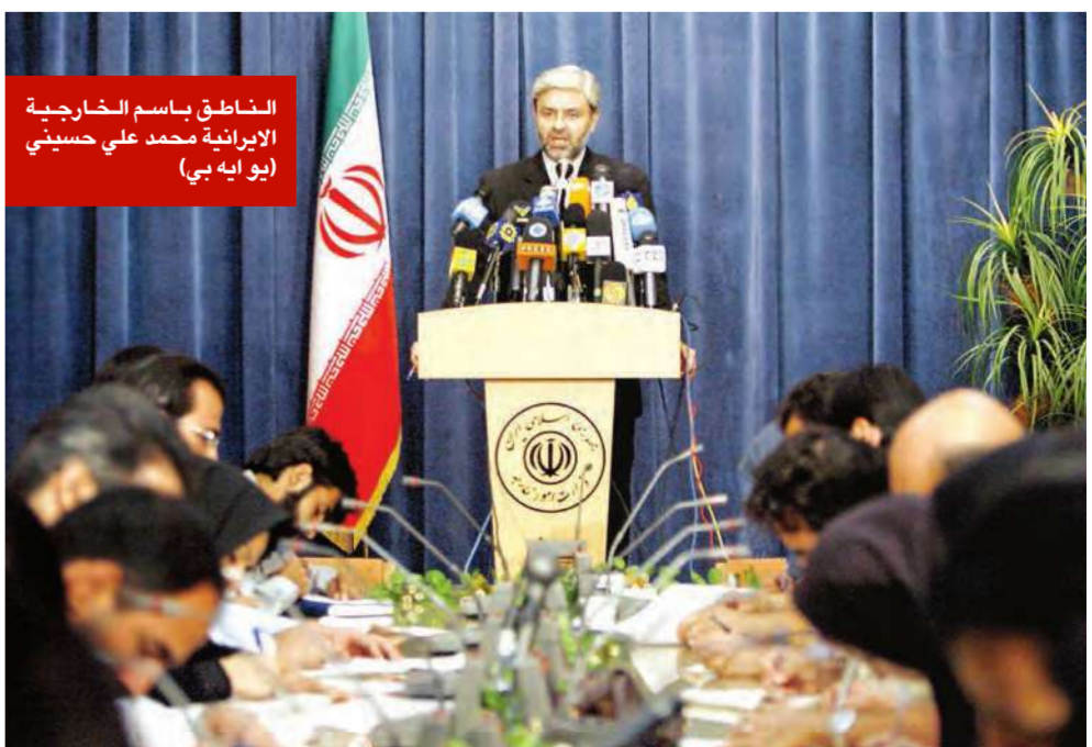
الناطق باسم الخارجية الإيرانية محمد علي حسيني

في وقت شنت طهران هجوماً عنيفاً على واشنطن أمس متهمه بإيها بـ «إثارة الانقلابات» ضدها، تضاربت المعلومات عن موعد عقد الجولة الثانية من المحادثات الأميركية-الإيرانية بشأن العراق في بغداد.