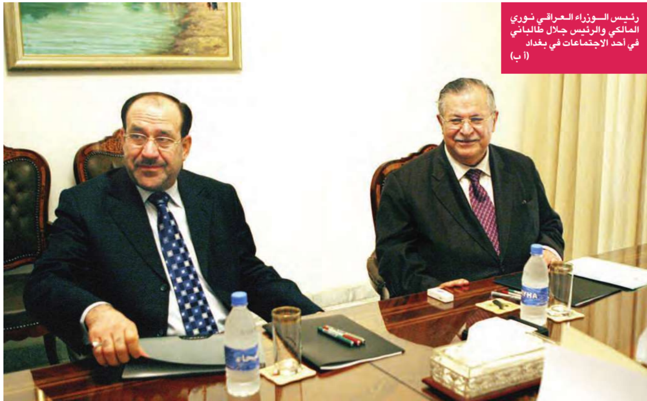
رئيس الوزراء العراقي نوري المالكي والرئيس جلال طالباني في أحد الاجتماعات في بغداد

المسؤولون الأميركيون لم يعترفوا بأن الحكومة العراقية ليست هي من يتخذ القرارات