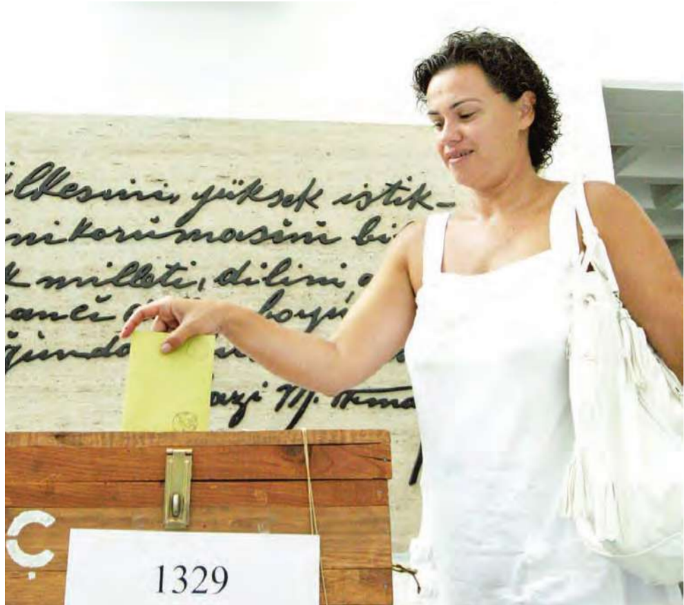
مواطنة تركية تدلي بصوتها في أنقرة أمس