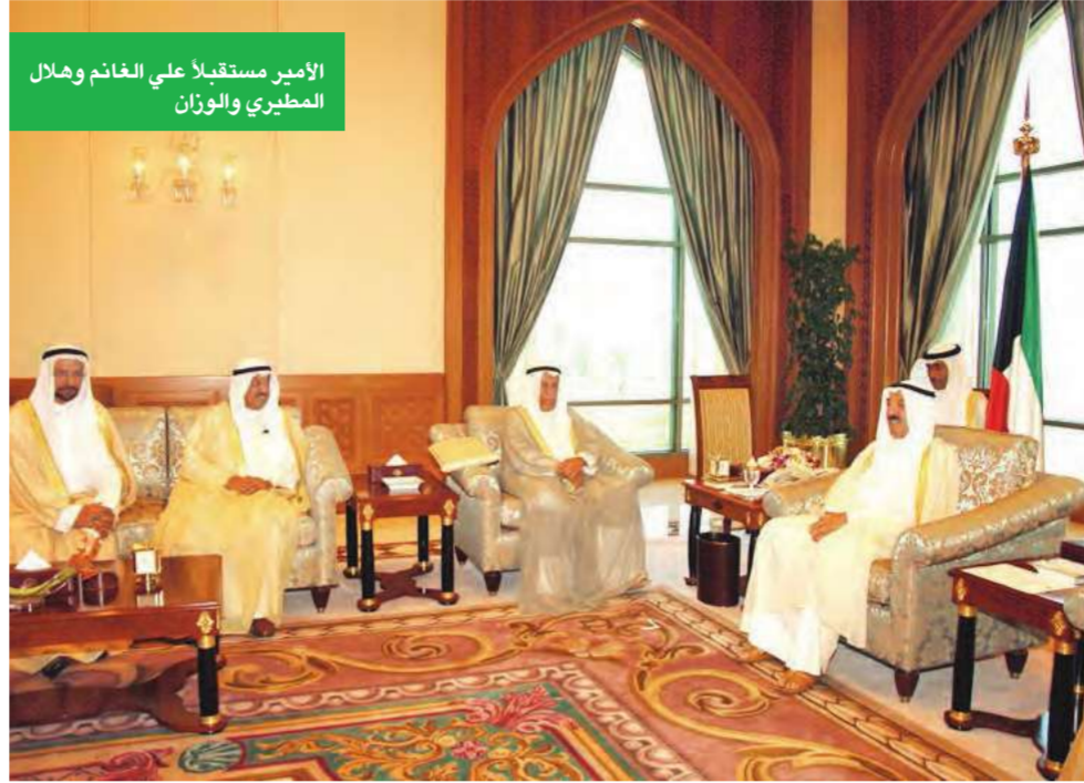
الأمير مستقبلاً علي الغانم وهلال المطيري والوزان

استقبل سمو ولي العهد الشيخ نواف الأحمد في ديوانه بقصر السيف أمس وزير المالية بدر الحميضي. استقبل سمو ولي العهد الشيخ نواف الأحمد الجابر الصباح حفظه الله في ديوانه بقصر السيف اليوم معالي وزير الدولة لشؤون الإسكان وزير المواصلات وزير الدولة لشؤون مجلس الأمة بالوكالة عبدالواحد محمود العوضي. كما استقبل سموه رئيس وأعضاء غرفة تجارة وصناعة الكويت، حيث قدموا لسموه تقريراً باطروحات وتوصيات المؤتمر الثاني للقطاع