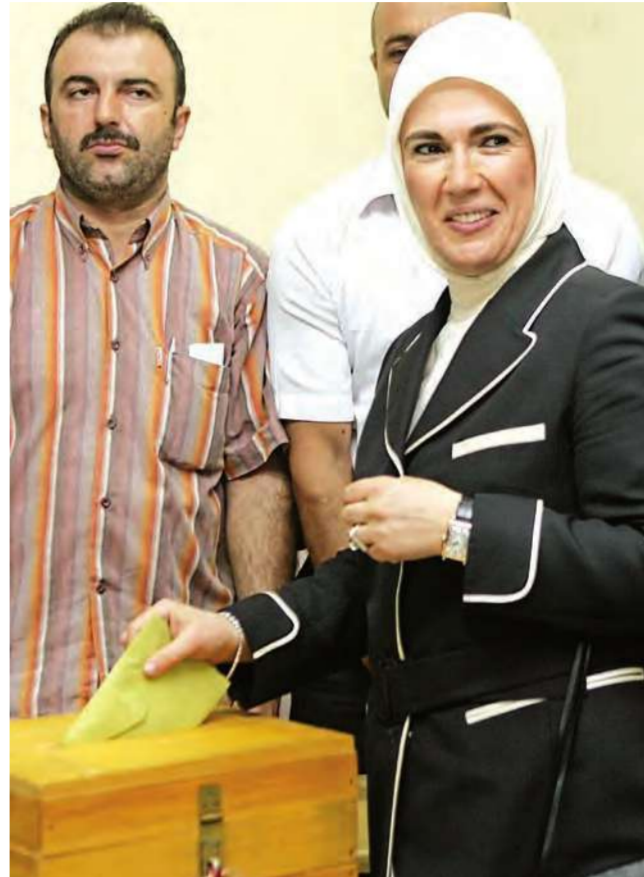
(أ ب) إيمين، زوجة رئيس الوزراء التركي رجب طيب أردوغان تدلي بصوتها في اسطنبول

في تركيا، تدور المسألة كلها خلال النقاشات الانتخابية حول الحجاب. فأكثر ما يلقى الناخبين العلمانيين ما تضعه، أو لا تضعه النساء على رؤوسهن. إلا أن آخرين يرون أنه إذا تسلم حزب «العدالة والتنمية» الحكم، فسيضع حداً للتمييز وسيسمح بوضع الحجاب في الجامعات العامة.