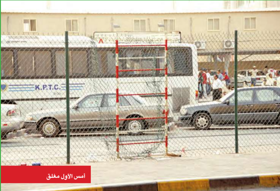
أمس الأول مغلق