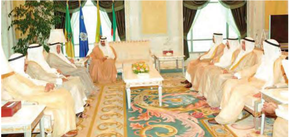
ولي العهد مستقبلاً رئيس وأعضاء غرفة التجارة