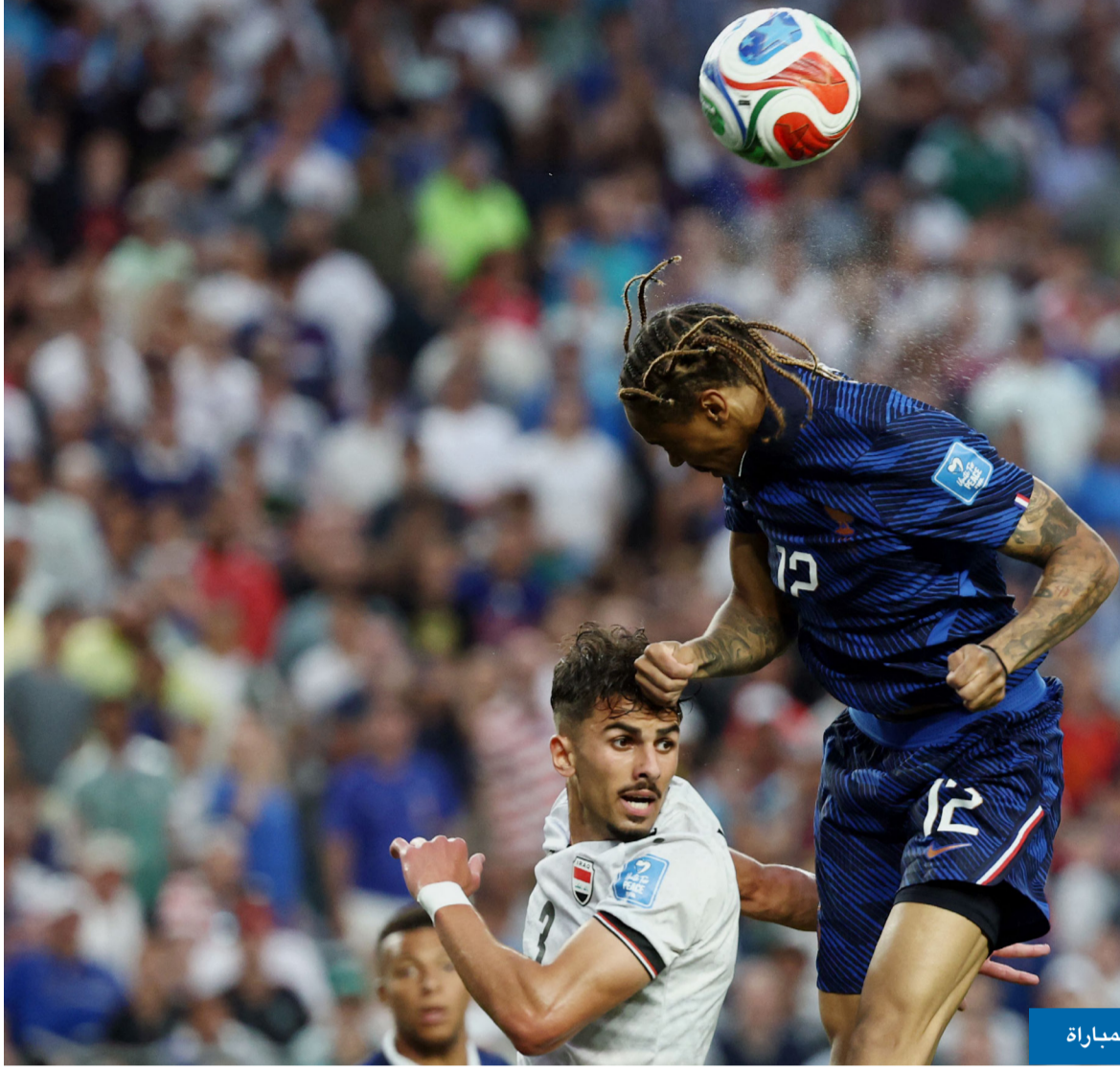
حسين علي والفرنسي برادلي باركولا وصراع على الكرة خلال المباراة

احتفل مباني بمباراته الدولية الـ 100 بثنائية أمام العراق، رافعاً رصيده إلى 16 هدفاً موندالياً، ليقود فرنسا للفوز الثاني والتأهل لدور الـ 32، في حين واصل العراق سلسلة هزائمه التاريخية.