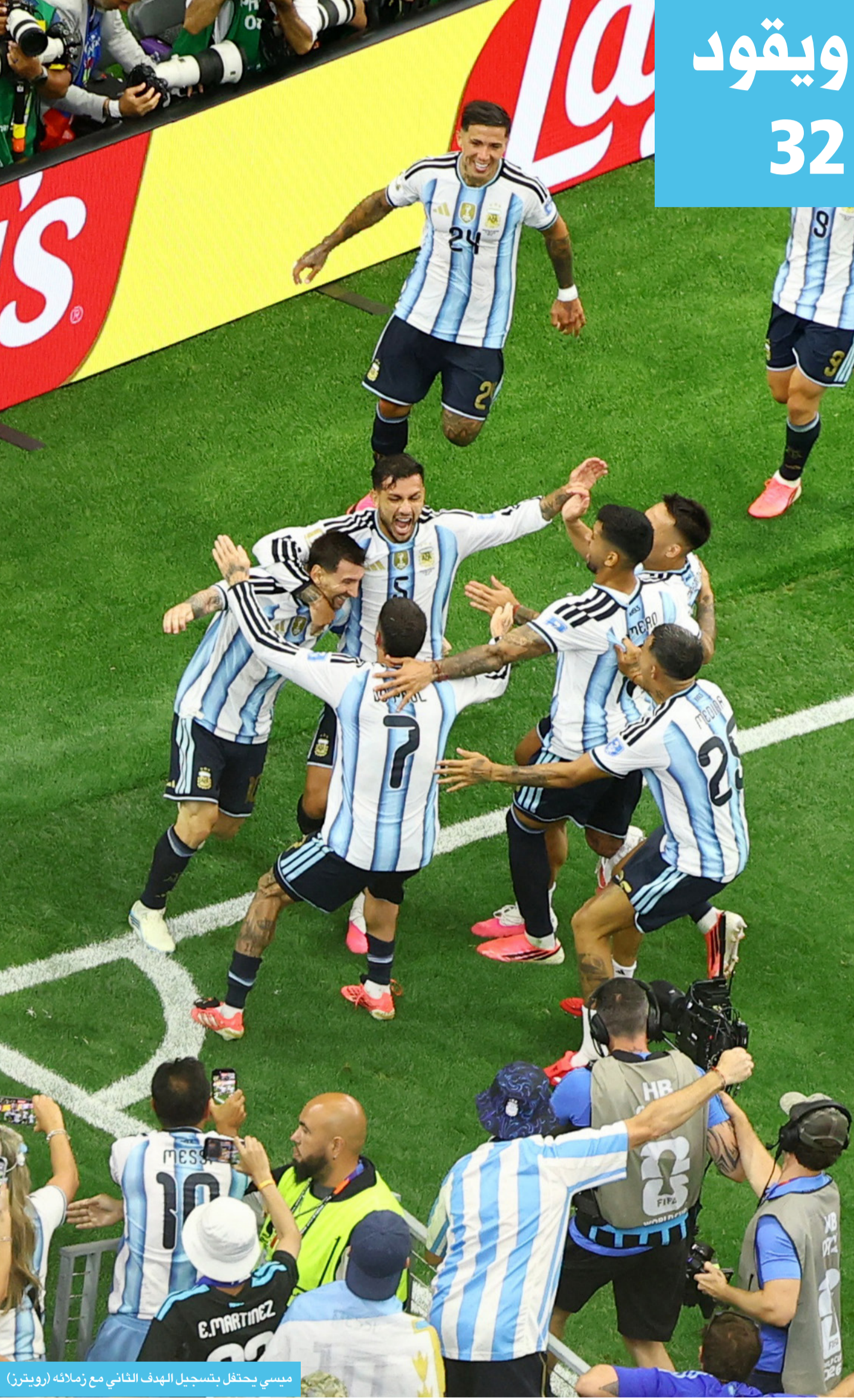
ميسي يحتفل بتسجيل الهدف الثاني مع زملائه