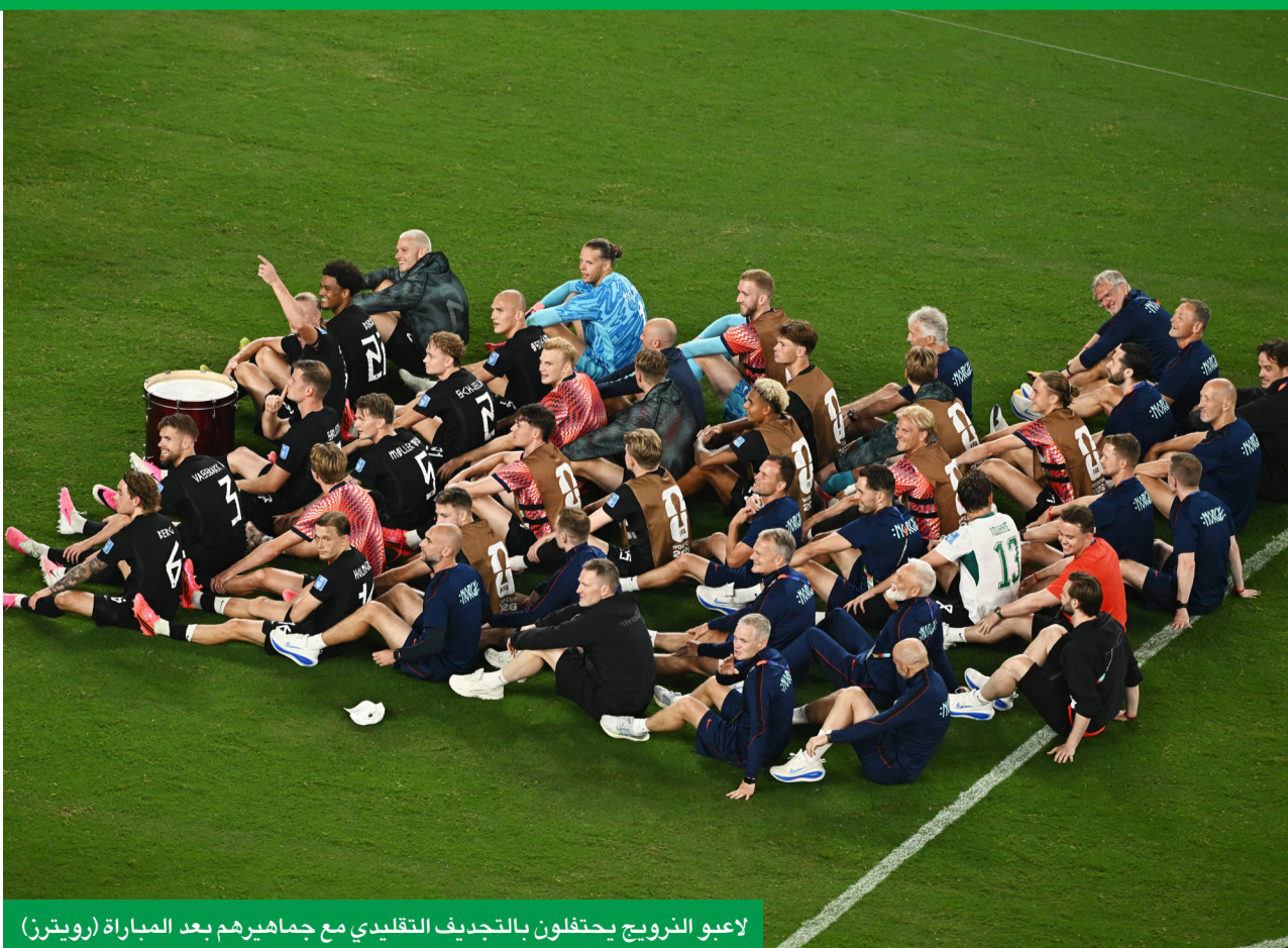
لاعبو النرويج يحتفلون بالتحديد التقليدي مع جماهيرهم بعد المباراة

المباراة: النرويج - السنغال 2-3 الملعب: ميتلايف، إيست رانزفورد (نيوجيرزي/نيويورك) الجمهور: 80663 متفرجاً الدور الأول - الجولة الثانية المجموعة التاسعة الحكم: ويلتون سامبايو (البرازيل) الأهداف: النرويج: ماركوس هولمغرين بيدرسن (43)، إرلينغ هالاند (58، 48) السنغال: إسماعيل سار (53، 90، 3) المدرّب: النرويج: ستاله سولباكن السنغال: باب تياو