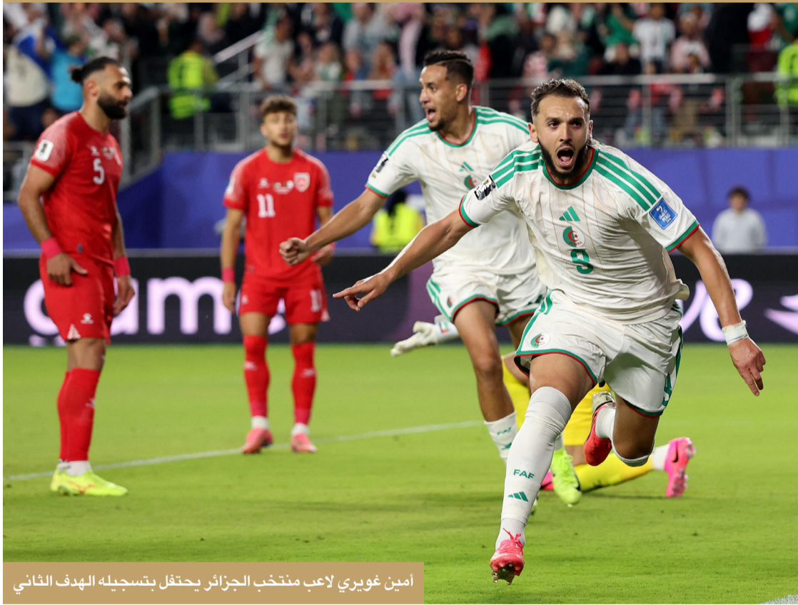
أمين غويري لاعب منتخب الجزائر يحتفل بتسجيله الهدف الثاني

قلبت الجزائر تأخرها أمام الأردن في الشوط الثاني وهزمتها 2 - 1 لتقصيه من دور المجموعات، الاثنين، في سانتا كلارا في سان فرانسيسكو، ضمن الجولة الثانية من مونديال 2026 في كرة القدم.