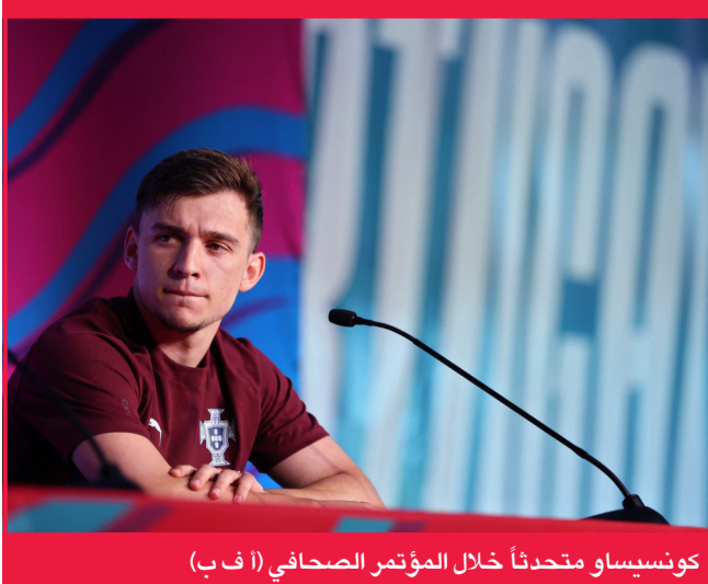
كونسيساو متحدثاً خلال المؤتمر الصحفي (أ ف ب)

أكد جناح البرتغال فرانسيكو كونسيساو أنه وزملاءه في المنتخب لا يشعرون بأي ضغط لتمير الكرة إلى كريستيانو رونالدو، وذلك في ظل انتقادات طالت نجم المخضرم بعد أدائه الباهت في مباراة بلده بكأس العالم 2026. وشنت الصحافة البرتغالية هجوماً على المنتخب الذي استهل مشواره الأربعة بتعادلاً مخيباً مع الكونغو (1-1)، معتبراً أن رونالدو أصبح «بحد ذاته مشكلة». لكن كونسيساو شدد الأحد على أنه لا يوجد أي شعور لدى اللاعبين بضرورة تمرير الكرة إلى رونالدو إذا كان هناك زملاء آخرون في مواقع هجومية أفضل، مضيفاً: «لا نشعر بالحاجة إلى تمرير الكرة إليه، أمرها لمن أراه في أفضل موقع وخالياً من الرقابة».