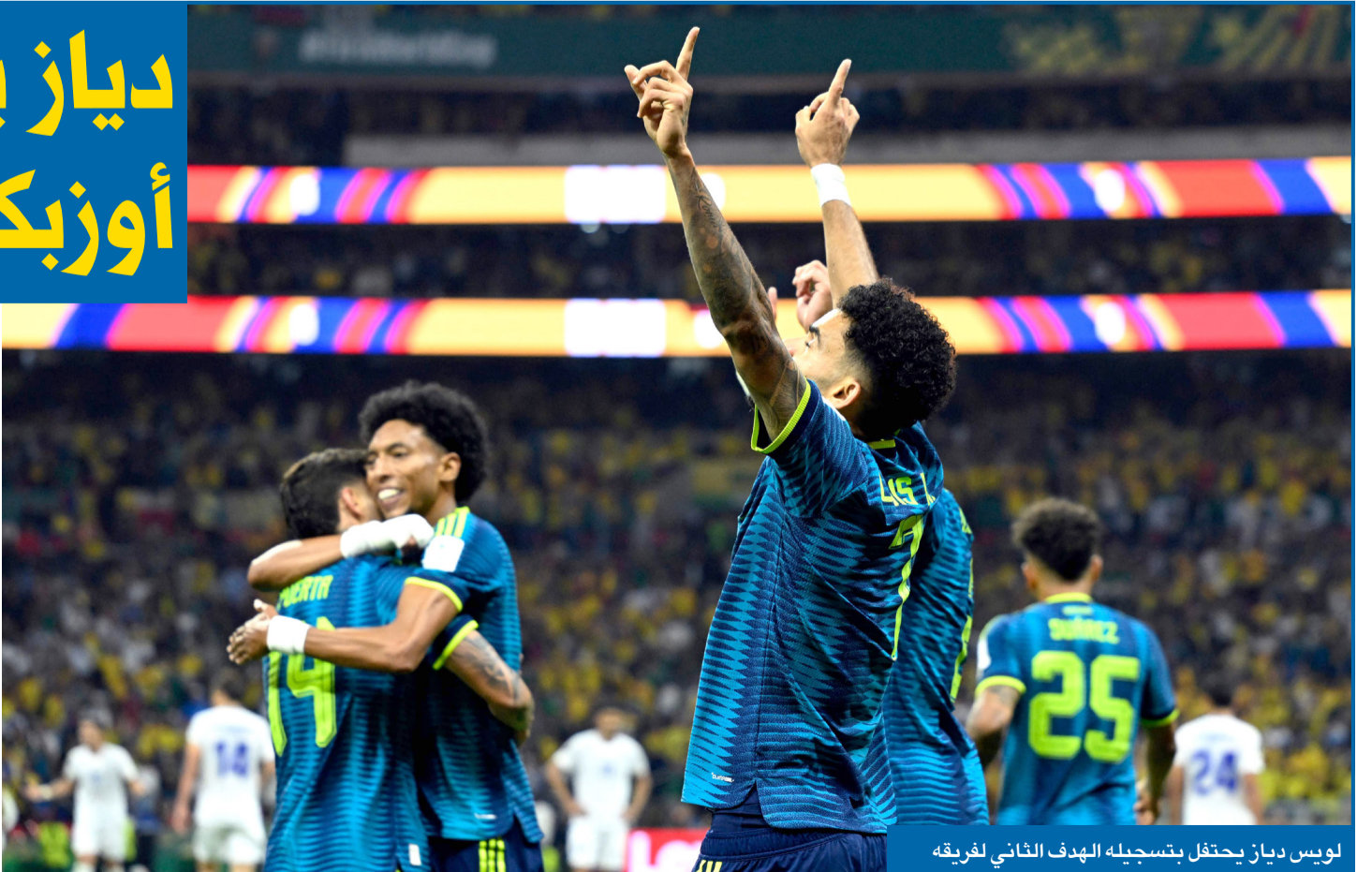
لويس دياز يحتفل بتسجيله الهدف الثاني لفريقه

ولم يهنا منتخب أوزبكستان بهدف التعادل كثيراً، بعدما أحرز دياز الهدف الثاني للمنتخب الكولومبي في الدقيقة 65، بينما تكفل جامينتون كامباز بتسجيل