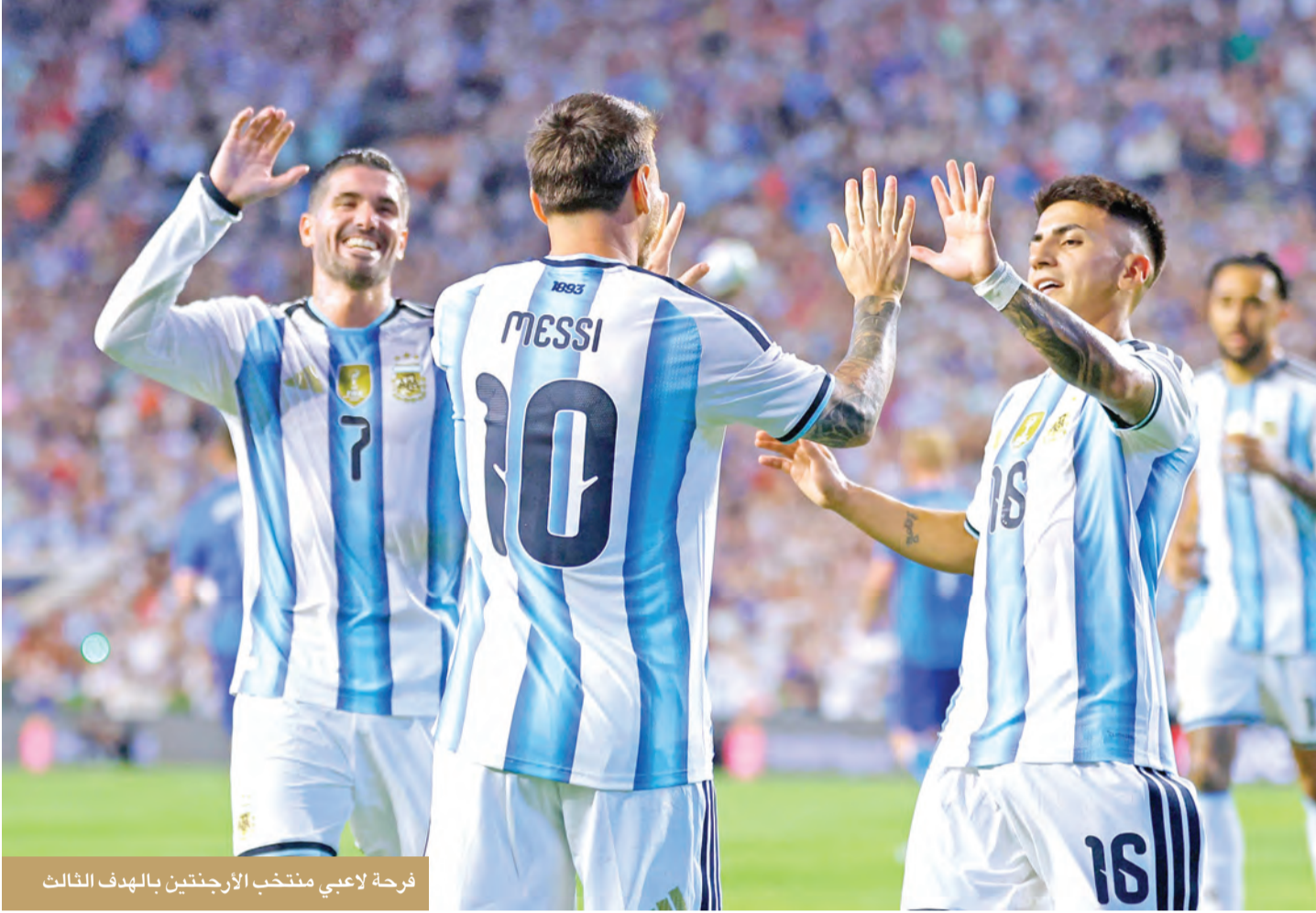
فرحة لاعبي منتخب الأرجنتين بالهدف الثالث

بهودء إلى كأساس سبتي، حيث سيواجه الجزائر في ليل 16 يونيو، ضمن مباراتها الافتتاحية بكأس العالم في منافسات المجموعة العاشرة التي تضم أيضاً النمسا والأردن.