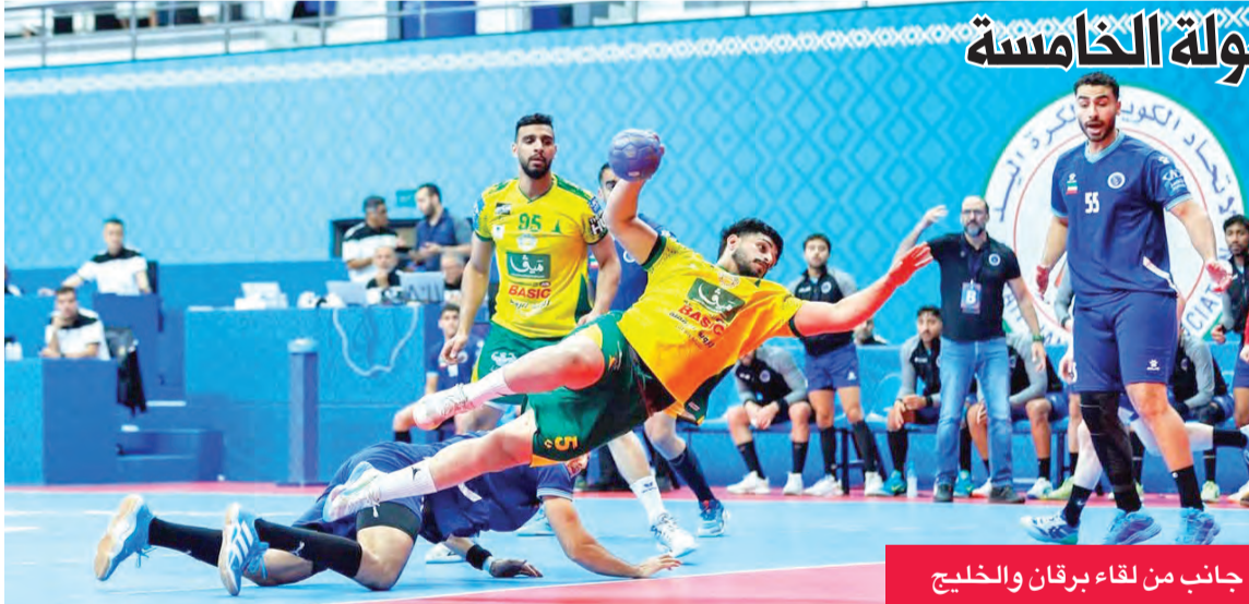
جانب من لقاء برقان والخليج