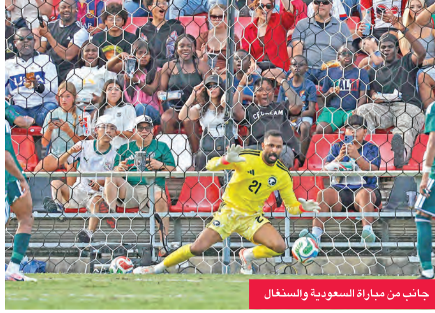
جانب من مباراة السعودية والسنغال

خُيّمَت الأخطاء الدفاعية على أداء منتخب العراق في مباراته الإعدادية الأخيرة للمونديال،