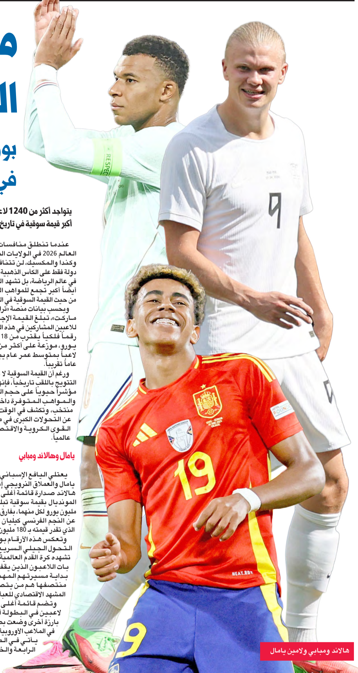
هالاند ومبابي ولامين يامال

يعتلي الياقع الإسباني لامين يامال والعملاق النرويجي إيرلينغ هالاند صدارة قائمة أعلى لاعبي المونديال بقيمة سوقية تبلغ 200 مليون يورو لكل منهما، بفارق ضئيل عن النجم الفرنسي كيليان مبابي الذي تقدر قيمته بـ180 مليون يورو. وتعكس هذه الأرقام بوضوح التحول الجيلي السريع الذي تشهده كرة القدم العالمية، حيث بات اللاعبون الذين يقفون في بداية مسيرتهم المهنية أو منتصفها هم من يتصدرون المشهد الاقتصادي للعبة. وتضم قائمة أعلى عشرة لاعبين في البطولة أسماء بارزة أخرى وضعت بصمتها في الملاعب الأوروبية، حيث يأتي في المرتبة الرابعة والخامسة