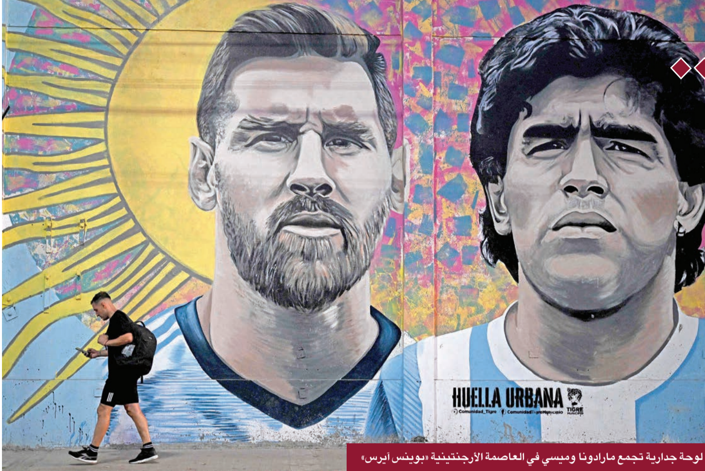
لوحة جدارية تجمع مارادونا وميسي في العاصمة الأرجنتينية «بوينس آيرس»

الدقيقة 51، ثم هدفه الثاني وتكررت ثنائيات مارادونا مجدداً في نصف النهائي أمام بلجيكا (52) و(63)، ليضع