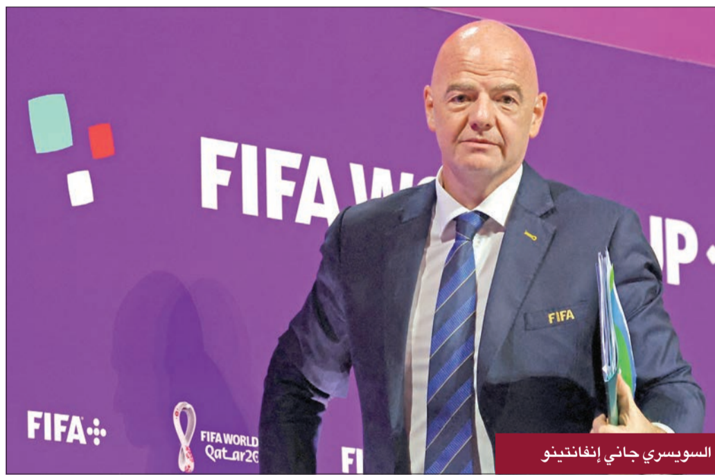
السويسري جاني إنفانتينو

معتبراً أن المنافسة الموسعة عدداً ستعود بإرباح مادية أكبر لـ «فيفا». زيادة الإيرادات و أفاد إنفانتينو بأنه من المتوقع