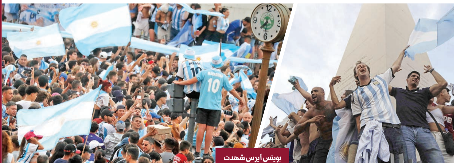
بوينس آيرس شهدت تجمعات بمئات الآلاف