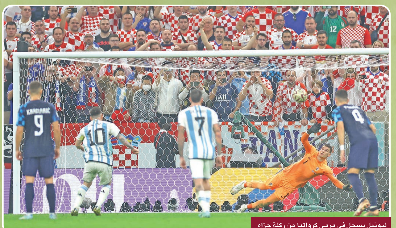
ليونيل يسجل في مرمى كرواتيا من ركلة جزاء