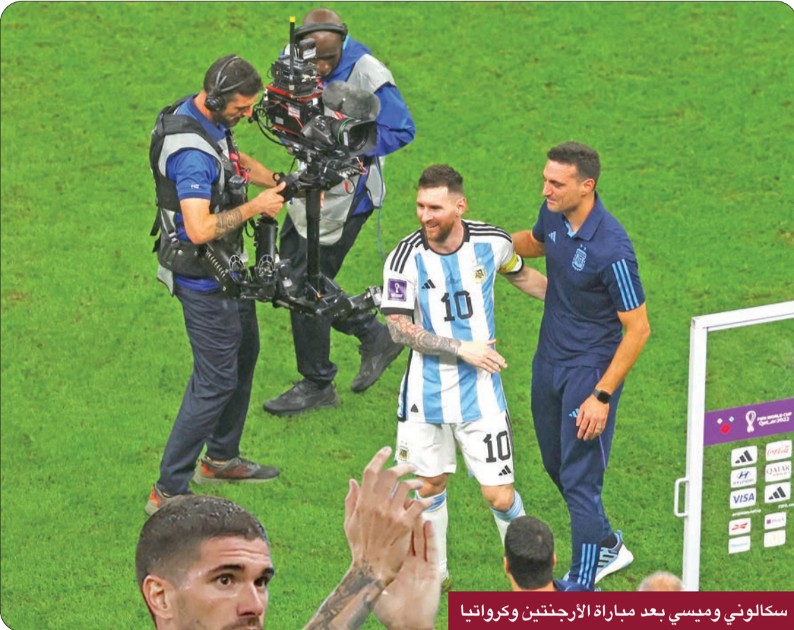
سكالوني وميسي بعد مباراة الأرجنتين وكرواتيا

مع الألماني لوتار ماتئوس صدارة قائمة اللاعبين الأكثر مشاركة في تاريخ المونديال برصيد 25 مباراة لكل منهما.