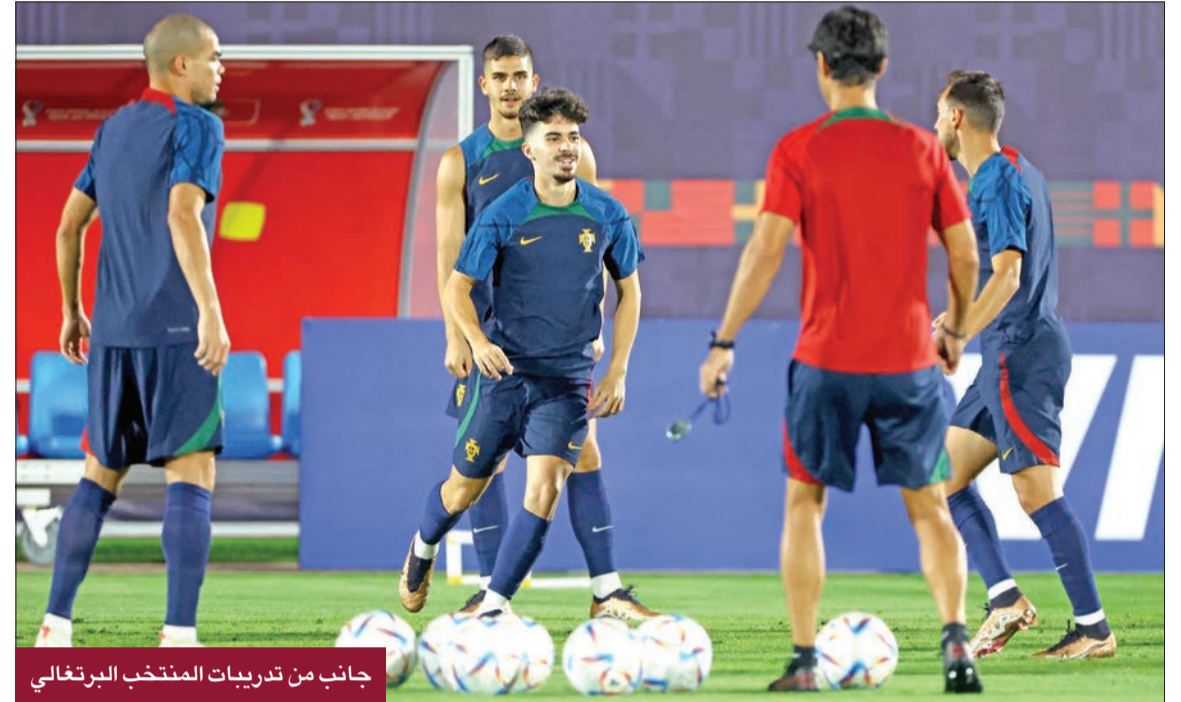
جانب من تدريبات المنتخب البرتغالي

مانشستر سيتي أو المنتخب البرتغالي، إلى جانب الثورة التي أطلقها مهاجم غونزالو راموس الذي سجل ثلاثية خلال الفوز الساحق 6-1 على سويسرا. ولفت راموس الأنظار هذا الموسم في صفوف بنفيكا بعد أن حصل على فرصته في الفريق الأول عقب رحيل الأوروغوياني داروين نونيس إلى ليفربول الإنكليزي، فأبلى بلاء حسناً بتسجيله 14 هدفاً ونجاحه في 6 تمريرات حاسمة بمختلف المسابقات، كما يتصدر راموس ترتيب هدافي الدوري البرتغالي برصيد 11 هدفاً. ولا شك في أن على المنتخب المغربي التفكير في كيفية إيقاف خطورة تمريرات بيرناردو سيلفا، وأسهم بيرناردو سيلفا في تقدم مستويات لافتة، سواء مع ناديه