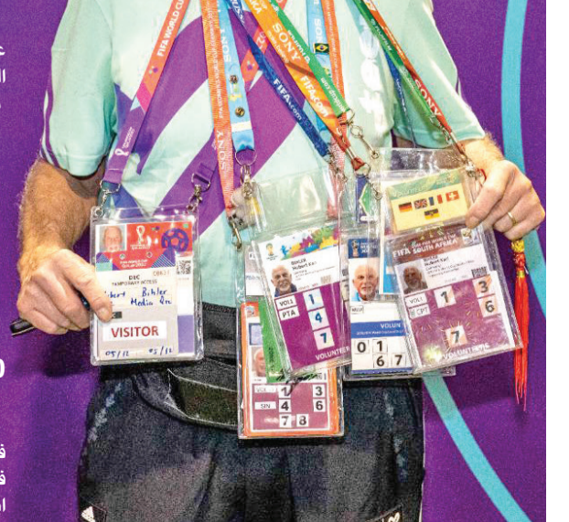
20 ألف متطوع

ويعد بيهلر من بين أكثر من 20 ألف متطوع في المونديال، ويسهم من خلال دوره التطوعي في تقديم المساعدة للمتلقي وسائل الإعلام في أستاذ 974، أحد الاستادات الثمانية المشيدة وفق