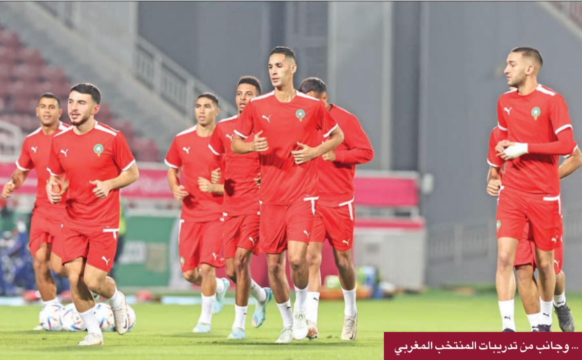
... وجانب من تدريبات المنتخب المغربي