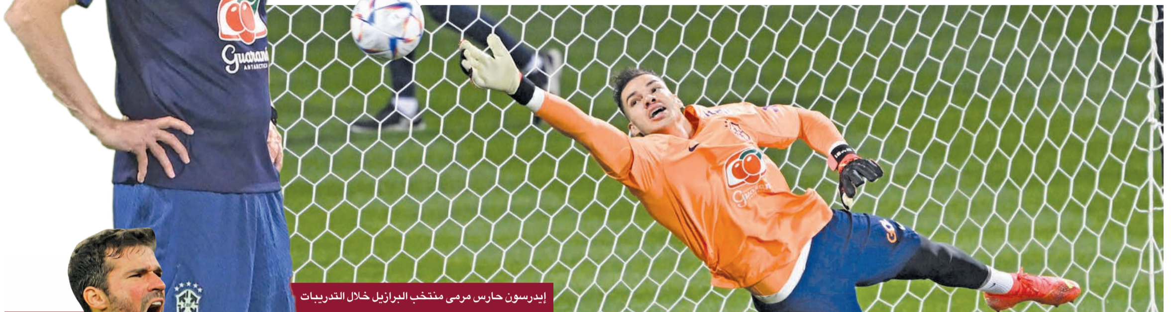
إيدرسون حارس مرمى منتخب البرازيل خلال التدريبات