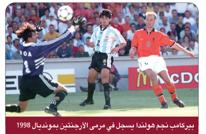
بيركامب نجم هولندا يسجل في مرمى الأرجنتين بمونديال 1998

ورد المنتخب الأرجنتيني الدين لضيفه الهولندي في نهائي كأس العالم 1978، في غياب كرويف، الذي وقع ضحية لمحاولة اختطاف مروعة قبل البطولة، حيث خسرت هولندا النهائي الثاني على التوالي ضد الدولة المضيفة في نسخة استخدمها المجلس العسكري الأرجنتيني لتبويض صورته. انتشرت مزاعم التلاعب في نتائج المباريات والضغط السياسي لمصلحة الأرجنتين طوال البطولة، لكن المنافسة المشدودة والعنيفة في بعض الأحيان كانت تنقسم لهولندا، لو لم يصد القائم تسديدة روب رنسنبرينك في اللحظة الأخيرة.