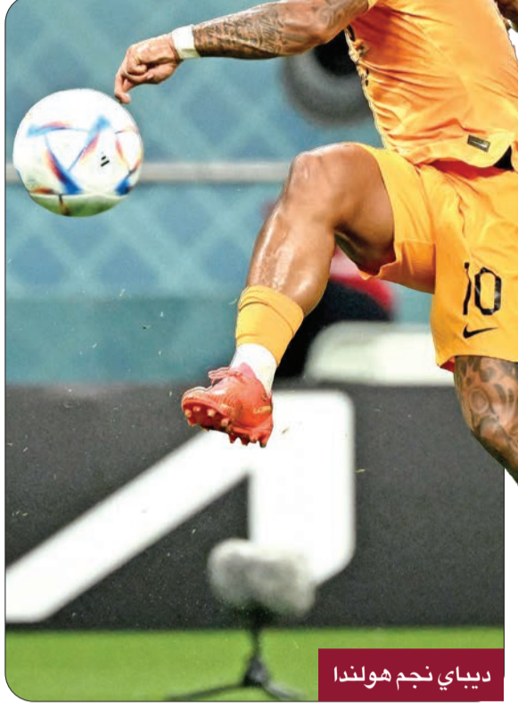
ديباي نجم هولندا

وفي مواجهة الأميركيين الموهوبين ولكن قليلى الخبرة، توج ديباي هجمة رائعة شهدت 21 تمريرة بإحراز الهدف الأول في الفوز 3-1، وكان هدفه الـ43 في 85 مباراة دولية مع هولندا منذ ظهوره الأول عام 2013، مما دفعه إلى التفوق على كلاس-يان هونتيلار، ليصبح على مسافة 7 أهداف من الرقم القياسي المسجل باسم روين فان بيرسي. واجتمع شمل فان خال وديباي من جديد في المنتخب الوطني، وهما يحلمان بقيادة هولندا - التي لم تهزم في 19 مباراة منذ تولي فان خال لقيادة المنتخب الوطني في 2021 - للفوز بأول لقب لها في كأس العالم.