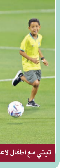
تيتي مع أطفال لاعبي البرازيل خلال حصة تدريبية

ونبه من قوة المنتخب الكرواتي بقوله «علينا أن نكون حذرين في اللعب. شاركت كرواتيا في 6 مونديالات ولها باع طويل، يملكون مودريتش وبيريشيتش اللذين يؤديان مستوى عالياً بتركيبة كبيرة».