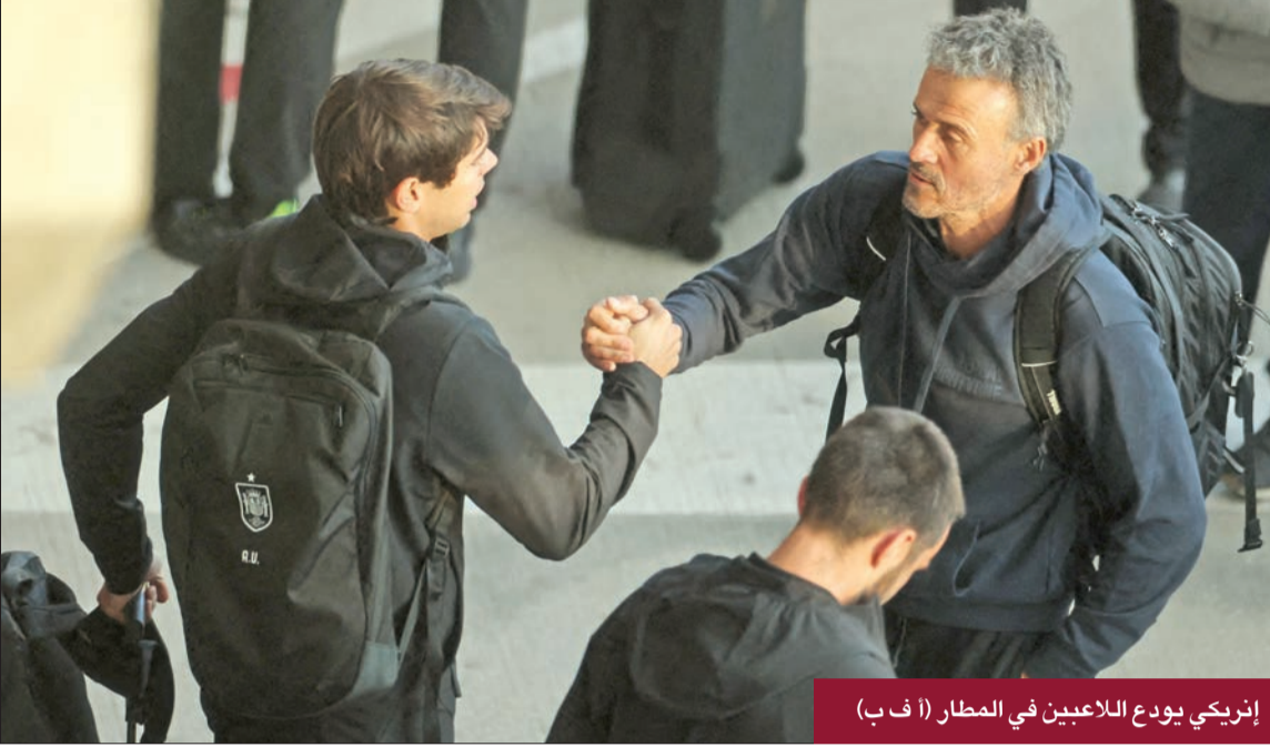
إنريكي يودع اللاعبين في المطار

استعدادا ليورو 2020، التي أقيمت في صيف 2021 بسبب جائحة كورونا، وانتهت المباراة بفوز إسبانيا 4-0. (إفي)