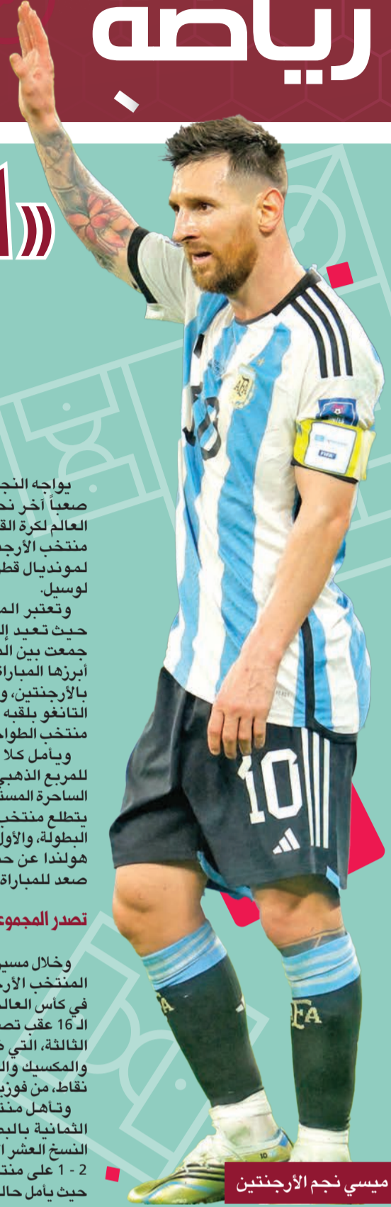
ميسي نجم الأرجنتين

بواجهه النجم الأرجنتيني ليونيل ميسي اختباراً صعباً آخر نحو تحقيق حلمه في إعادة لقب كأس العالم لكرة القدم إلى بلاده من جديد، حينما يلتقي منتخب الأرجنتين نظيره الهولندي بدور الثمانية لمونديال قطر 2022، اليوم (الجمعة)، على ملعب لوسيل. وتعتبر المباراة بمنزلة نهائي مبكر للبطولة، حيث تعيد إلى الأذهان اللقاءات السابقة التي جمعت بين المنتخبين في كأس العالم، والتي كان أبرزها المباراة النهائية لنسخة المسابقة عام 1978 بالبرازيل، والتي توج من خلالها منتخب راقصي التانغو بلقبه الأول في البطولة، عقب فوزه 3-1 على منتخب الطواحين. ويأمل كلا المنتخبين اقتناص بطاقة الترشح للمربع الذهبي في البطولة الأهم والأقوى في عالم الساحرة المستديرة، من أجل مواصلة أحلامهما، حيث يتطلع منتخب الأرجنتين للتتويج بلقبه الثالث في البطولة، والأول منذ 36 عاماً، في حين يبحث منتخب هولندا عن حمل كأس العالم للمرة الأولى، بعدما صعد للمباراة النهائية 3 مرات.