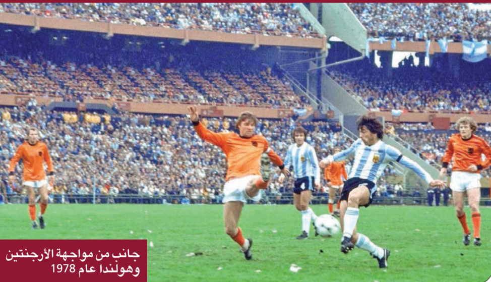
جانب من مواجهة الأرجنتين وهولندا عام 1978

حققت الأرجنتين لقبها الأول بكأس العالم في التمديد، بفضل نجمها ماريو كيميس، الذي افتتح التسجيل في الوقت الأصلي (1-1)، قبل أن يمنح التقدم لبلاده في التمديد، وأرغف رصيده إلى ستة أهداف بالبطولة، لتفوز الأرجنتين في نهاية المطاف 3-1.