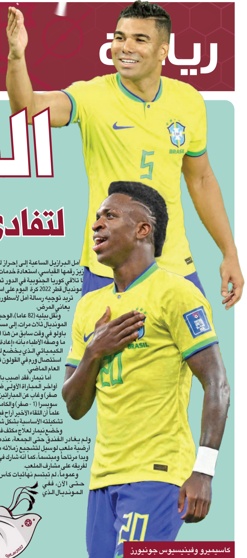
كاسيميرو وفينيسيوس جونيور