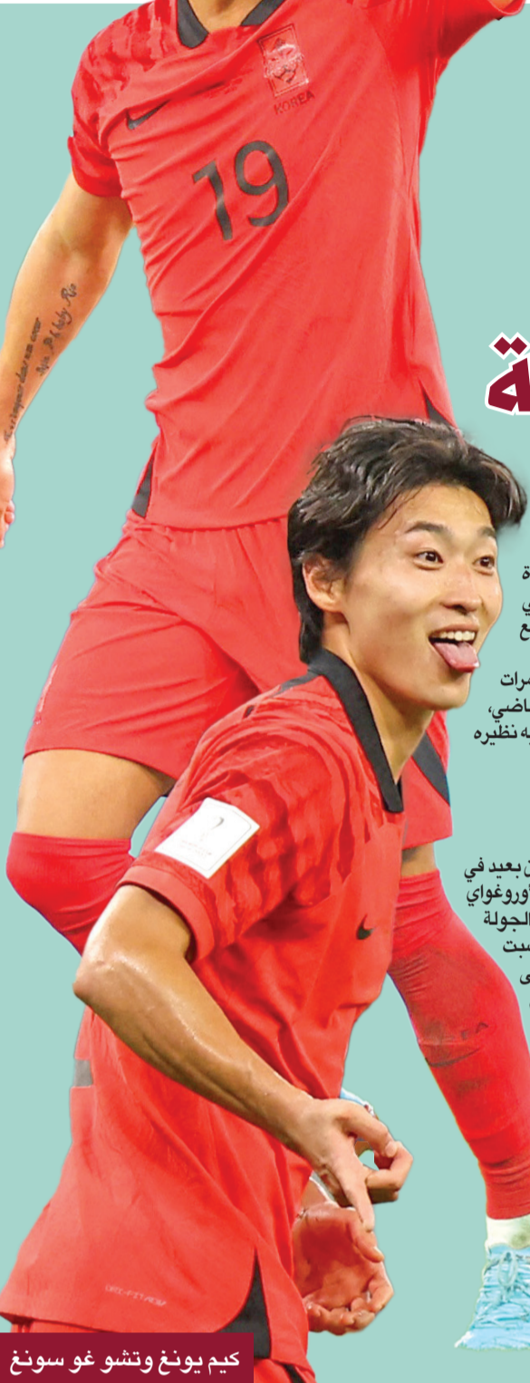
كيم يونغ وتشو غو سونغ