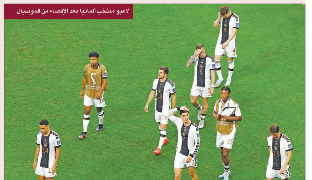
لاعبو منتخب ألمانيا بعد الإقصاء من المونديال

وفيما يعمل الاتحاد الألماني للعبة حالياً على دراسة أسباب الإخفاق في مونديال 2022، يحتاج الاتحاد في نفس الوقت للتفكير في هذه الاحتفالية، التي لن تحدث في 14 ديسمبر الجاري على استاد «البيت» في الخور مثلما كان متوقعاً. ولم يتحدد حتى الآن موعد أو مكان أو الطرف الثاني للمباراة، التي سيحتفل فيها