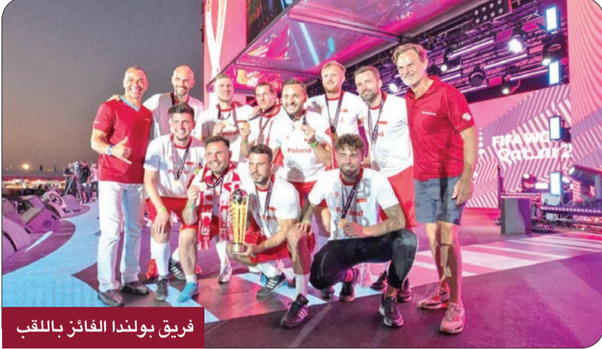
فريق بولندا الفائز باللقب

اختتمت في الدوحة منافسات كأس المشجعين، بمشاركة 32 فريقاً من جماهير الدول التي تتنافس منتخباتها في كأس العالم 2022 لكرة القدم بقطر، بفوز فريق بولندا باللقب. وتوج الفريق البولندي باللقب، إثر فوزه على فريق صربيا 4 - صفر في نهائي أوروبا للبطولة، التي نظمتها اللجنة العليا للمشجعين والإرث، ضمن أنشطتها للتفاعل مع المشجعين، خلال أول نسخة من المونديال تقام في العالم العربي. واستضاف منافسات البطولة مهرجان الفيفا للمشجعين في حديقة البدع بالدوحة، وتواصلت المباريات على مدى أربعة أيام اعتباراً من 29 نوفمبر، بنظام كرة القدم الخماسية، وضمت الفرق مواطني الدول التي تمثلها، وجرى توزيع الفرق