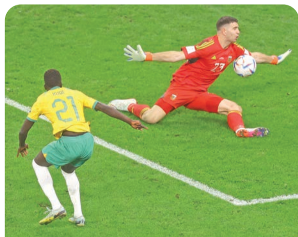
الأسترالي كول وفرصة ضائعة أمام مارتينيز حارس الأرجنتين

بات الأسترالي كول، لاعب منتخب أستراليا، أصغر لاعب يشارك في الأدوار الإقصائية بكأس العالم، بعدما لعب مع منتخب بلاده أمام الأرجنتين في ثمن نهائي مونديال 2022 في قطر، والتي انتهت بفوز «الألبيسيلستي» 2 - 1 وتأهله لدور الثمانية.