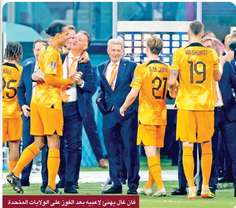
فان غال يهنئ لاعبيه بعد الفوز على الولايات المتحدة

اعتبر مدرب هولندا لويس فان غال، بعد التأهل السبت لربع نهائي مونديال قطر 2022، بفوزه على الولايات المتحدة 1-3، أن فريقه يمكن أن يكون «بطلاً» في هذه النسخة من كأس العالم. وفي مؤتمر صحافي من استاد خليفة الدولي بعد المباراة، قال فان غال (71 عاماً): «قلت ذلك وأكرهه. يمكننا أن نكون أبطال العالم. هذا ما قلته وما أقوله. أنا لا أقول إننا نستكون أتلقى الحب والتقدير من الناس من حولي. النقد شيء ملازم لكرة القدم». وتابع: «أشعر بالسعادة عندما يسجل لاعب فريقتي، وأنا سعيد اليوم، لأن هذه الأهداف كانت رائعة». وصرح المدرب السابق لبرشلونة، الذي يوجد للمرة الثانية في مسيرته على رأس الجهاز الفني لمنتخب «الطواحين»، والذي احتل قبل ثماني والثلاثين في مونديال البرازيل قبل ثماني سنوات، «الأحظ عاطفة الناس، وأقبل النقد على أنه شيء يتناسب مع هذه المهنة، لكن هناك بالفعل فرقاً أفضل خرجت من البطولة، وما رأينا هنا». وتابع: «يمكننا أن نكون أبطال العالم. أنا على هذا النحو، لا أقول إننا نستكون، أو كد، لكننا هنا الآن ولدينا ثلاث مباريات متبقية. وبالطبع يسعدني أن أرى هؤلاء اللاعبين يلعبون، ومن