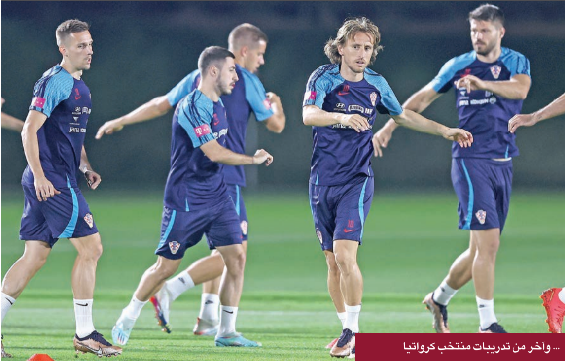
... وأخر من تدريبات منتخب كرواتيا