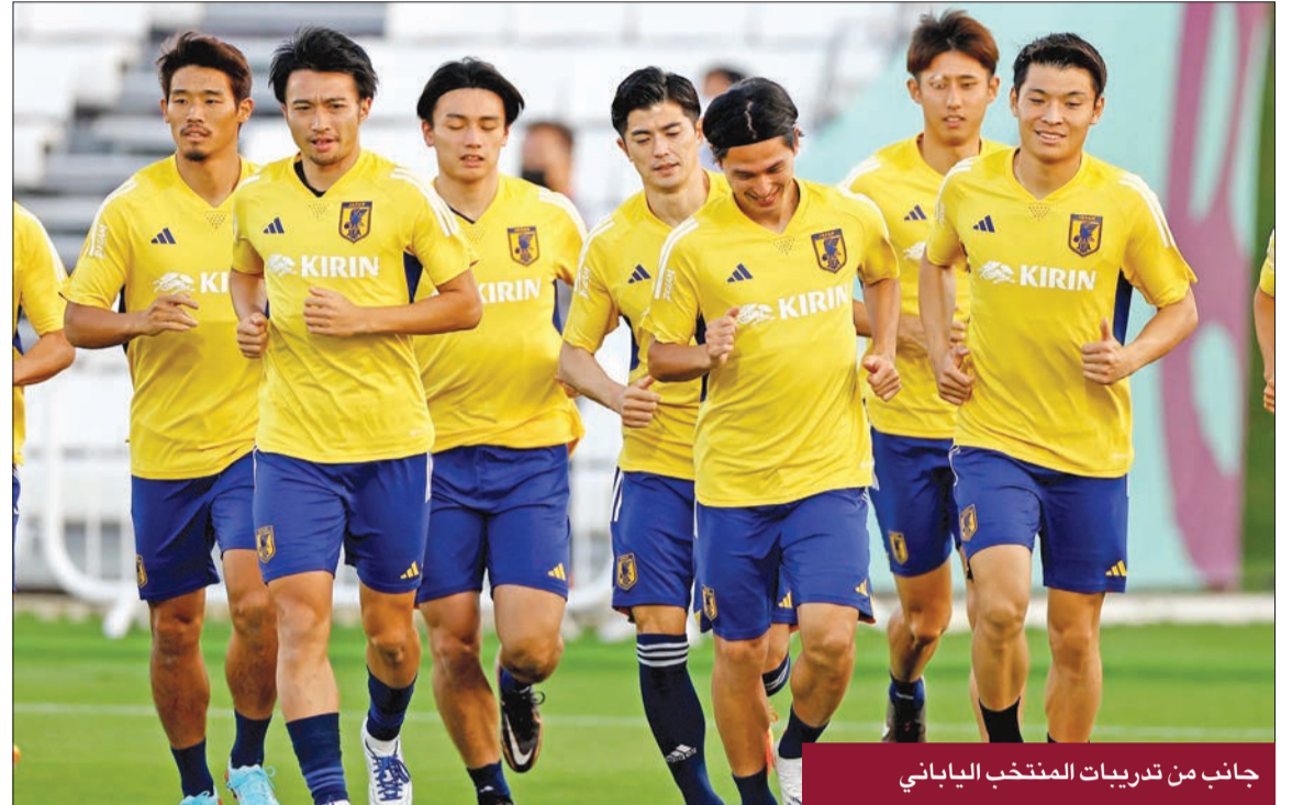
جانب من تدريبات المنتخب الياباني

وهيروكي إيتو (شتوتغارت الألماني) دفاعاً. أما في الوسط، فهناك إيتارو إندو (شتوتغارت)، وغازكو شيباساكي (ليغانيس الإسباني)، ورييسو دون (فرايبورغ الألماني)، وكارو ميخوما (برايتون الإنكليزي)، وناكومي مينامينو (موناكو الفرنسي)، وناكيتشي كامادا (إينتراخت فرانكفورت الألماني)، وأو تاناكا (فورتونا دوسلدورف الألماني).