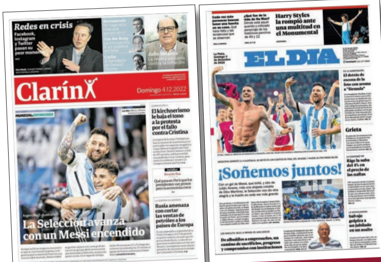
علاف صحيفتي إيديا وكارليرين

تغلبت الأرجنتين على أستراليا وستلعب ربع نهائي المونديال بقطر.