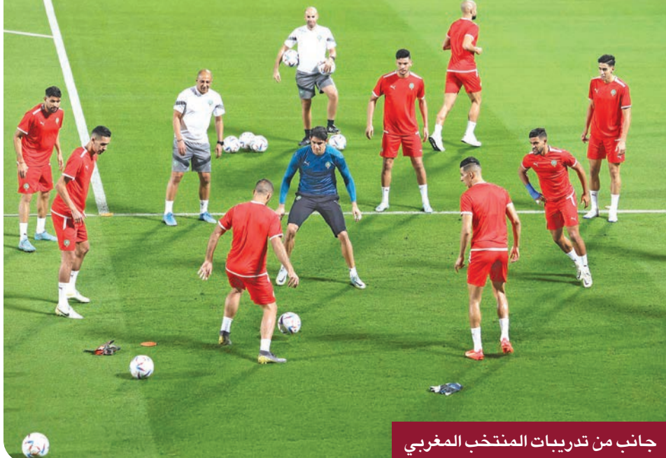
جانب من تدريبات المنتخب المغربي

وكان بصير في عداد المنتخب في مونديال 1998 حيث سجل هدفاً في مرمى اسكتلندا (3 - صفر)، واحترف في الدوري الإسباني مع بيبورتيفو لا كورونيا