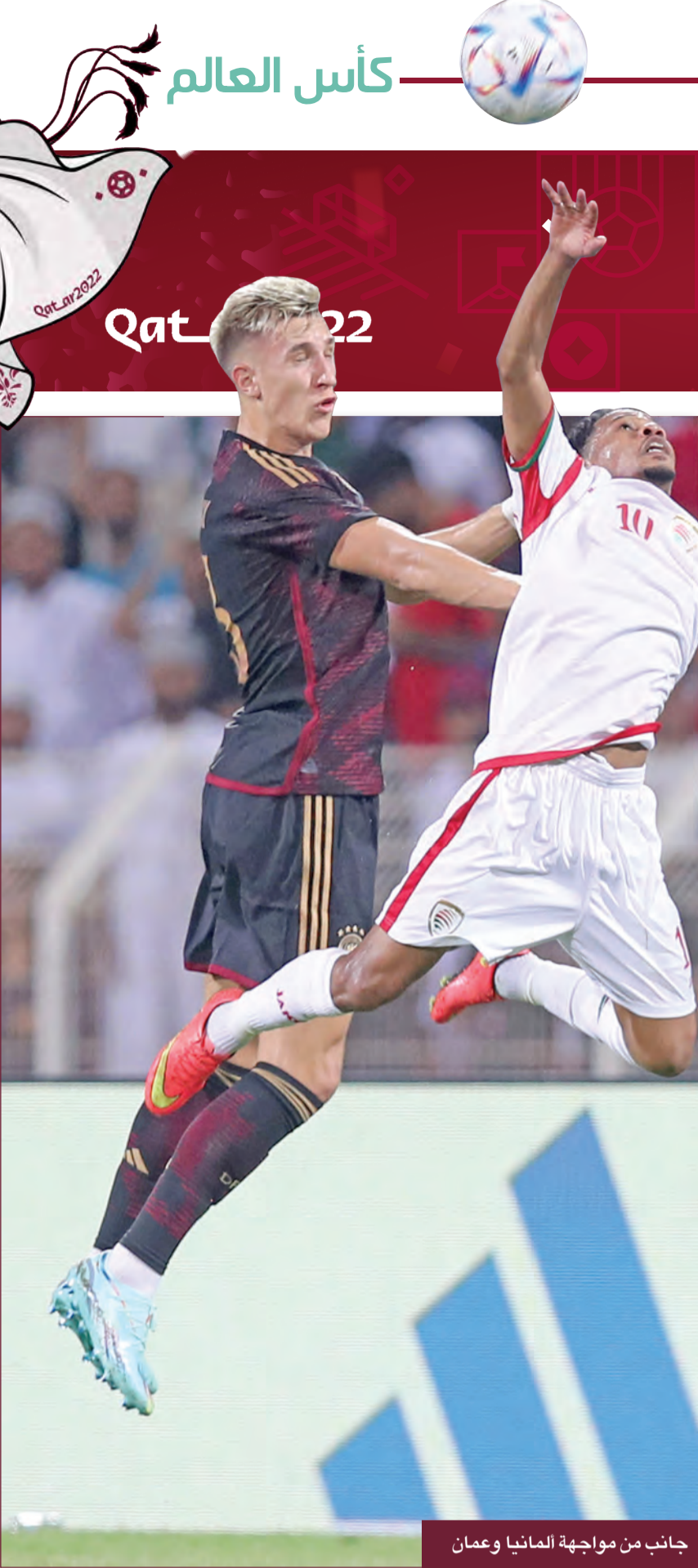
جانب من مواجهة ألمانيا وعُمان

على مرمى الحارس مانويل نوير (20). وكاد واعد بوروسيا دورتموند يوسوفا موكوكو يسجل في أول مشاركة دولية له، لكن تسديده القوي إثر عرضية ديفيد راوم أصابت القائم (45). بات موكوكو، الذي يحتفل بعيد ميلاده الـ18 يوم افتتاح كأس العالم 2022 بين قطر والإكوادور في 20 الجاري، أصغر لاعب ألماني يتم استدعاؤه للعب في المونديال. واستمر المخيني في تألقه، وتصدى لكرة غوندوغان على دفعتين (51).