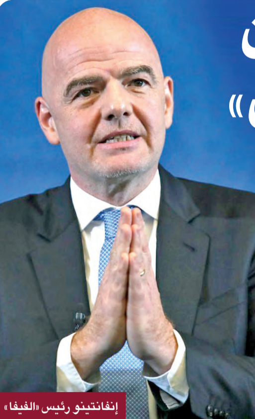
إنفانتينو رئيس «الفيفا»

وقال جباتي إنفانتينو رئيس «الفيفا»: «يلتزم الفيفا بتهيئة أفضل الظروف الممكنة للاعبين لتقديم أفضل ما لديهم من إمكانات في كأس العالم، ويسعدنا إطلاق خدمة ستساعد في حماية اللاعبين من الآثار الضارة التي يمكن أن تسببها منشورات وسائل التواصل الاجتماعي على صحتهم النفسية ورفاهيتهم». وراقب «الفيفا» حسابات وسائل التواصل الاجتماعي لجميع المشاركين في كأس العالم بالبحث عن التعليقات المسيئة والتمييزية والتهديدية التي قد يراها الجمهور، ثم إبلاغ شبكات التواصل الاجتماعي