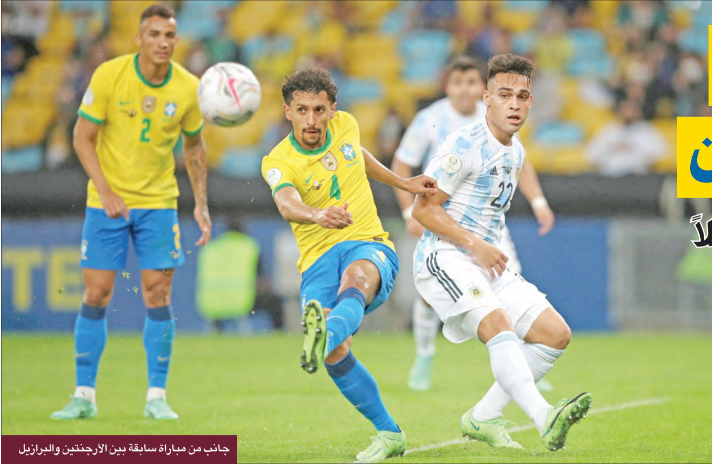
جانب من مباراة سابقة بين الأرجنتين والبرازيل

والبرازيل، أرى أنهما قويتان للغاية، على صعيد الأفراد، أرى فرنسا المنتخب الأوربي الوحيد القادر على المنافسة، ولكن لست متأكدًا من ذلك على صعيد المجموعة... فرنسا، على غرار إيطاليا قليلاً، تضع أحياناً ولا تحقق النتائج القادرة على تحقيقها، وربما بلجيكا، لأنني أحب كثيراً (حارسها تيبو كورتوا).