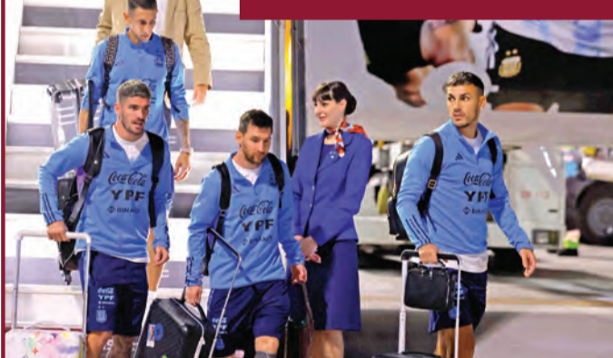
بعثة المنتخب الأرجنتيني لدى وصولها إلى مطار حمد الدولي

وصل النجم الأرجنتيني ليونيل ميسي إلى العاصمة القطرية «الدوحة»، أمس الأول، على رأس تشكيلة منتخب بلاده التي ستخوض غمار منافسات مونديال 2022، التي تنطلق الأحد المقبل. وحطّت طائرة منتخب «التانغو» في الدوحة، آتية من أبوظبي، حيث خاضت الأرجنتين مباراة استعدادية مع الإمارات، وفازت بخماسية نظيفة، بأربعة رصيدها إلى 36 مباراة تالياً من دون خسارة.