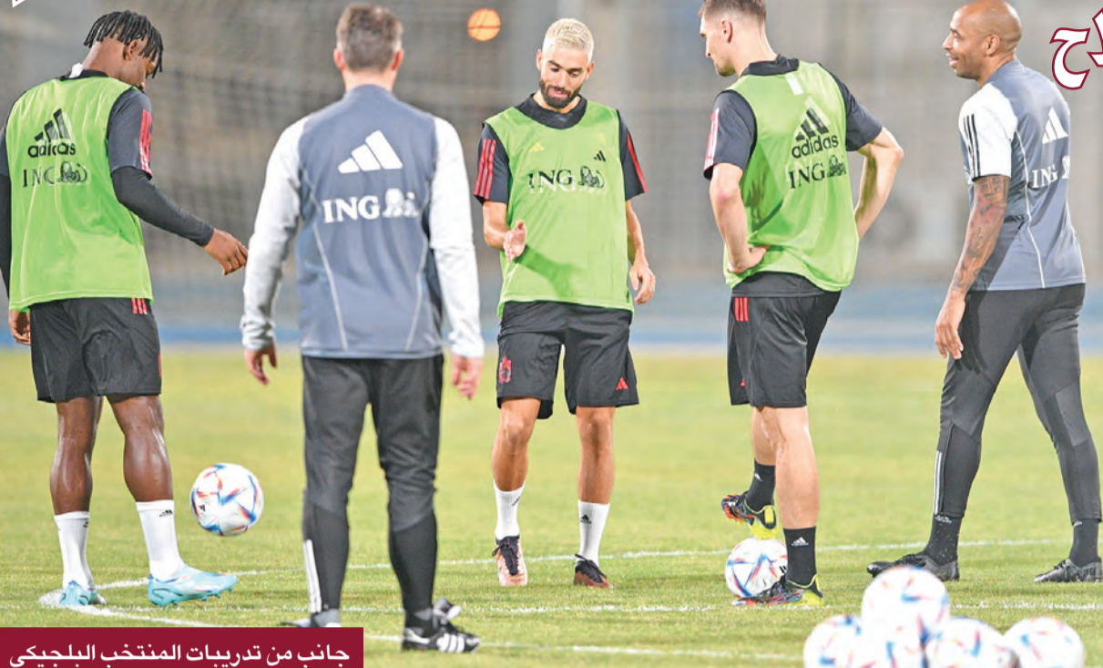
جانب من تدريبات المنتخب البلجيكي

المنافس الذي يعد أحد أفضل المنتخبات في العالم، وعن الاستقبال الحافل لنجم المنتخب المصري محمد صلاح، قال العطار: «جمهور الكويت استقبال محمد صلاح استقبالاً رائعاً، كونه فخر العرب، وحرص اللاعب على توجيه الشكر إلى الجمهور الكويتي والمصري أيضاً، الذي احتفى به فور وصوله إلى الكويت».