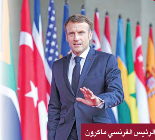
الرئيس الفرنسي ماكرون

اعتبر الرئيس الفرنسي إيمانويل ماكرون أنه «يجب عدم تسييس الرياضة، في وقت يستمر الجدل حول استضافة قطر بطولة كأس العالم لكرة القدم، قبل يومين من انطلاقها، خصوصاً بسبب سجل الإمارات الحقوقية». وقال ماكرون، الذي يدافع منتخب بلاده عن اللقب العالمي الذي حققه في روسيا عام 2018، «اعتقد أنه يجب عدم تسييس الرياضة»، وذلك خلال حديثه مع