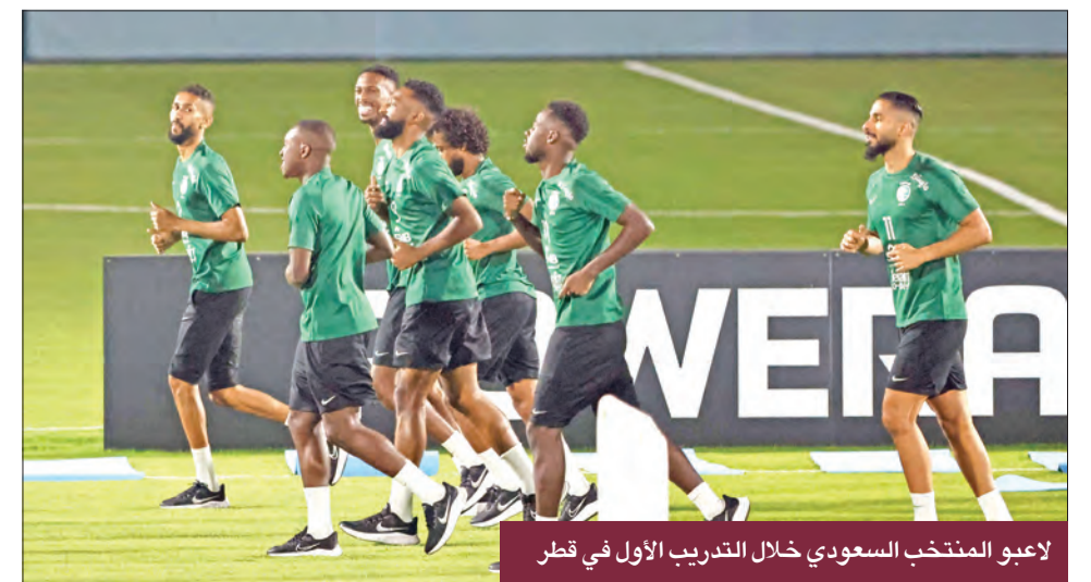
لاعبو المنتخب السعودي خلال التدريب الأول في قطر