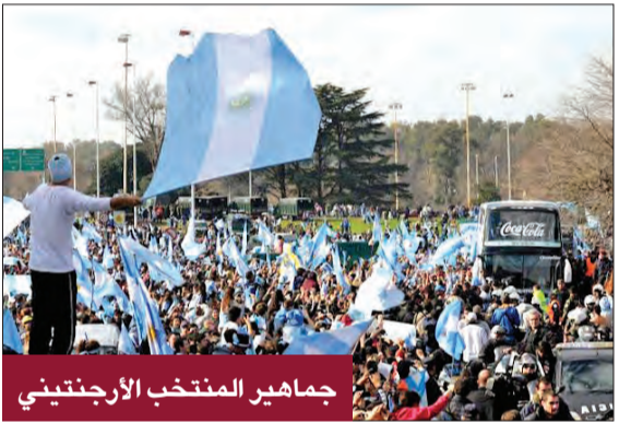
جماهير المنتخب الأرجنتيني

اعتبرت وسائل الإعلام الفرنسية، أن الأغنية العنصرية والمهينة من جانب عدد من الجماهير الأرجنتينية التي تم بثها مباشرة على قناة تلفزيونية أرجنتينية، اللدلة الماضية، تقدم «صورةً بغضبة» وعنصرية مباشرة». وردت الجماهير خلال مداخلة لمراسل قناة TYC من الشارع أغنية تسخر من الأصول الإفريقية لبعض اللاعبين الفرنسيين، وتهاجم نجم منتخب «الديوك» كيليان مبابي. تقول الأغنية، مثلاً: «لعبون لفرنسا ولكنهم كلهم من أنغولا» أو «جدته نيجيرية، جده نيجيري، ولكن في مسند هويته جنسيته فرنسية». وذكرت الإذاعة الفرنسية، أن «العنصرية كانت على الهواء مباشرة»، في حين اعتبرت إذاعة راديو مونت كارلو أن القناة بثت «صورةً بغضبة». ولم يعلق الاتحاد الفرنسي لكرة القدم ولا مبابي على هذا الأمر، الذي يحدث قبل أربعة أيام من مونديال قطر. وكانت فرنسا فازت على الأرجنتين في مونديال روسيا 2018، بفضل مجهود كبير لمبابي، الذي تحوّل على ركلة جزاء حينها وسجّل هدفاً. واعتبر راديو مونت كارلو، أن الجماهير الأرجنتينية «تنتقم بأسوأ الطرق بعد أربع سنوات، من تلك المباراة».