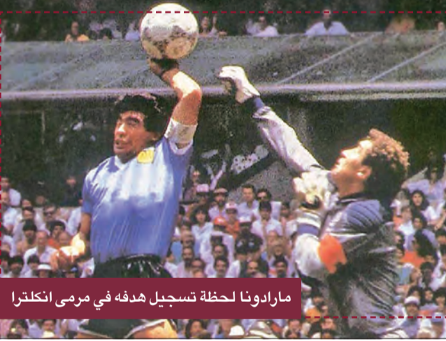
مارادونا لحظة تسجيل هدفه في مرمرى إنكلترا

يتفاوض مشترون محتملون على شراء الكرة التاريخية التي سجل بها دييغو مارادونا هدف في مباراة ربع نهائي مونديال المكسيك 1986 بين الأرجنتين وإنكلترا، بعدما لم تصل العروض إلى الحد الأدنى في مزاد في بريطانيا. وأشارت دار مزادات غراهام بود، في تصريحات له، إلى أن العروض المتلقاة كانت أقل من السعر الأولي البالغ 2.5 مليون استرليني (2.9 مليون يورو)، ولكن الكرة جذبت اهتمام «عدة مشتريين محتملين».