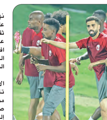
جانب من تدريبات المنتخب القطري

صحيح أن الاتحاد القطري لكرة القدم وإدارة المنتخب وفرت برنامجاً يبدو خيالياً لمنتخب عربي أسبوي، قياساً بالتجارب التي خاضها اللاعبون سواء بالمشاركة في كوبا أميركا أو الكأس الذهبية ثم التصفيات الأوروبية بصفة اعتبارية دون احتساب النتائج، بيد أن الخبرات التي