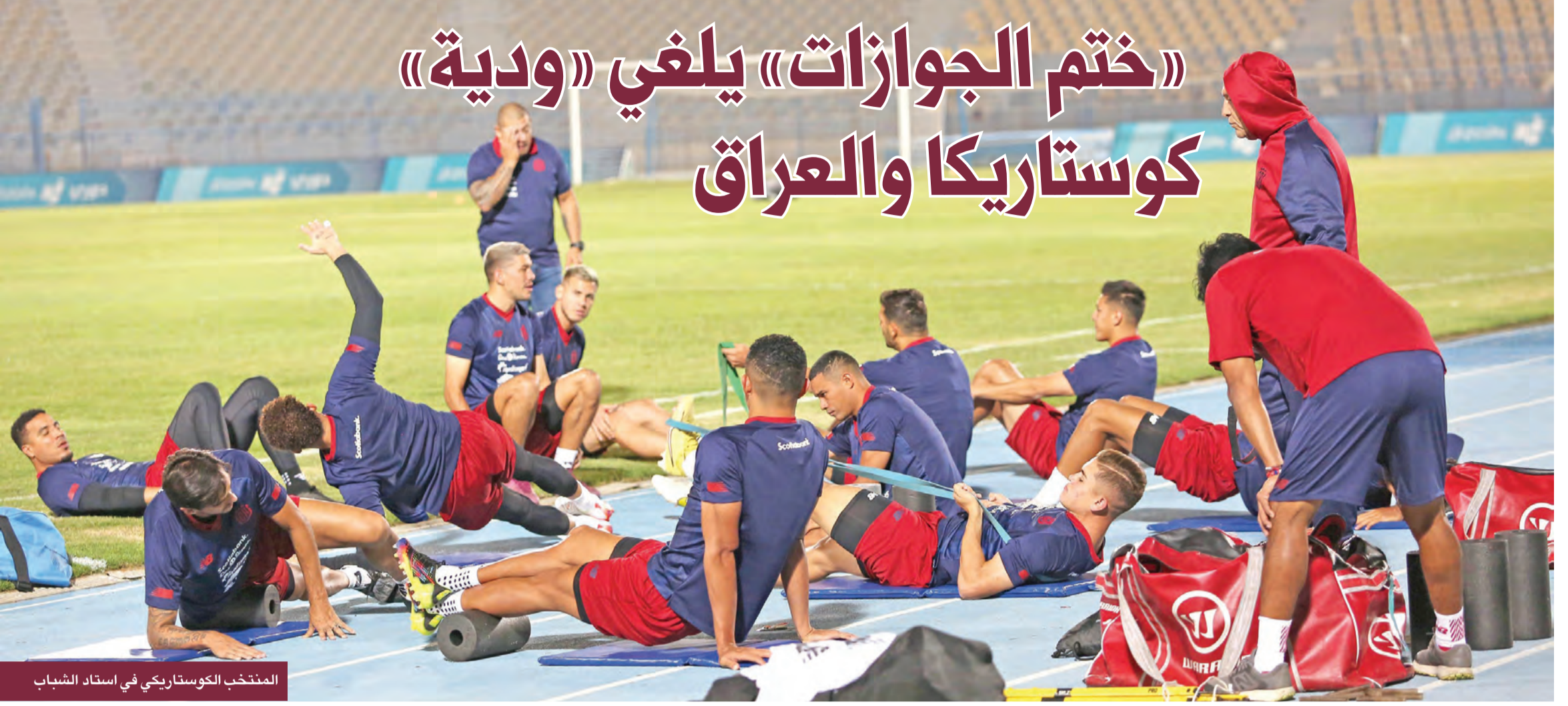
المنتخب الكوستاريكي في استاد الشباب

وأضاف فيلاليوبوس في تصريح: «ملأنا الشكوك وانعدام الأمن وانعدام الثقة»، مؤكداً أن اللاعبين رفضوا عبور الحدود، والمدرّب أبلغه بعدم رغبته في إقامة المباراة. (أ ف ب)