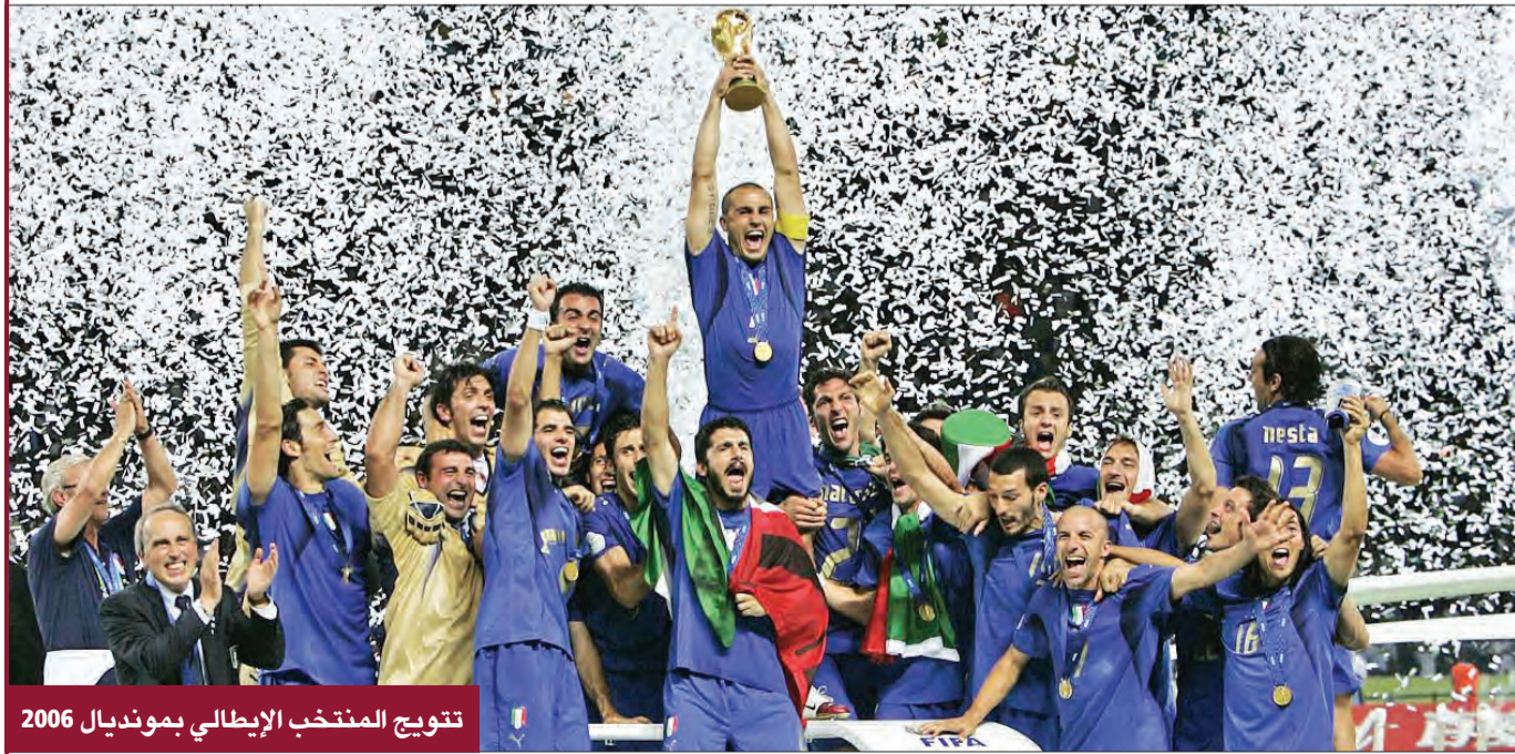
تتويج المنتخب الإيطالي بمونديال 2006

الخامسة الأخيرة لإيطاليا. آخر ركلة ترجيح سددها كانت قبل خمس سنوات عندما كان بالدرجة الرابعة «كنت مذبولاً، لماذا أنا؟» أطلق تسديدة رائعة خدعت الحارس فابيان بارزين: إيطاليا بطلت للعالم مرة رابعة.