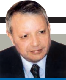
صالح القلب كاتب وسياسي أردني